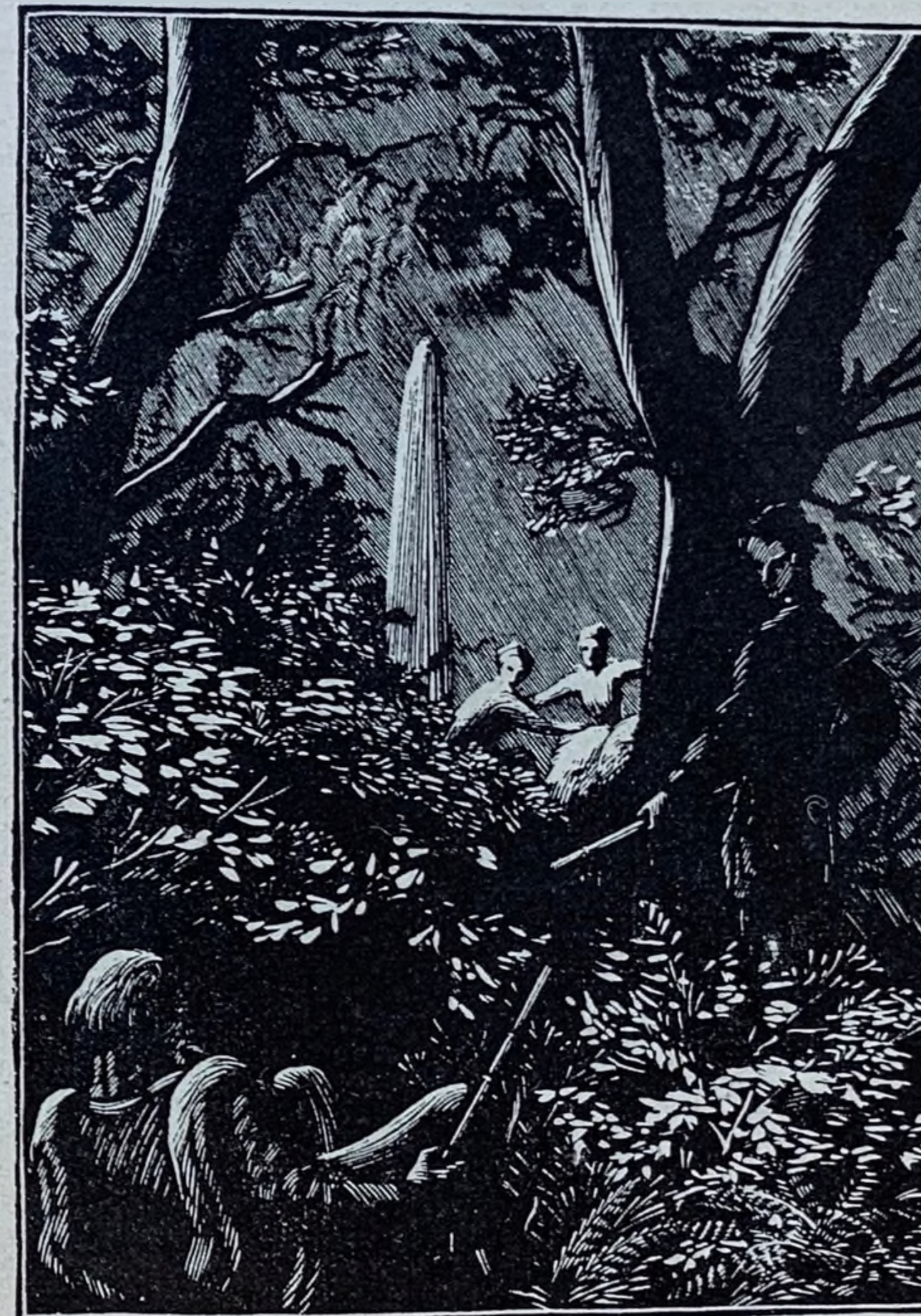
IV. G. ECZEISTOW – ILUSTRACJA DO MICKIEWICZA (Drzeworyt)