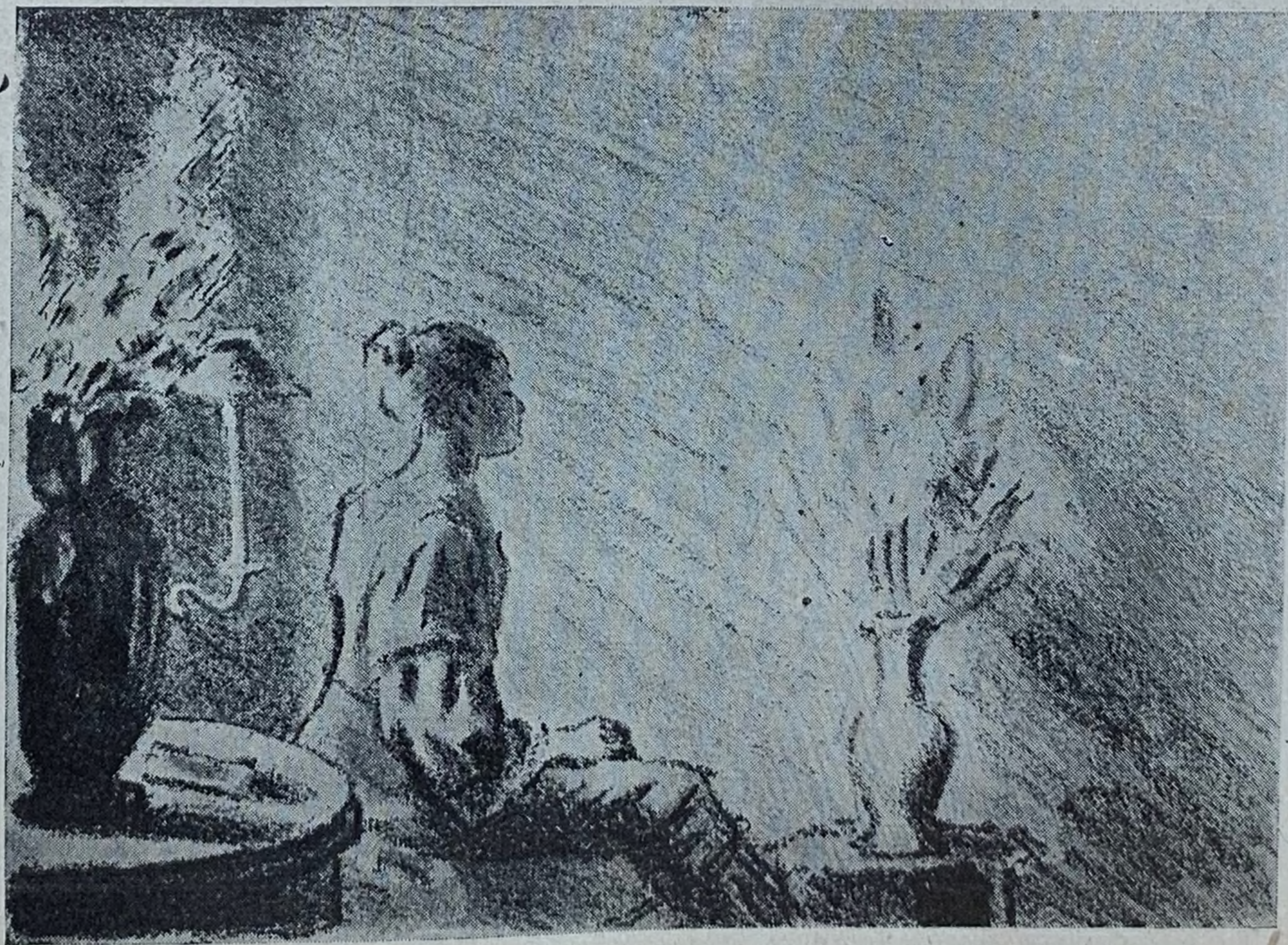
VII W. KIBRIK—ILUSTRACJA DO POWIEŚCI ROMAIN ROLLANDA „ZACZAROWANA DUSZA“ — (Litografia)