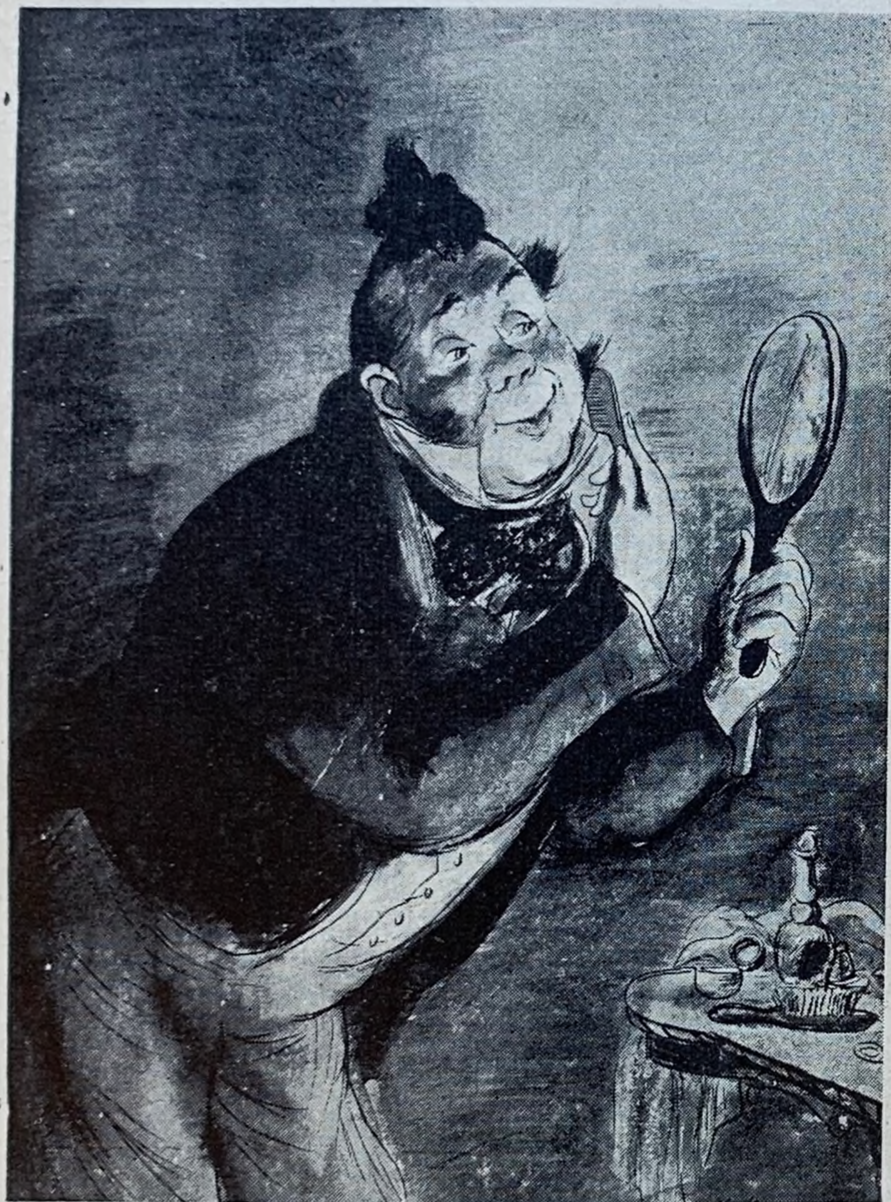
V. KURRYNKSY – ILUSTRACJA DO POWIĘSCI „MARTWE DUSZE“ M. GOGOLA.