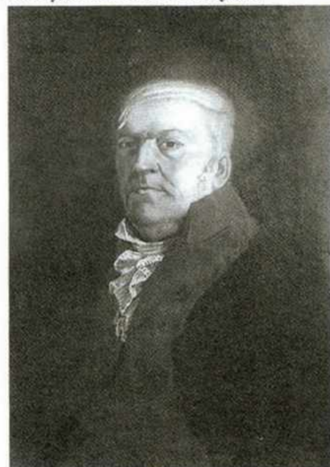
411. Величковский А.И. «Портрет премьер-майора Ивана Степановича Тевяшова, последнего полковника Острогжского полка». XIX в. Холст, масло. 71x62 см. Пропала из Острогжского художественного музея.