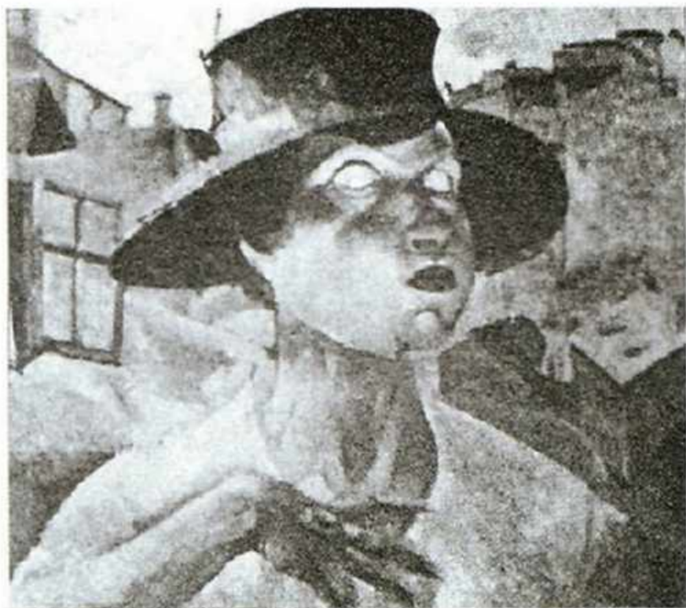
407. Григорьев Б.Д. «Дама в черной шляпе с рыжими волосами». Начало XX в. Холст, масло. 71x71 см. Пропала из Смоленского музея-заповедника.