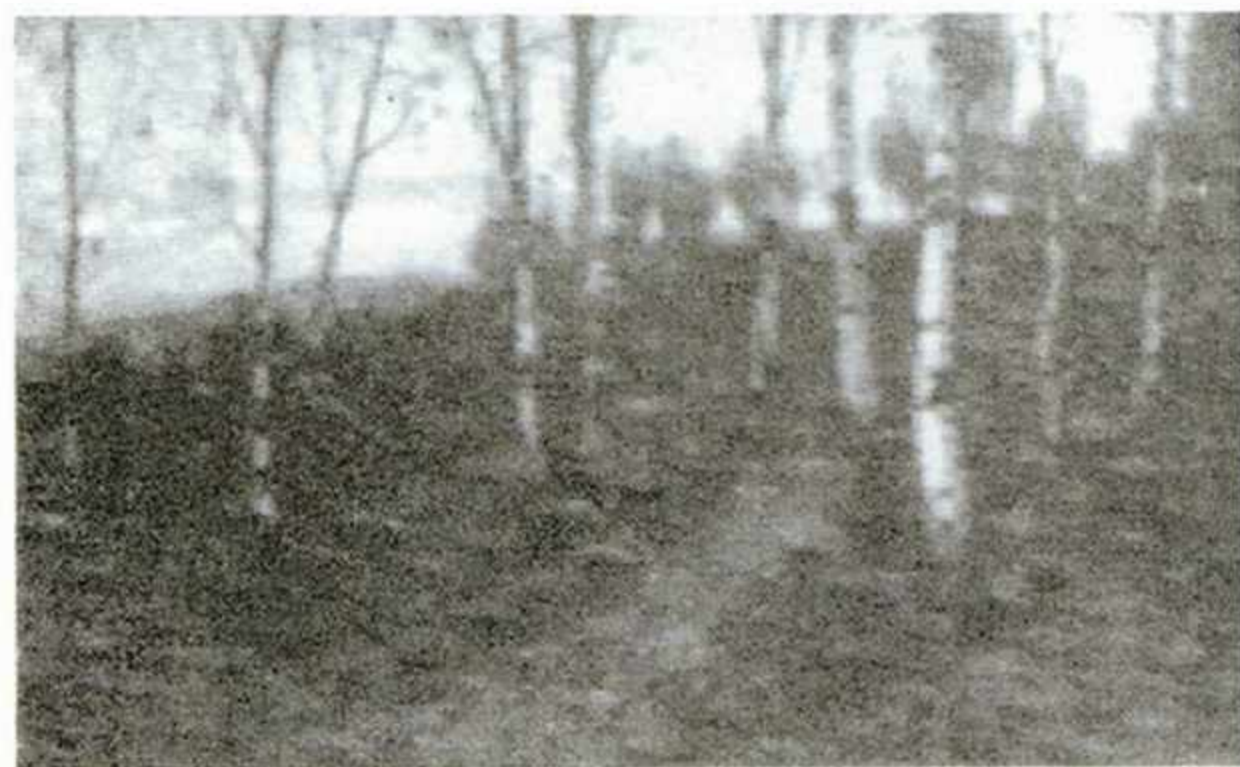
409. Бровар Я.И. «Опушка березовой рощи раннею весною». XIX в. Холст, масло. ? x ? см. Пропала из Острогжского художественного музея.