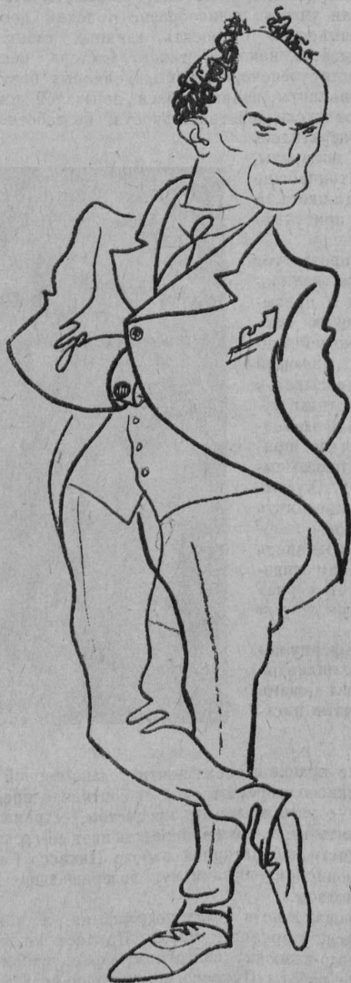
С. М. Михоэлс (Шарж худ. Натана Альтмана).

Спектакли Госета национальны, бытовы и необычайно высоки в сценическом искусстве.