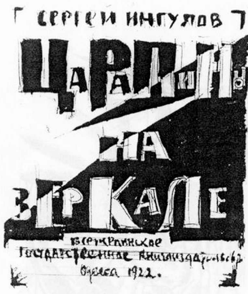
Эскиз обложки. 1922