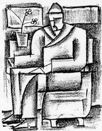
1896 • МОИСЕЙ БРОДСКИЙ • 1944