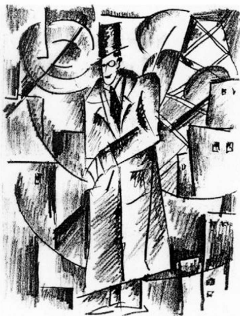
Мужчина на фоне города. Эскиз. 1920-е

или в большое агитационное панно ("Рабочие и буржуи").