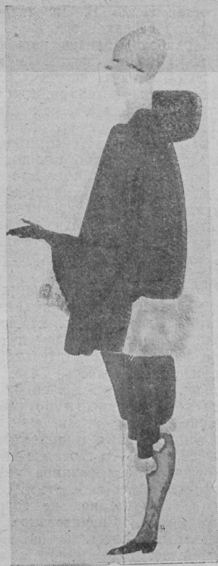
Эскиз костюма. Рис. Н. П. Акимова