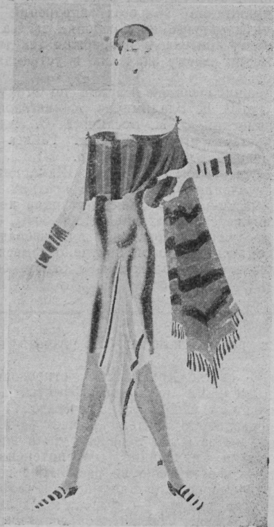
Эскиз костюма. Рис. Н. П. Акимова

1. Многообразие сценических направлений, существующих в современном советском театре, находящемся в периоде своего творческого роста, обязывает