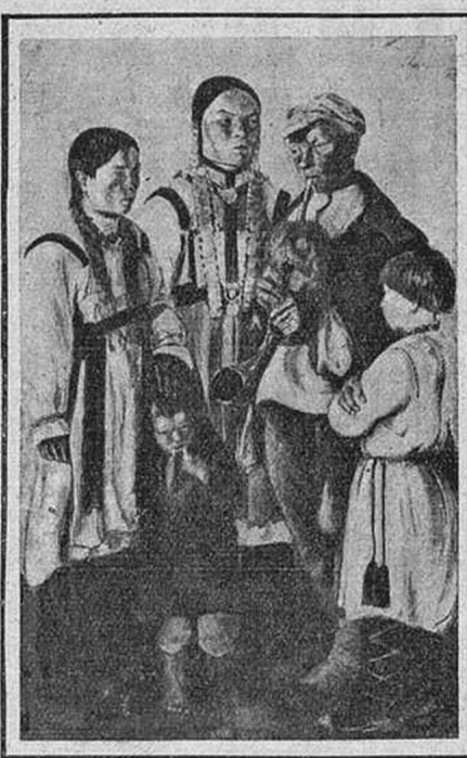
Ф.БОГОРОДСКИЙ. АХРР. ЧУВАШИ