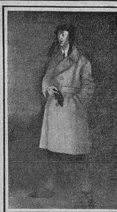
П.ВИЛЬЯМС. ОСТ ПОРТРЕТ Н.ОХЛОПКОВА