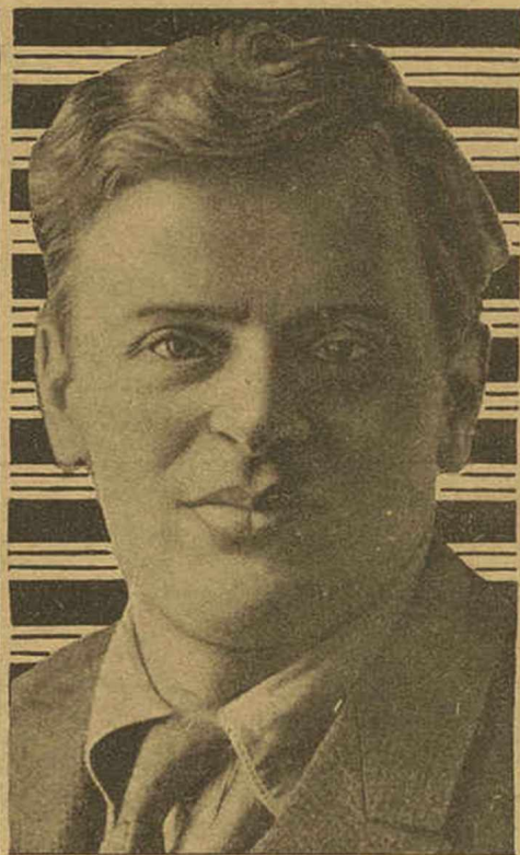
ПРЕДСЕДАТЕЛЬ Ц. К. ПРОЛЕТКУЛЬТА В. ПЛЕТНЕВ