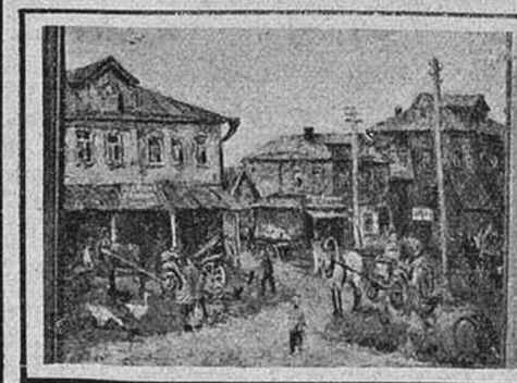
Д.МУРАШЕВ. БЫТИЕ. В УЕЗДНОМ ГОРОДКЕ