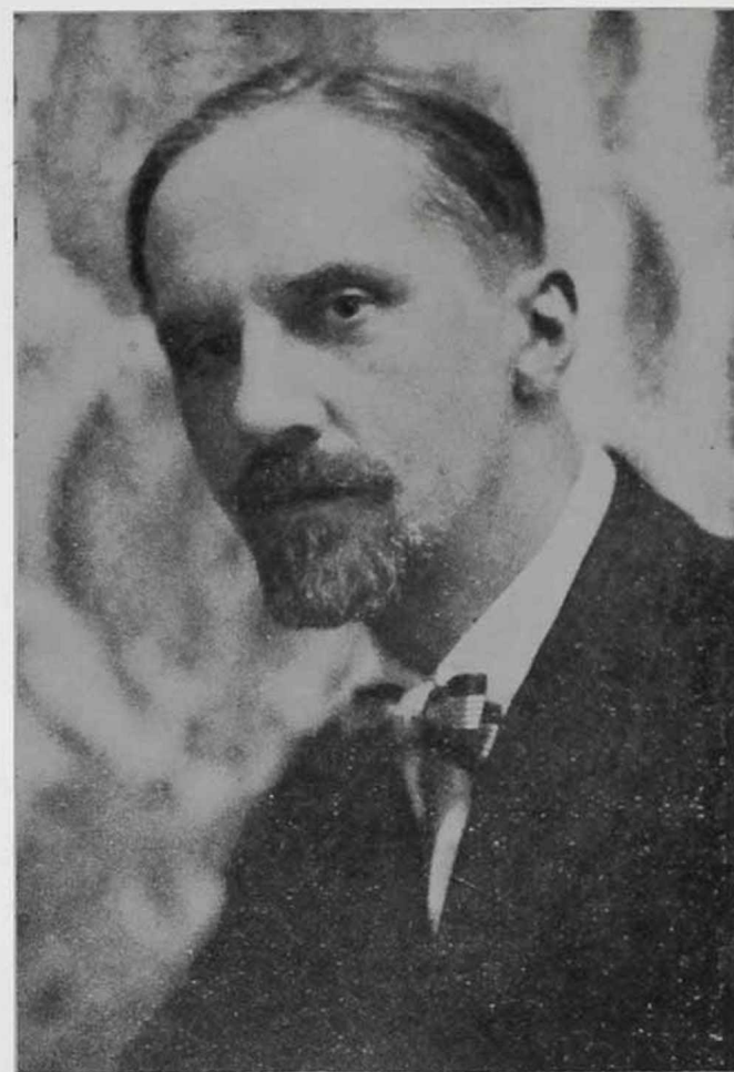
И. Я. Билибинъ.