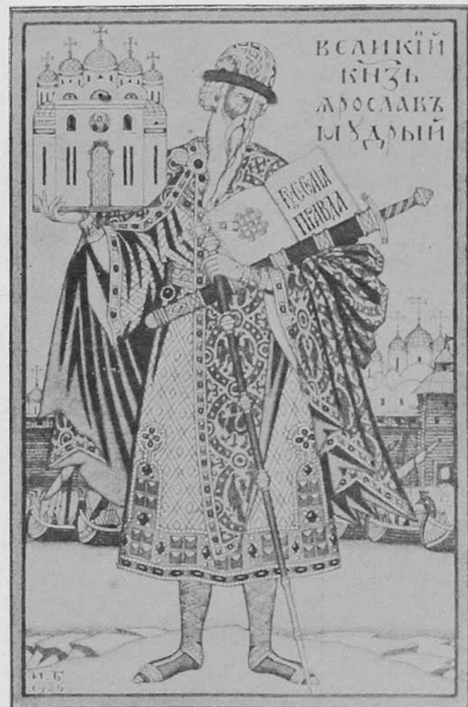
Великій князь Ярославъ Мудрый.