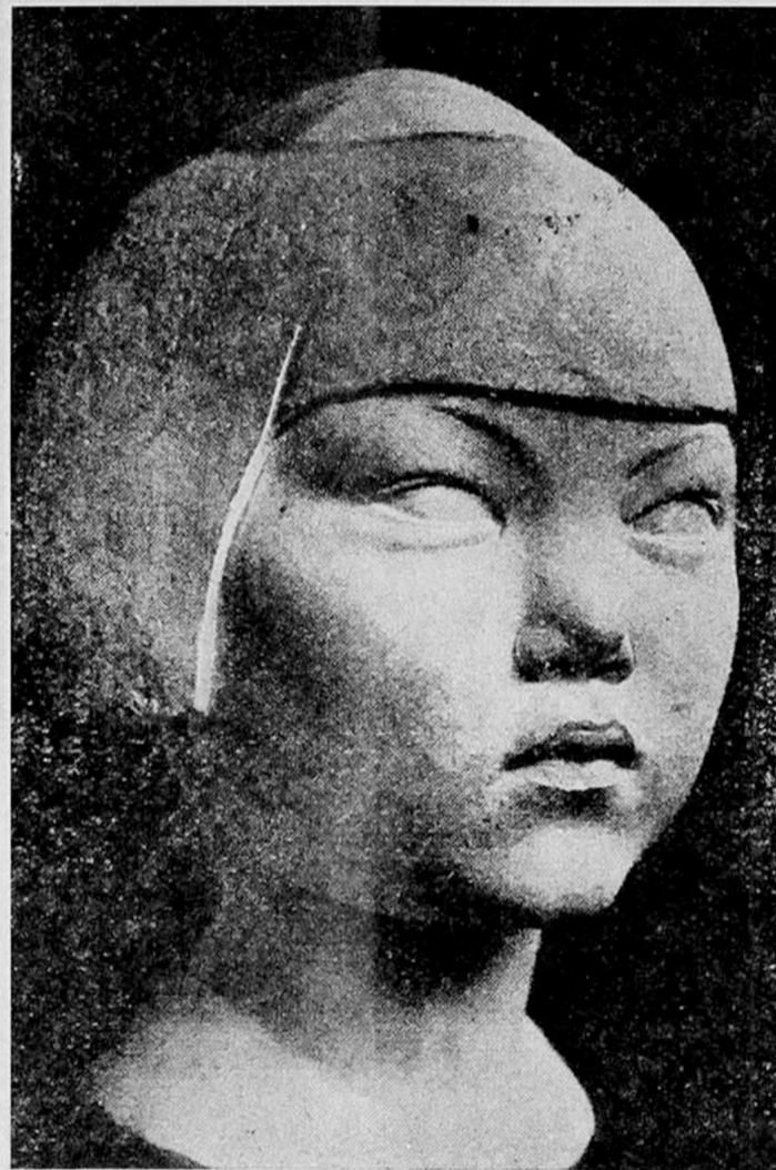
М. Чернякъ: Китайская дѣвочка.

Въ Осеннемъ Салонѣ, отыскивая въ огромныхъ залахъ «Гранъ Палэ» запечатлѣнія творчества русскихъ художниковъ — и часто приходя въ отчаяніе отъ всего видѣннаго! — я отмѣтилъ и запомнилъ скромно пріютившіяся — всего въ какихъ-нибудь двухъ шагахъ отъ высѣченнаго изъ гигантскаго камня бушующаго «Побѣдителя Олимпійскихъ Игръ» — сосредоточенно тихія, спокойныя небольшія скульптуры: «Кролика», «Колѣнопреклоненную женщину» и мраморную головку «Китайской дѣвочки». Было пріятно отмѣтить, что въ каталогѣ противъ этихъ вещей значилось, что авторъ ихъ «родился въ Смоленскѣ, въ Россіи».