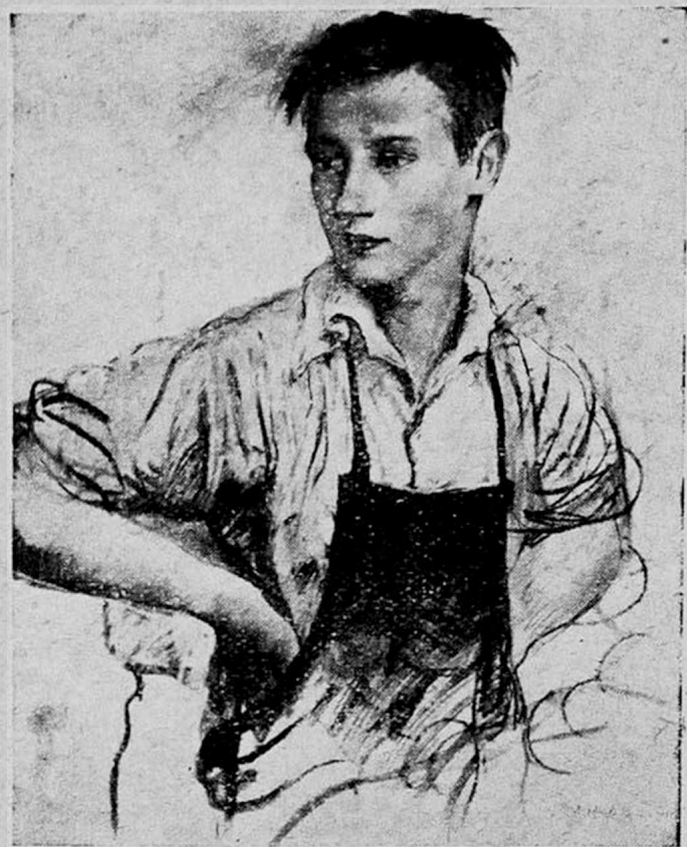
З. Е. Серебрякова: Портретъ сына художника.

Въ Парижѣ у Шарпантье выставка З. Е. Серебряковой. Я думаю — многіе помнятъ ея портретъ «За туалетомъ», находящійся теперь въ Третьяковской Галлерей. Это было давно: почти уже 20 лѣтъ прошло съ тѣхъ поръ, когда эта художница какъ то сразу этимъ выступленіемъ въ «Мірѣ Искусствъ» стала извѣстной и петроградцамъ, и москвичамъ. Эту картину З. Серебряковой мы полюбили съ перваго же взгляда и о ней вспоминаемъ и здѣсь, на чужбинѣ. О послѣдующемъ творествѣ З. Серебряковой мы знаемъ лишь частично.