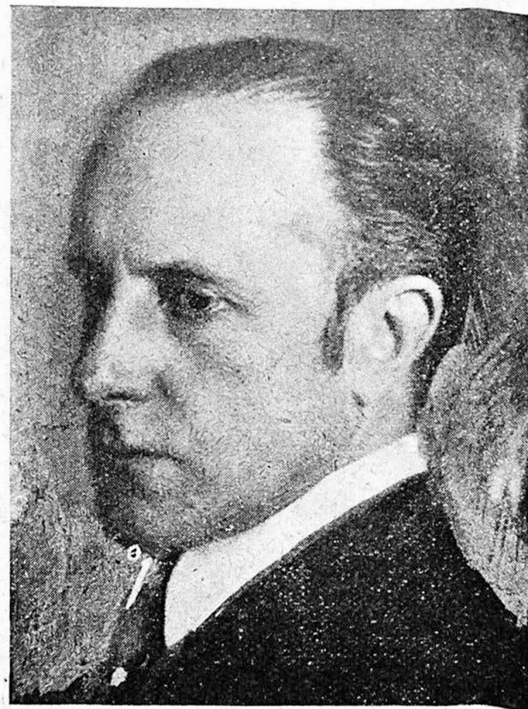
М. В. Добужинскій.

Для театра Добужинскій возсоздалъ не только «Бѣсовъ» Достоевскаго (постановка «Художественнаго театра»), или позднѣйшаго «Короля Лира», или «Пиковую Даму», но и «Мѣсяцъ въ деревнѣ» — залитый солнцемъ лирической гармоническій міръ Тургенева — или совсѣмъ недавно для постановки въ Дрезденѣ «Евгенія Онѣгина», навѣвающаго на насъ столько мирныхъ и сладостныхъ воспоминаній