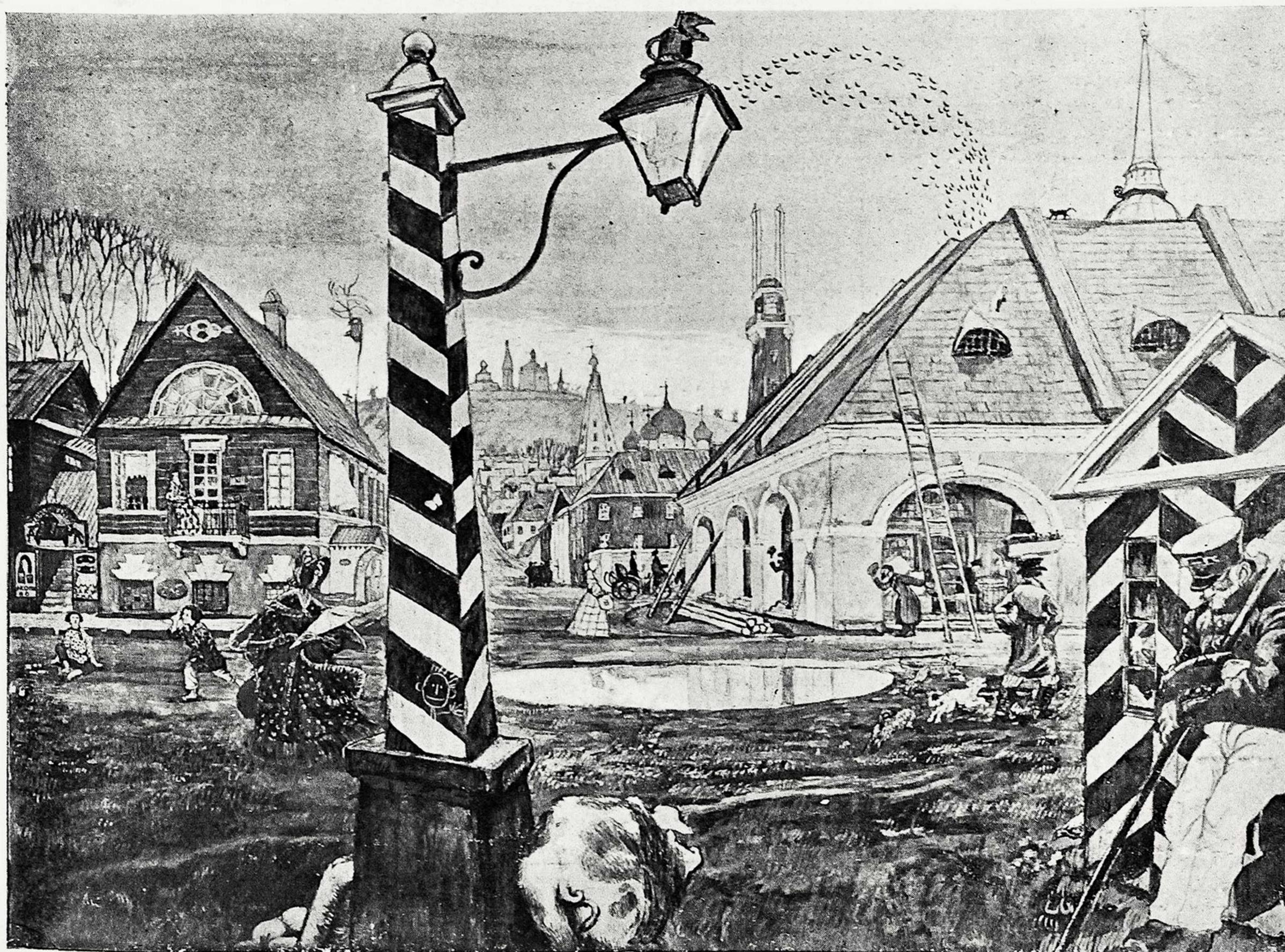
М. В. Добужинскій: Русская провинція. — 50-е годы прошлаго столѣтія.

M. Doboujinsky: La province russe en 1850.