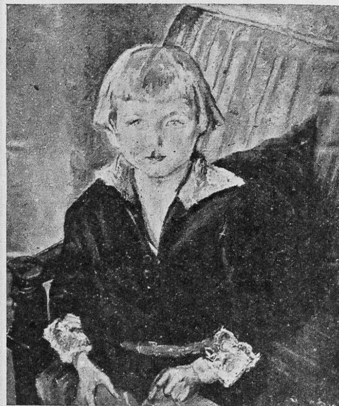
А. Араповъ : Портретъ