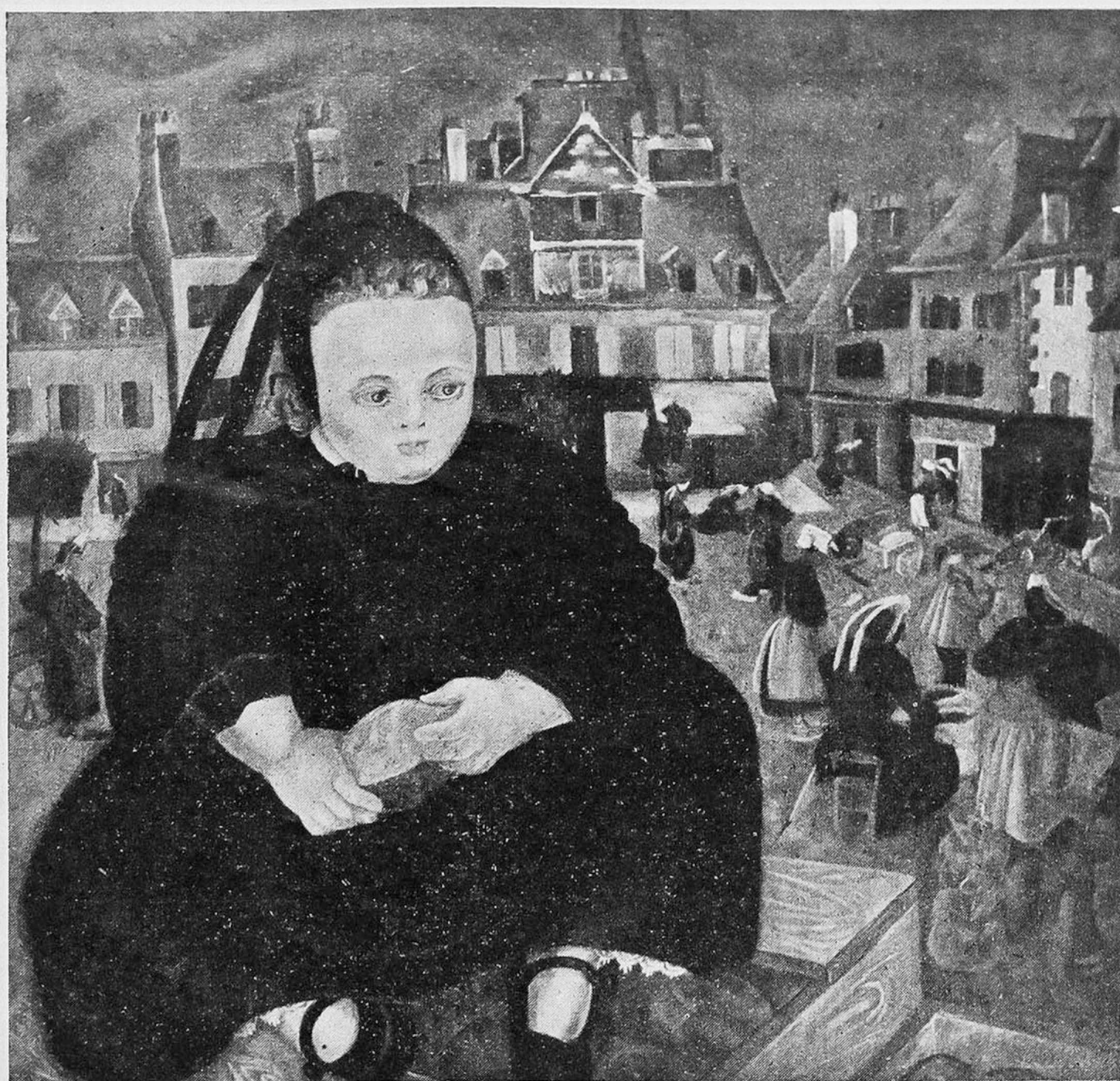
Анна Дюшенъ : На рынкѣ въ Кэмперѣ (Бретань).

Вотъ одна изъ его большихъ композицій. Здѣсь тотъ же чарующій колоритъ, но въ представленныхъ здѣсь застывшихъ монументальныхъ женскихъ фигурахъ, поднимающихся