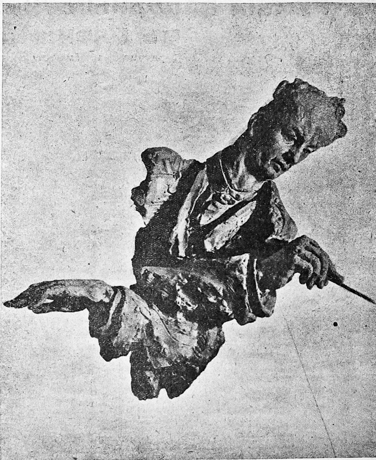
А. Архипенко: Портретъ дирижера Вильгельма Фертвеглера.

Архипенко заявляетъ, что до него изъ всѣхъ искусствъ только одна музыка использовывала время въ качествѣ творческаго элемента, теперь «Архипейнтюра» живописуетъ время». Прежде старое изобразительное искусство творилось въ сферѣ «неподвижнаго пространства», теперь «архипейнтюра» такъ же, какъ и