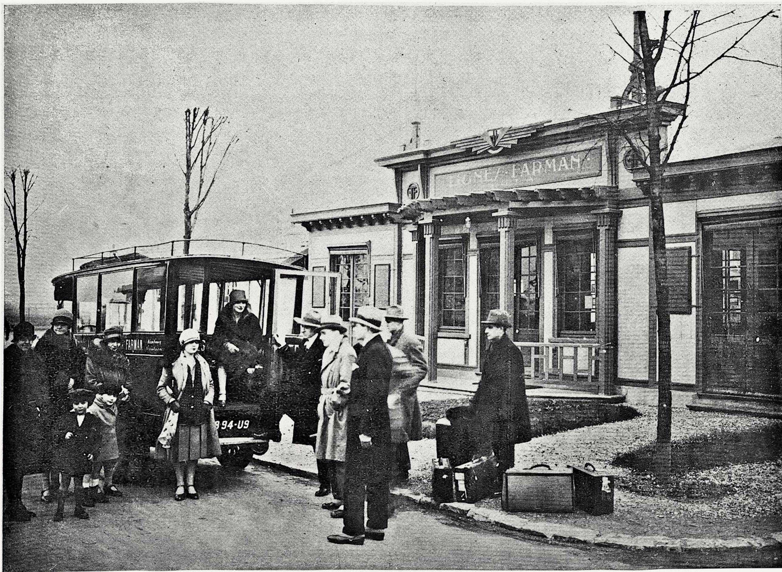
АВИАЦІОННЫЙ ВОКЗАЛЬ ВЪ ПАРИЖѢ.

Между Парижемъ и Москвой установлена воздушная линія (съ пересадкою въ Берлинѣ). Наша фотографія изображаетъ авіаціонный вокзалъ въ Парижѣ, (Линія Фармана) въ моментъ прибытія пассажировъ.