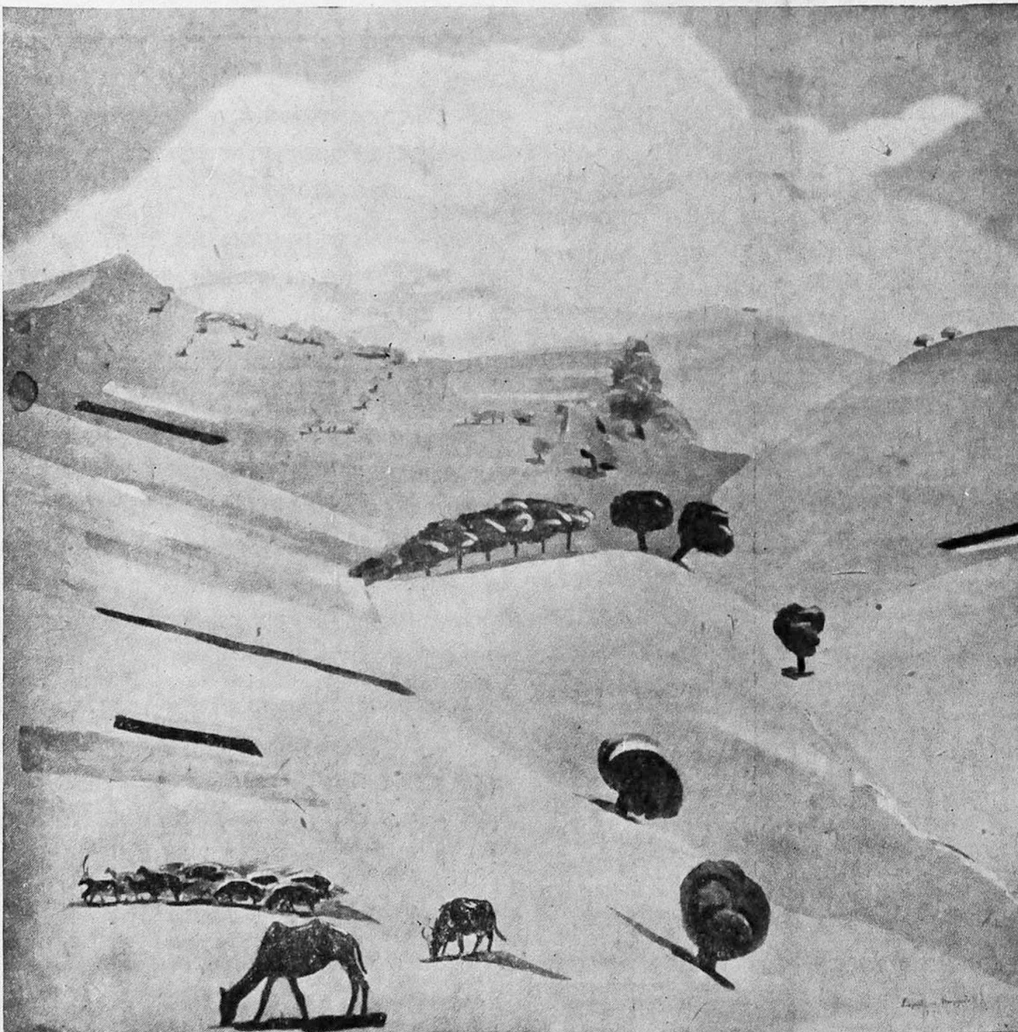
М. Сарьянъ: Полдень въ горахъ.

М. Сарьянъ тоже вѣрный своему обычаю, развернулъ цѣлую панораму своего Востока — нашего Кавказа. «Горы Котаика», «Дворъ въ Эривани», «Полдень», «Весна», «Армянская деревушка», «На окраинѣ Эривани» — всѣ эти пейзажи, такъ же, какъ и его натюр-морты, и какъ и его женскій