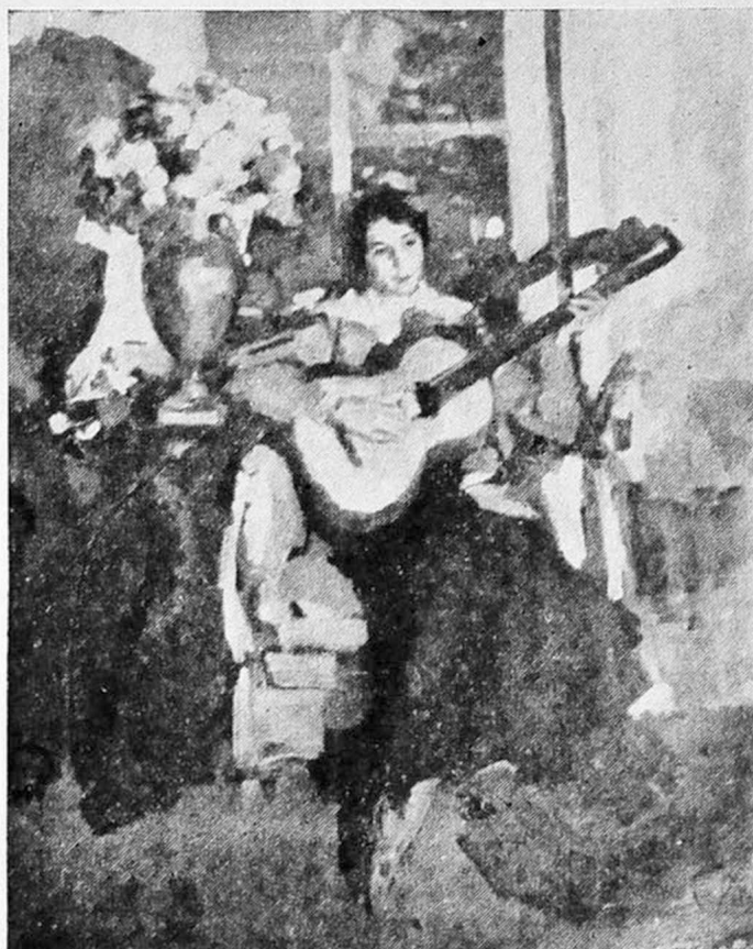
К. Коровинъ: Женскій портретъ.

Открытие этой замѣчательной выставки русскаго искусства въ Парижѣ почти совпало съ горестной вѣстью о выбитіи изъ строя русскихъ художниковъ Б. Кустодіева . Память о немъ — тоже одномъ изъ дѣятельныхъ участниковъ «Міра Искусства» въ прошломъ — достойно отмѣчена теперь въ Парижѣ: на этой парижской выставкѣ «міроискусниковъ» на чужбинѣ его творчество представлено его боль-