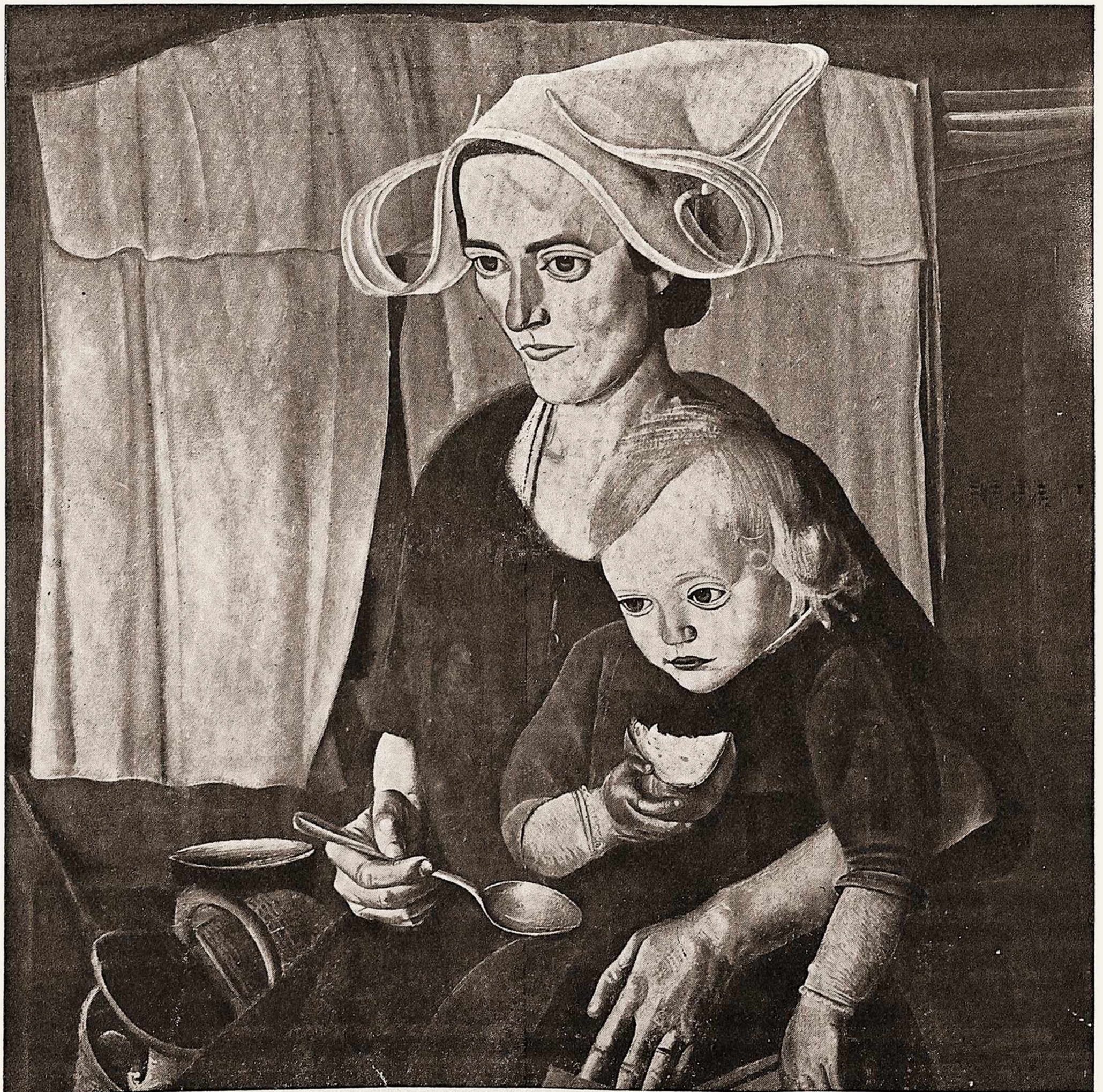
Борисъ Григорьевъ : « НИЩЕТА ».

Къ открытію въ Парижъ выставки „Міръ Искусства“.