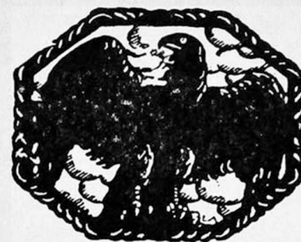
Е. Лансере: Марка каталога «Міръ Искусства».