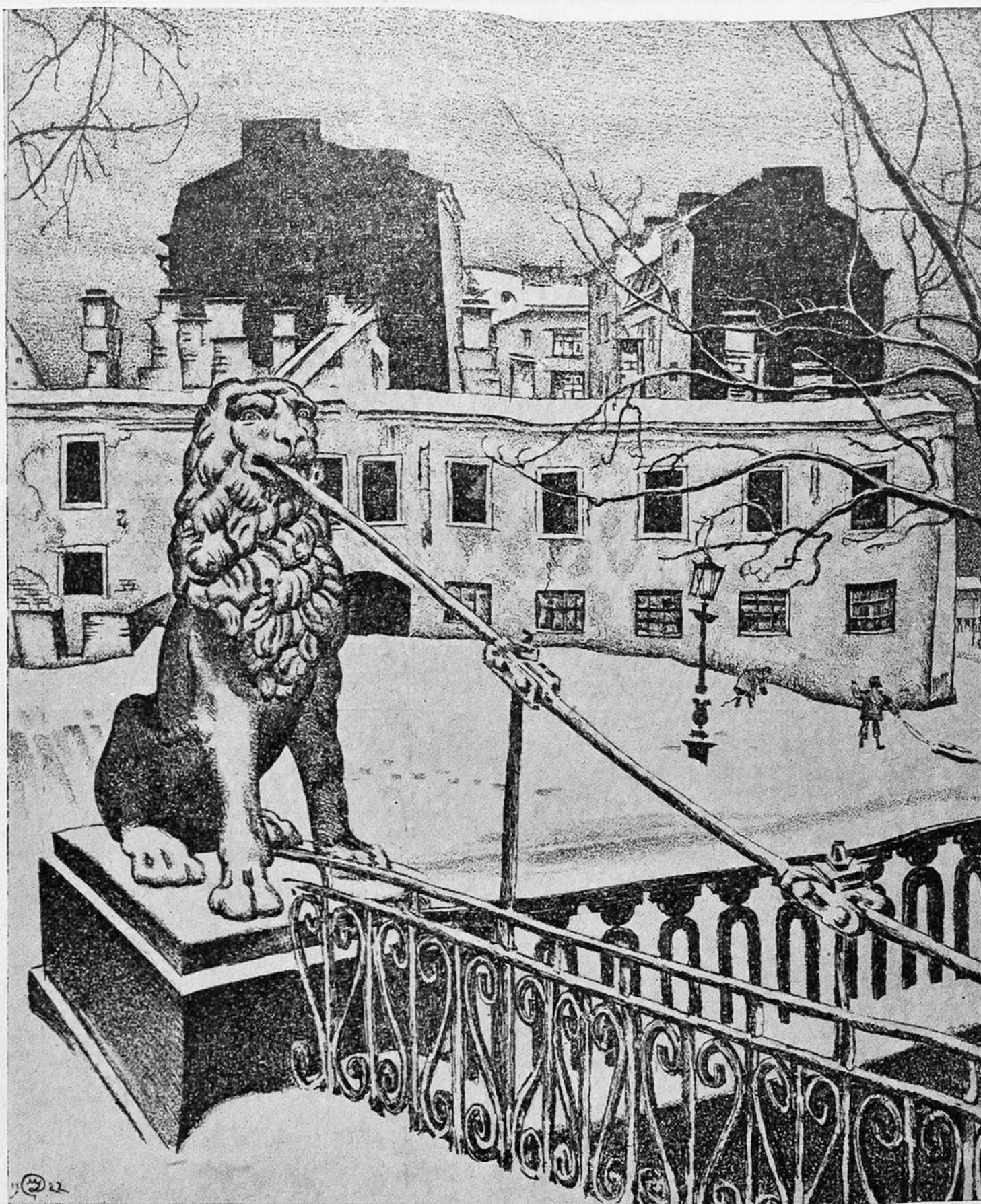
М. Добужинскій: Львиный мостъ. (Петербургъ, 1922 г.).

Изысканное тонкое, острое въ своей выразительности виртуозное мастерство А. Яковлева представлено его большими серьезными работами (на этотъ разъ не «азійскаго» и не «африканскаго» міра!): «Продавцемъ куколъ», «Въ кафе Ротондѣ», двумя большими женскими портретами, во весь ростъ, двумя большими пейзажами, итальянскимъ натюр-мортомъ, и сангвиной голаго тѣла. В. Шухаевъ показываетъ два женскихъ портрета (одинъ изъ нихъ—дѣвушка въ голубомъ—особенно прекрасенъ), замѣчательный портретъ француза Вожеля, финскіе пейзажи, натюр-мортъ, картину «ню».