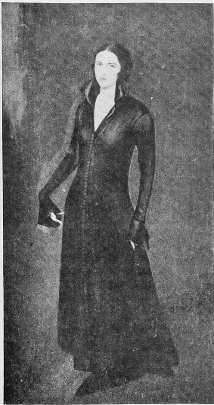
А. Яковлевъ: Портретъ.

рисунками Е. Лансере, съ гравюрами на деревъ А. Остроумовой, съ «Екатерингофскимъ дворцомъ» А. Н. Бенуа, съ «Новой Голландіей» О. Бразя). Теперь въ Парижѣ на выставкѣ «Міра Искусства» этотъ культъ стараго Петербурга представленъ гравюрами все той-же А. Остроумовой и графикой М. Добужинскаго.