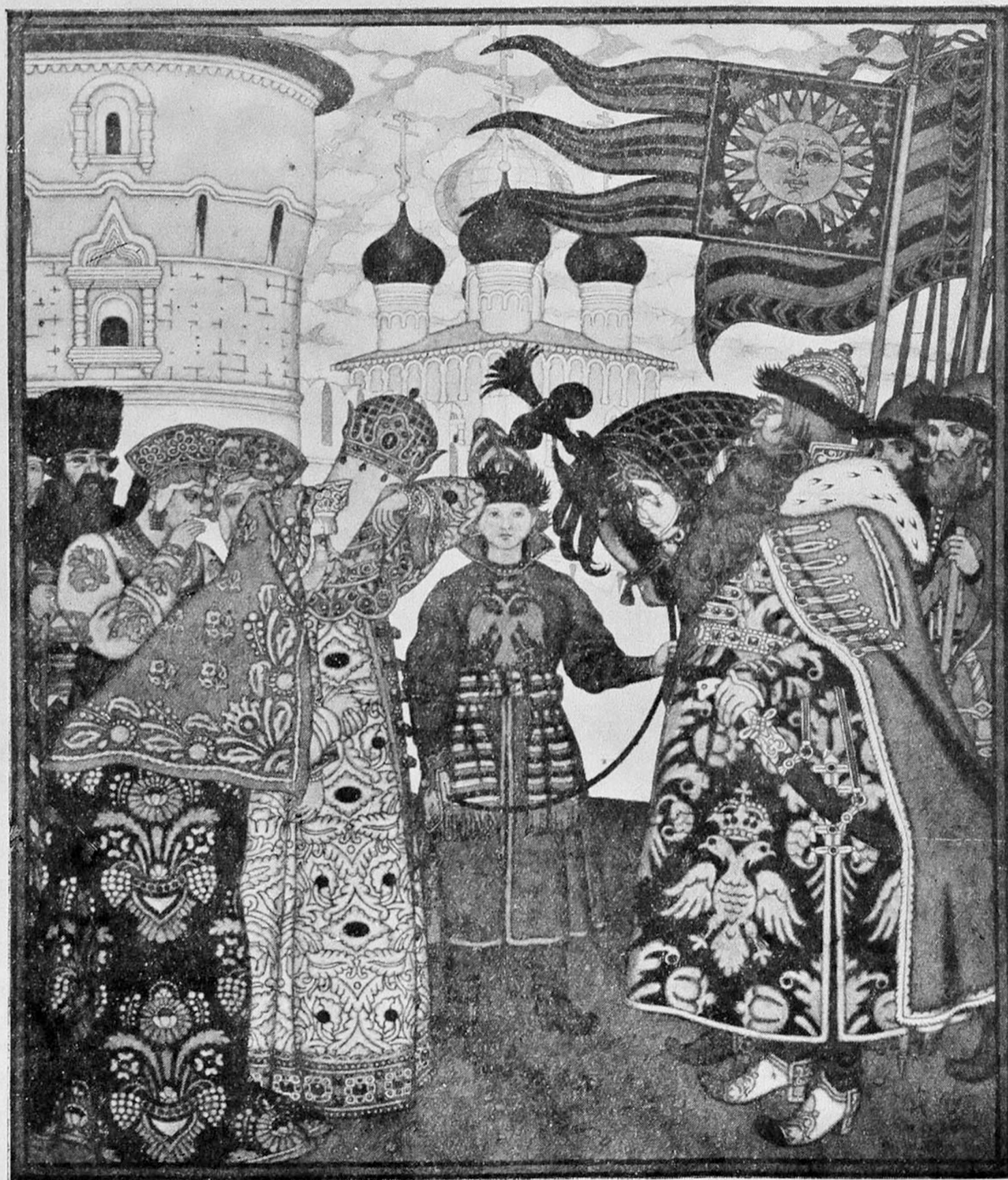
И. Билибинъ : Сказка о царѣ Салтанѣ.

«Миръ-искусники» съ самаго начала стали опредѣленно выраженными западниками, неизмѣнно отдававшими дань поклоненія самому «западническому», что есть въ Россіи, — Петербургу. Такъ еще въ 1902 году одинъ изъ номеровъ «Мира Искусства» былъ посвященъ полностью этой темѣ о Санкт-Петербургѣ (съ репродукціями архитектурныхъ памятниковъ Петербурга, съ заставнымъ листомъ и