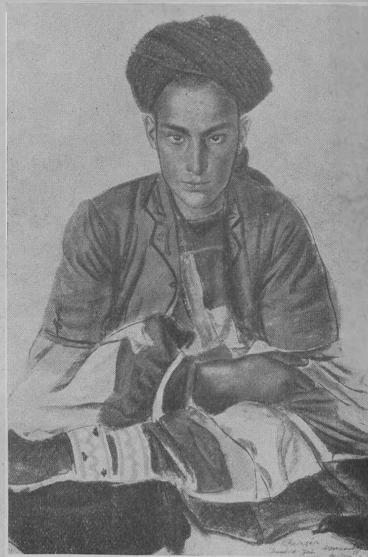
Молодой афганецъ изъ племени Даулетъ - Занъ

работать для живописи систему работы, основанную исключительно на памяти.