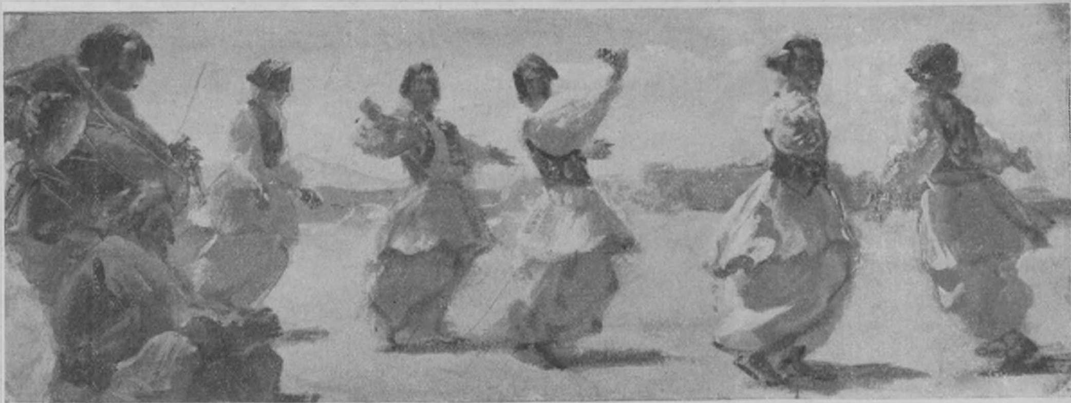
Танцоры изъ деревни Моккоръ (Афганистанъ)