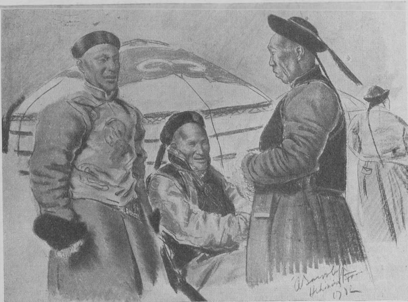
Монголы у юрты

ромъ у предпочелъ бы его изобразить. Я отвѣтилъ, что по моему ему очень идетъ его великолѣпный національный китайскій костюмъ изъ чернаго шелка съ китайской шапочкой, увѣнчанной каралловымъ шарикомъ. Онъ удалился и вышелъ нѣкоторое время спустя... съ котелкомъ въ рукахъ и одѣтый въ пиджакъ такъ называемый «сунъ - ять - сенъ», созданный покойнымъ знаменитымъ государственнымъ дѣятелемъ, и представляющій собой помѣсь европейскаго, китайскаго, военнаго и штатскаго костюмовъ. Его тщеславію такъ льстило пойти наперекоръ желанію европейца.