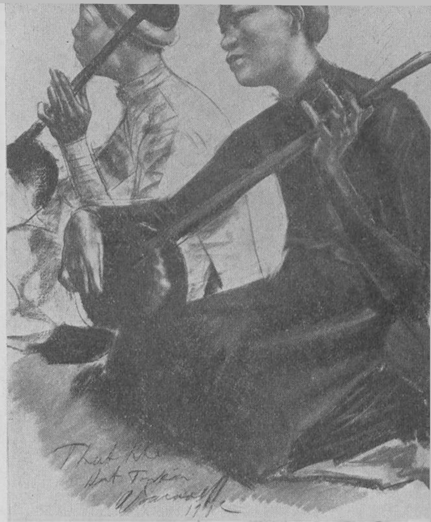
Музыкантъ изъ Верхняго Тонкина

Г. Ченгъ, министръ иностранныхъ дѣлъ Синкианга, освѣдомился, съ самыми любезными комплиментами, о костюмѣ, въ кото-