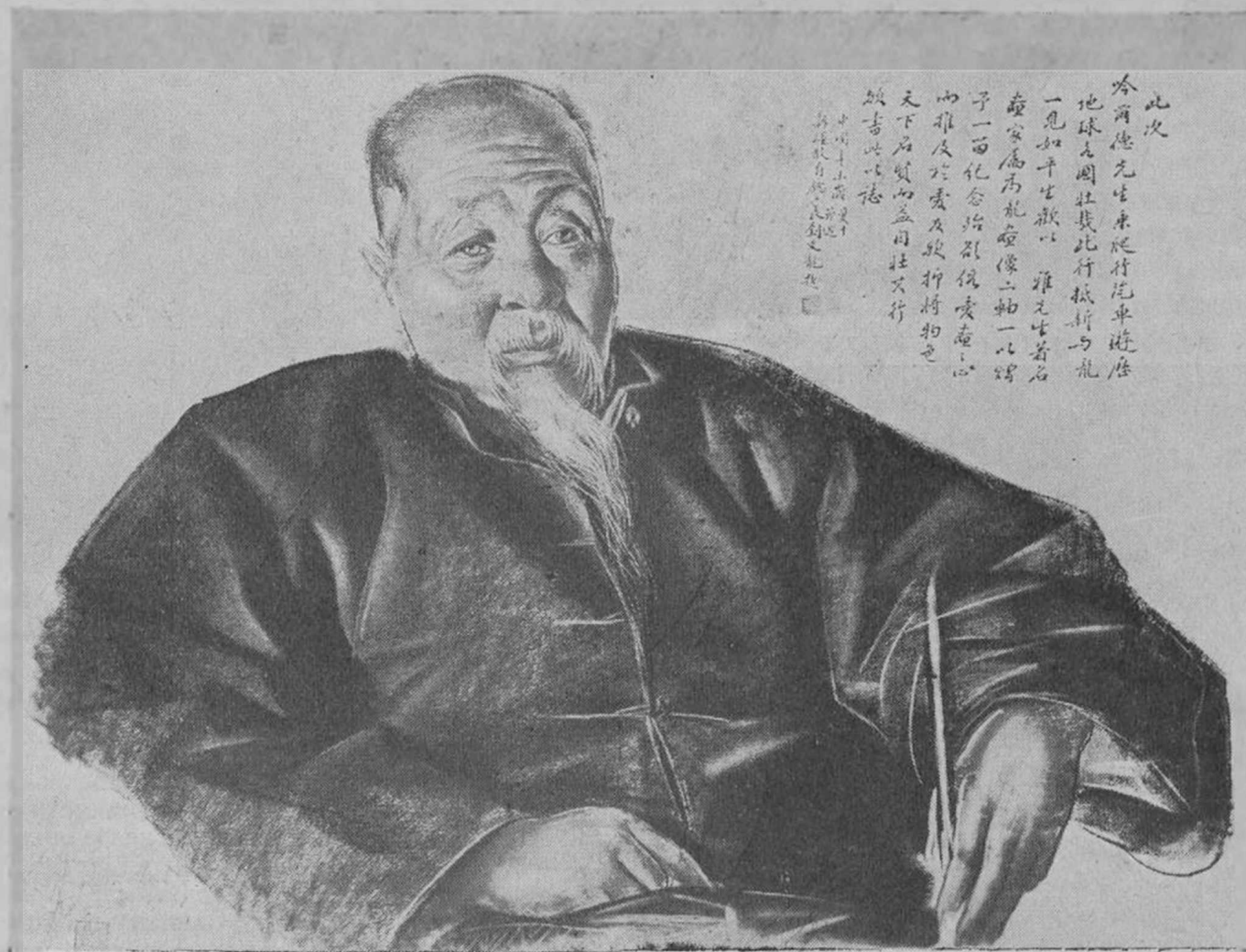
Министръ народнаго просвѣщенія Синкианга г. Вью.

Постоянныя передвиженія, невозможность останавливать экспедицію въ интересовавшихъ меня мѣстахъ, — заставило меня вы-