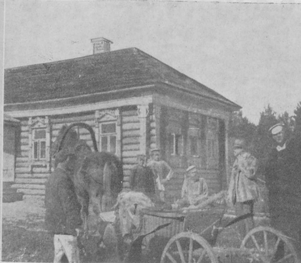
ОТЪЗДЪ НА ОХОТУ И РЫБНУЮ ЛОВЛЮ ПОДЪ МОСКВОЮ.