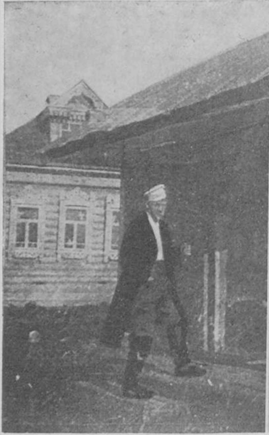
Ф. И. ШАЛЯПИНЪ.