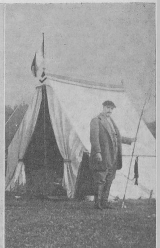
К. А. КОРОВИНЪ.