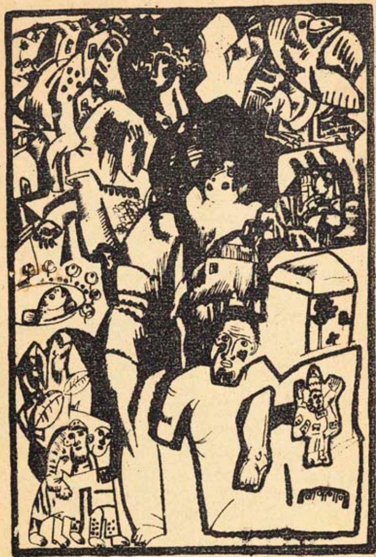
Тило - литографія Мевскій 136