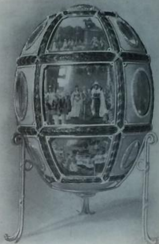
Вся яйца—работы К. Фаберже.

На обоихъ концахъ—плоскіе специально граненые брилантаы, подъ которыми помѣщены: вензель Государыни Императрицы— „А. Ѳ.“ съ короной, и годъ „1909“.