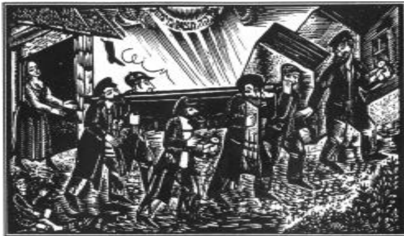
Рис. 5. Фрадкин М.З. Похороны. 1924.