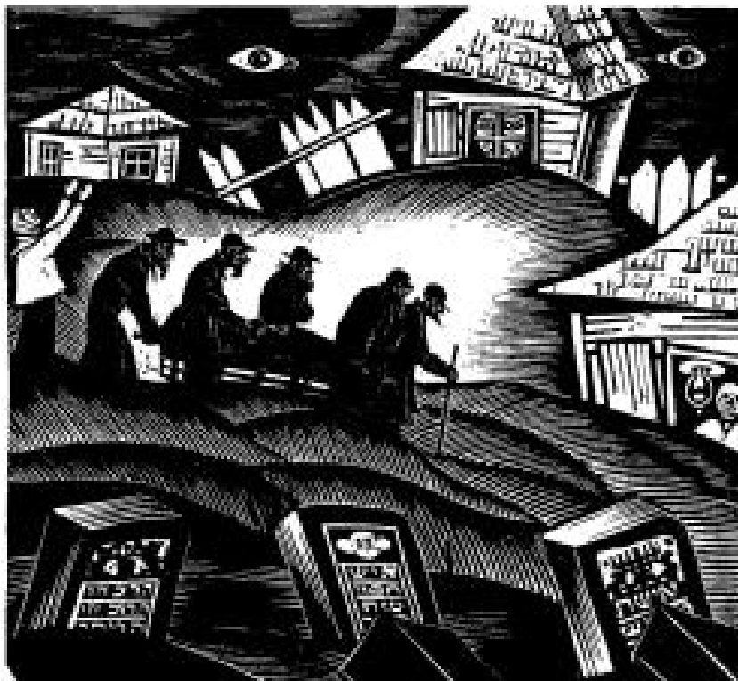
Рис. 1. Юдовин С.Б. Похорони. 1926. Ксилографія.