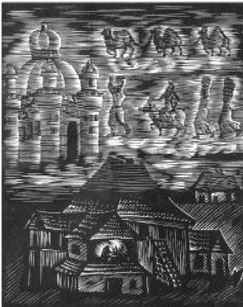
Рис. 4. Фрадкин М.З. Сны. Иллюстрация к книге Менделе Мойхер-Сфорима «Волибное кольцо». 1935. Ксилография. 10,8 x 8,7; л. 21,5 x 14.