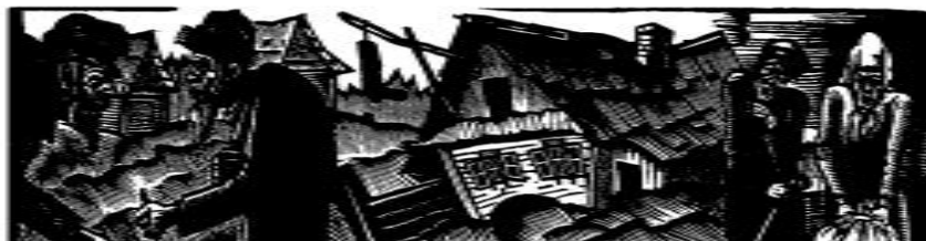
Рис. 2. Юдовин С.Б. Заставка. 1927. Ксилографія.