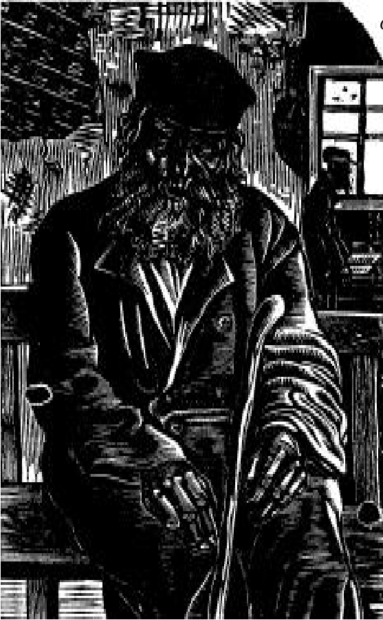
Рис. 3. Юдовин С.Б. Старик с палкой. 1926. Ксилография.

домиками, кривыми улочками, висящим бельем и интерьерами лавочек и ремесленных мастерских. Пространство фона часто изображается в таком ракурсе или масштабе, который играет подавляющую роль по отношению к фигуре. Определенная символика прослеживается также в использовании антуража – керосиновой лампы, часов – символа времени, мизрахов на стене, значимых текстов, помогающих раскрытию образов. Сюжеты и фигуры местечковых обывателей часто «зажаты» в тесные рамки, наличие которых наводит на мысль об отсутствии свободы, безысходности и убогости их существования, что в целом соответствовало действительности. Вместе с тем, в каждом листе чувствуется тонкая поэтика и любовь автора к изображаемому быту, наполненность особым, мистическим смыслом. Этот смысл заключался в понятии еврейского «галута» 18 – изгнании и странствовании в чужих землях, наполненных многовековым каждодневным