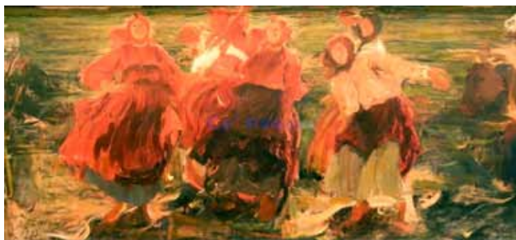
Ф.А. Малявин. Смах. 1899. Холст, масло. 194x428. Международная галерея современного искусства. Венеция

рики персональной выставки в пользу голодающих Поволжья 6 . Для решения вопроса было привлечено ведомство Луначарского. Нарком просвещения, весьма скептически высказавшийся о доходности данного проекта, в целом все-таки поддержал идею о передвижной выставке. В дело, однако, снова вмешался представитель Главмузея Грабарь, предоставивший резко отрицательный отзыв о выставочном потенциале работ Малявина, невысоко оценив место, которую тот занимал в советской художественной жизни. Затянувшийся конфликт между Грабарем и Луначарским разрешился в пользу последнего. Осенью 1922 года, заручившись финансовым обеспечением из резервных средств Республики, Малявин выехал за границу, сначала в Берлин, а затем во Францию, где его семья обрела постоянное место жительства. Вскоре