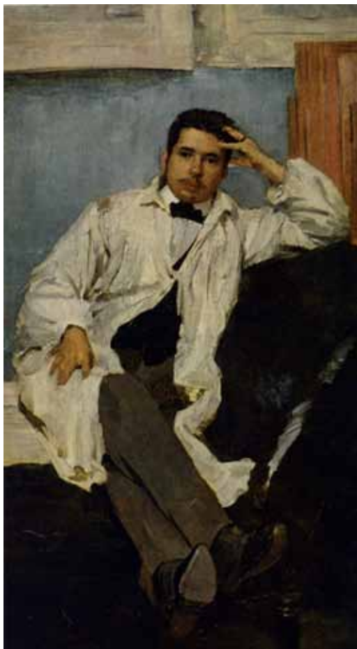
Ф.А. Малявин. Портрет Константина Сомова. 1895. Холст, масло. 169x92,5. Государственный Русский музей. Санкт-Петербург

В январе 1922 года Малявин обратился к Ленину с ходатайством о выдаче разрешения на выезд из страны для устройства в крупных городах Западной Европы и Аме-