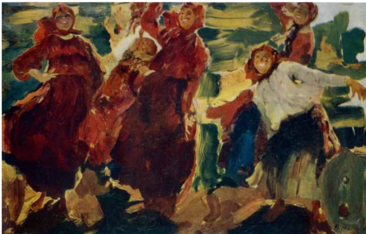
Ф.А. Малявин. Эскиз к картине Смах. 1899. Холст, масло. 95x60. Место нахождения неизвестно (из бывшего собрания Л.М. Бенатова. Париж)