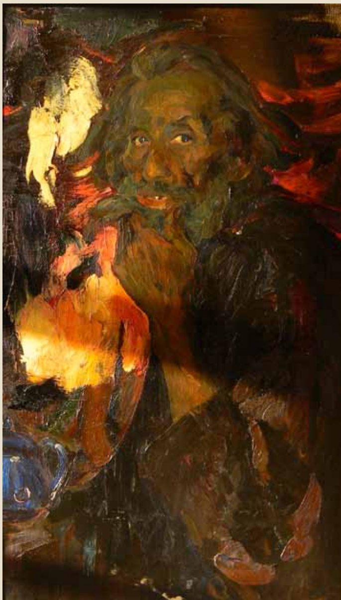
Ф.А. Малявин. Старик у очага. 1915. Холст, масло. 142,5x90. Рязанский государственный областной художественный музей имени П.И. Пожалостина

(Далее в тексте приводится краткий рассказ об эпизоде, происшедшем в первые дни революции, когда Малявин жил в Рязанской губернии в имении своей жены и к дому пришли крестьяне для того, чтобы захватить усадьбу. Более подробно Иванов-Барков описал этот эпизод в черновом автографе, отрывок из которого приводится далее. – М.С.)