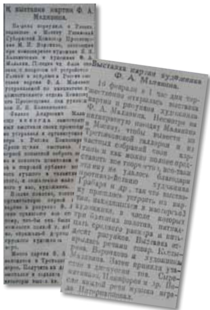
Информация о персональной выставке Ф.А. Малявина в Рязани. «Известия» (Рязань). 6.09.1918, 26.02.1919

а также отредактированный машинописный вариант текста (на 5 листах) воспоминаний о Малявине, относящихся к 1920 году 3 .