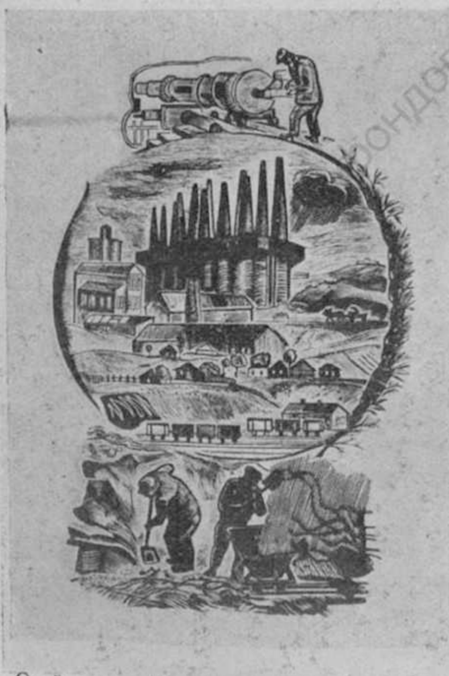
Райская М. Фронтиспис к книге Гладкова «Цемент»