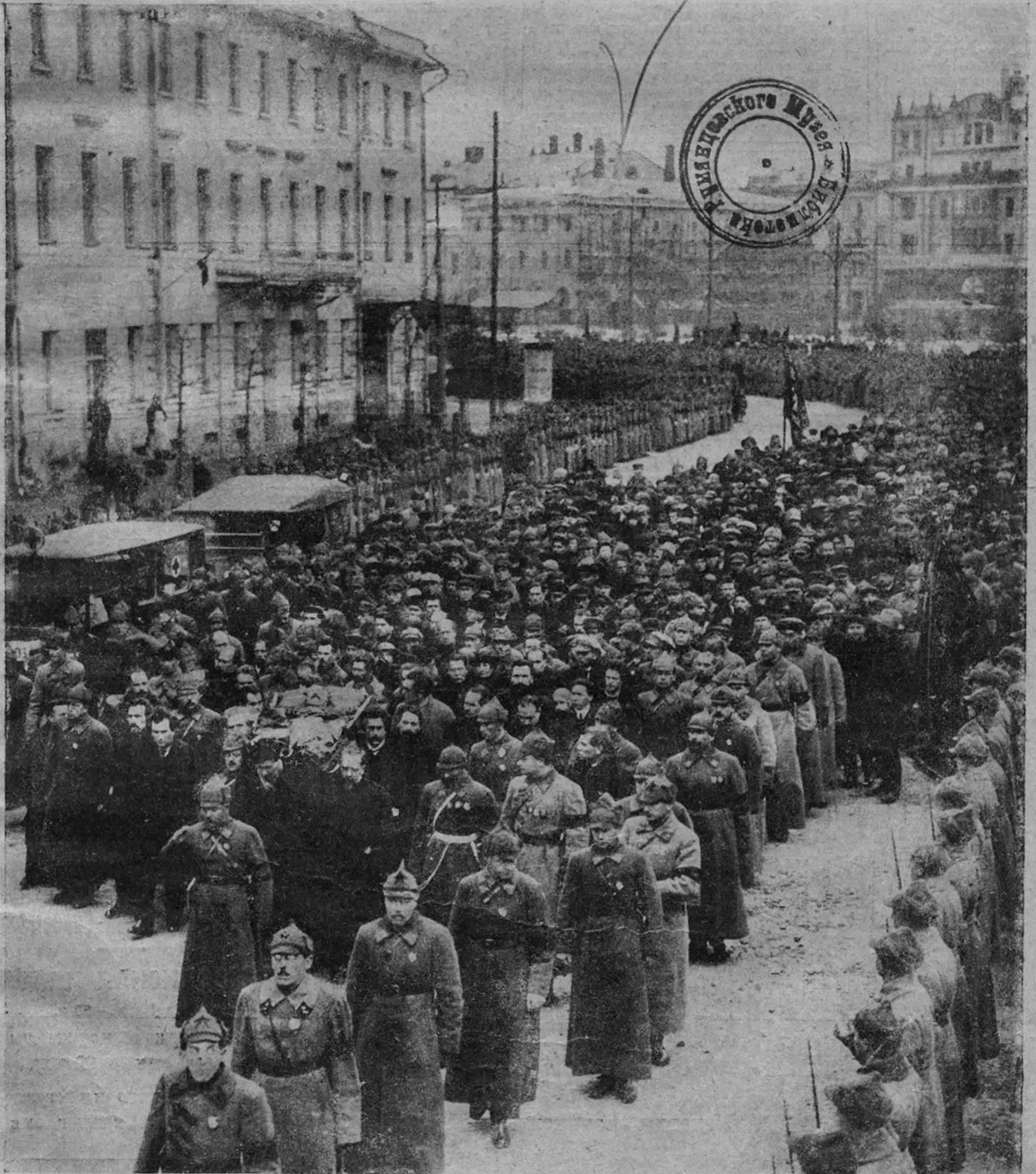
Похороны тов. М. ФРУНЗЕ 3-го ноября 1925 г.