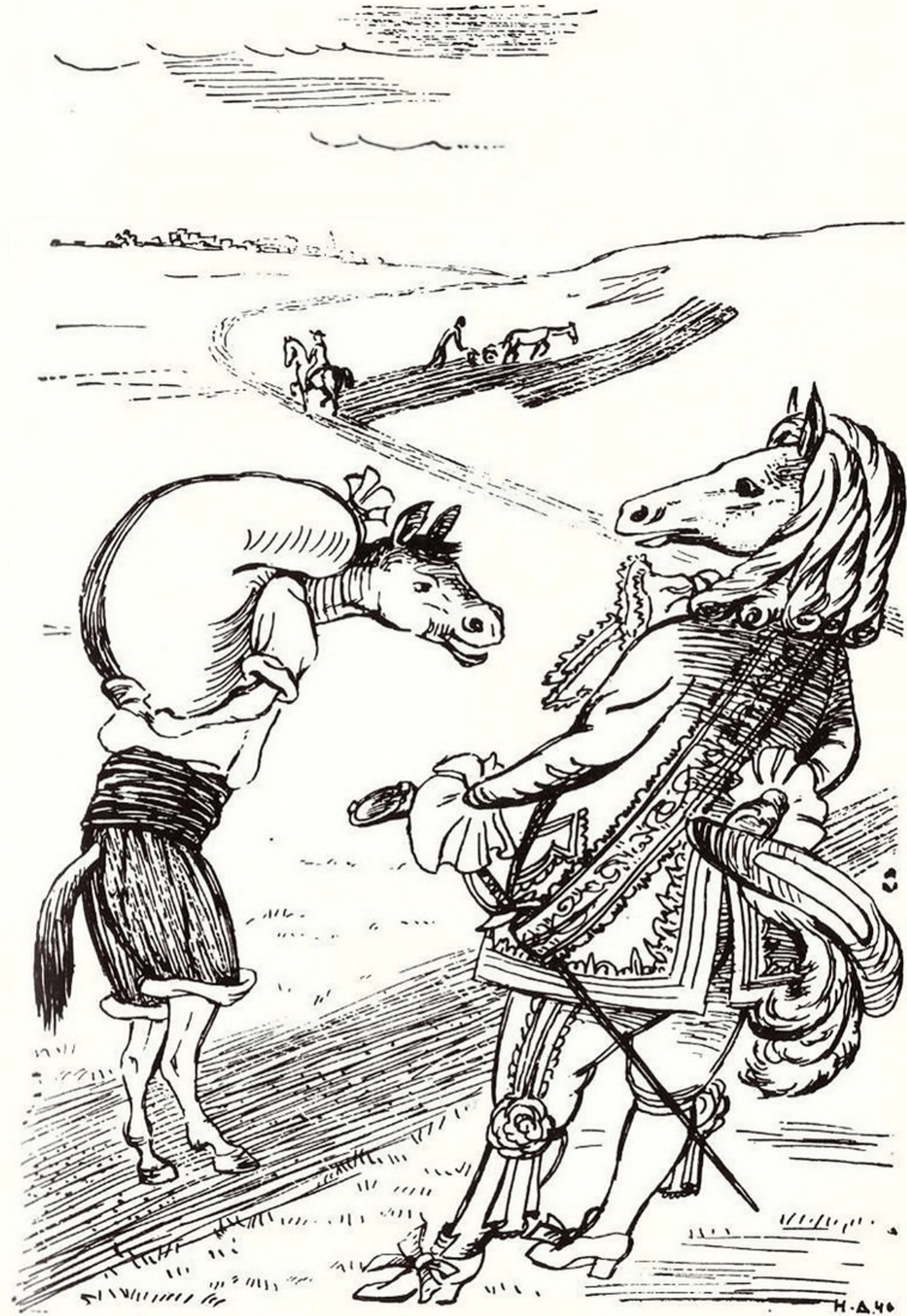
Натан Альтман. Иллюстрация к басне Геллерта «Конь верховый». Басни. М.— Л.: Детиздат, 1941