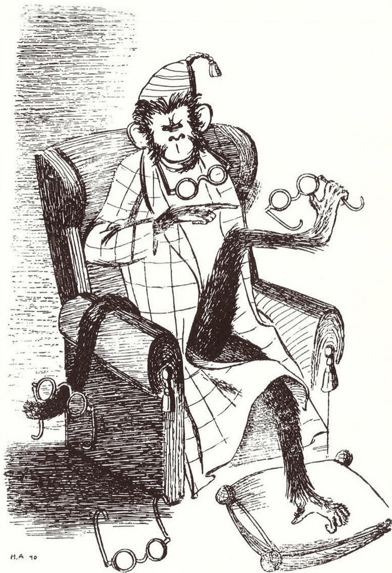
Натан Альтман. Иллюстрация к басне И.А.Крылова «Мартышка и Очки». Басни. М.— Л.: Детиздат, 1941