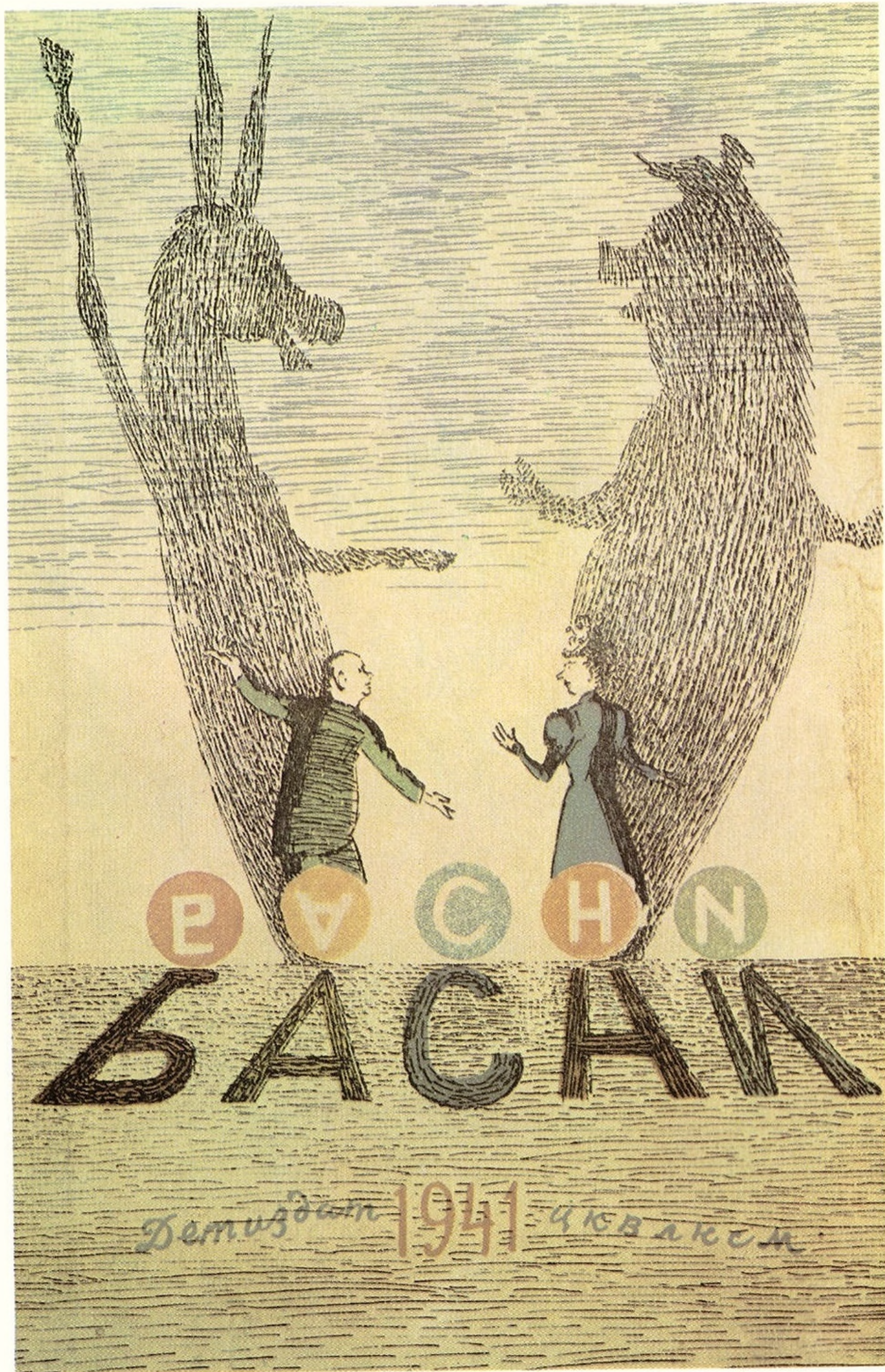
Натан Альтман. Обложка. Басни (составил В.Л. Нейштадт). М.— Л.: Детиздат, 1941