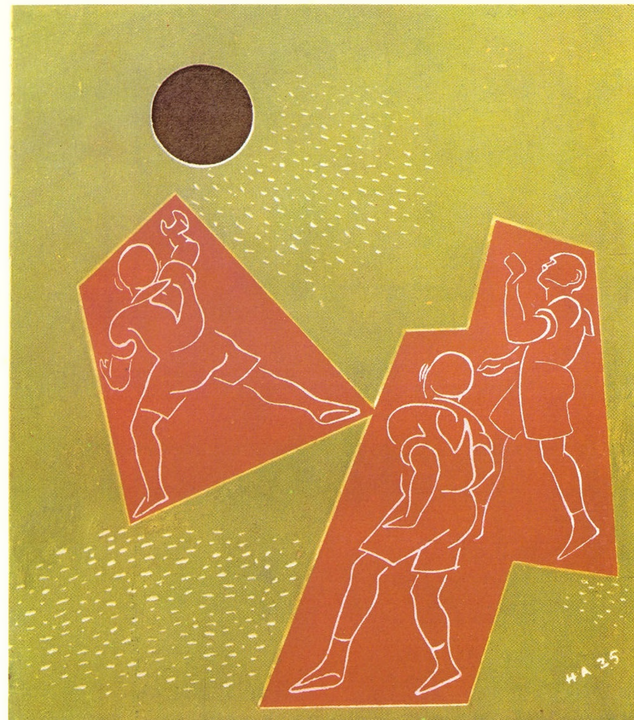
Натан Альтман. Иллюстрация. Н.Асеев. Красношейка. Л.: ГИЗ, 1926