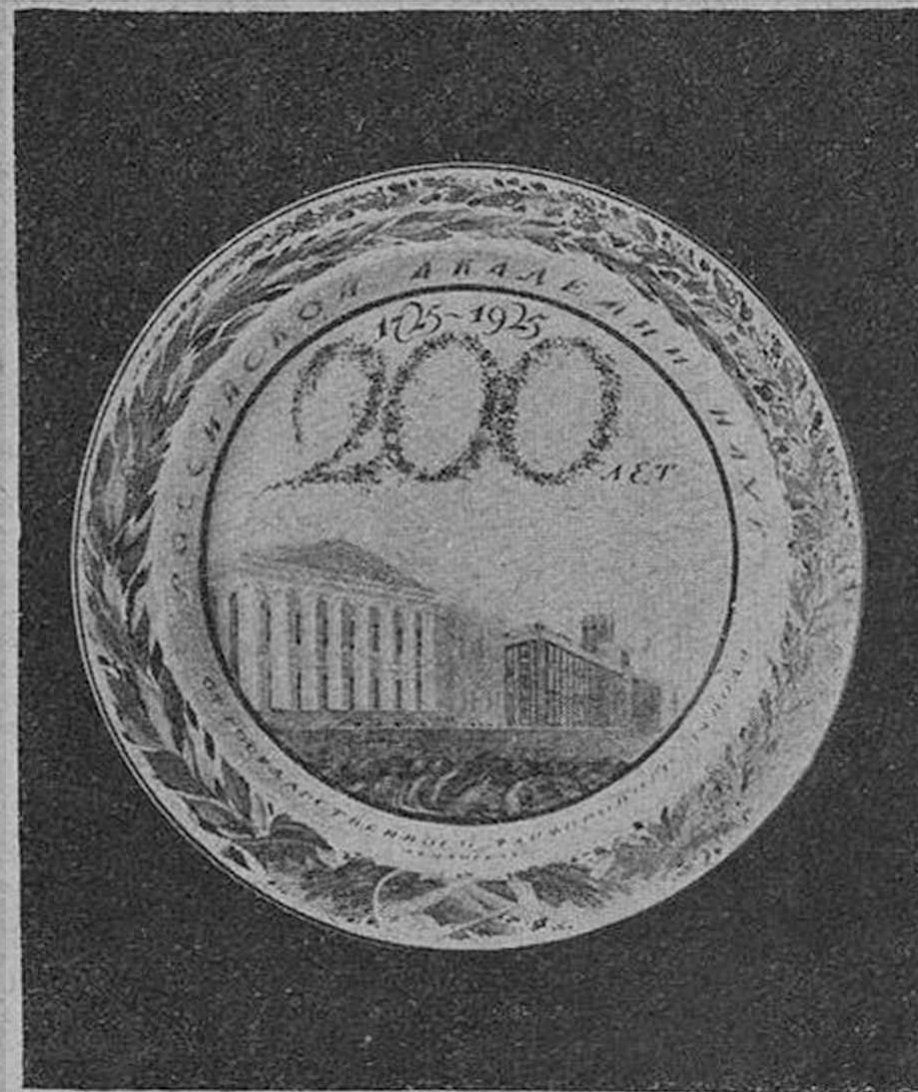
6. Чехонин.—Блюдо к 200-летию Академии Наук

В настоящее время мы пытаемся вовлечь широкие слои художников в работу фарфорового завода. Молодым художникам предоставляется возможность изучить живопись по фарфору, после чего мы делаем отбор наиболее успевающих. Ныне на эту работу охотно идут окончившие Академию Художеств чуть ли не впервые за все