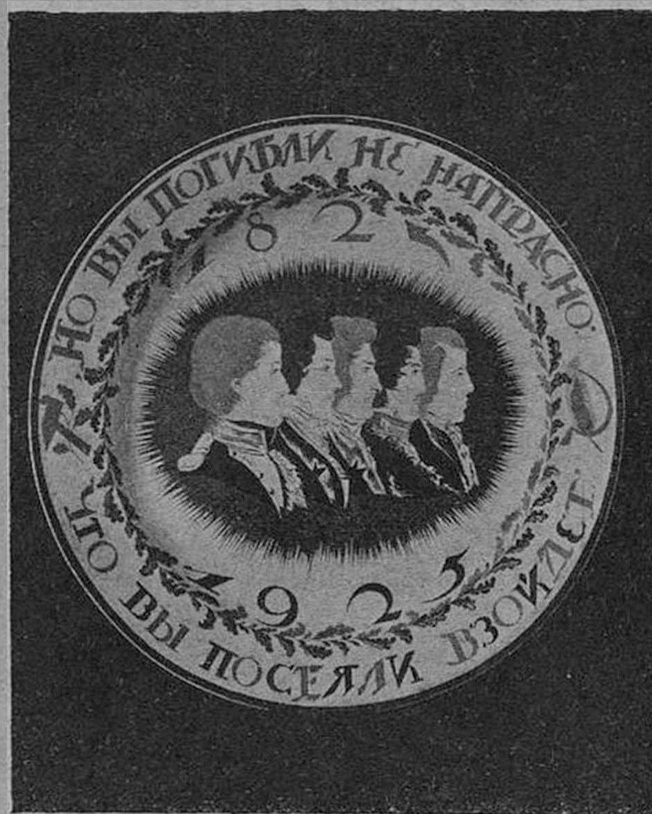
3. Кобылецкая.—Блюдо «Декабристы»

Намечается также применение фотолитографии в фарфоровом производстве. Словом, все книжные способы репродукции можно и желательно применить к фарфору, с соответствующим приспособлением и улучшением.