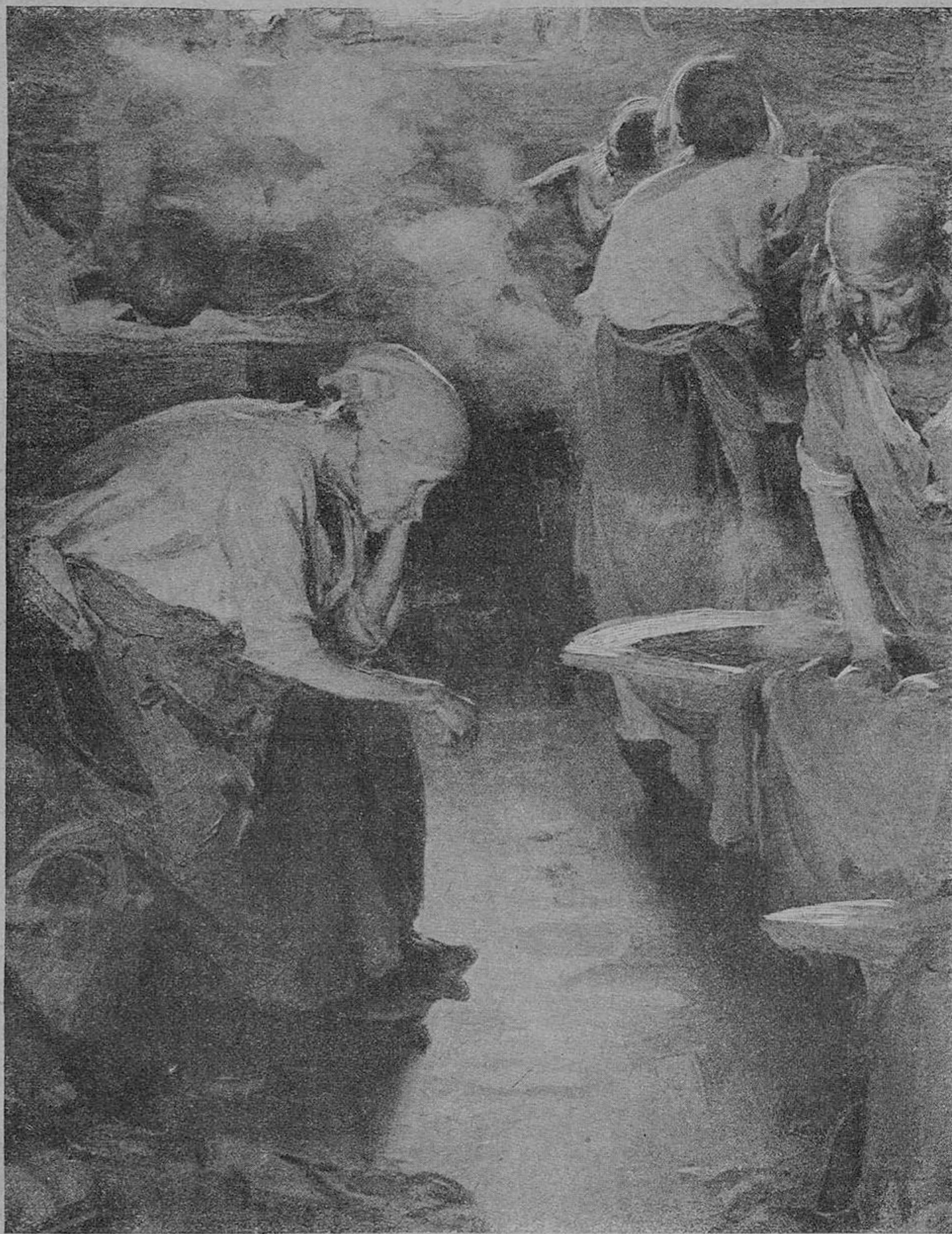
А. Е. Архипов

красною живописью и рисунком. Подобно Венецианову, Архипов ушел от академической выучки в природу, чтобы в ней почерпнуть решение живописных задач. Часто он подходит к ней, как оптик, разлагая солнечный луч на спектры. Он видит радугу в каждом солнечном пятне. Поэтому он не употребляет черной и других мутных красок, в роде охры, чтобы быть ближе к солнечному блеску, о котором на другом конце Европы хлопотали неоимпрессионисты — Синьяк, Сера и другие.