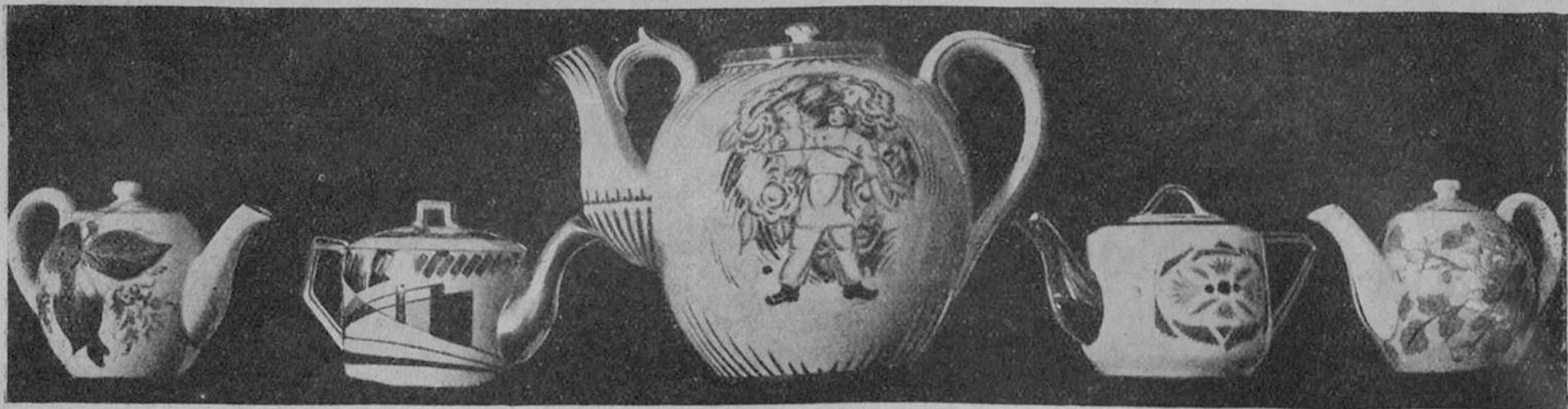
Новая фарфоровая продукция Дулевского завода