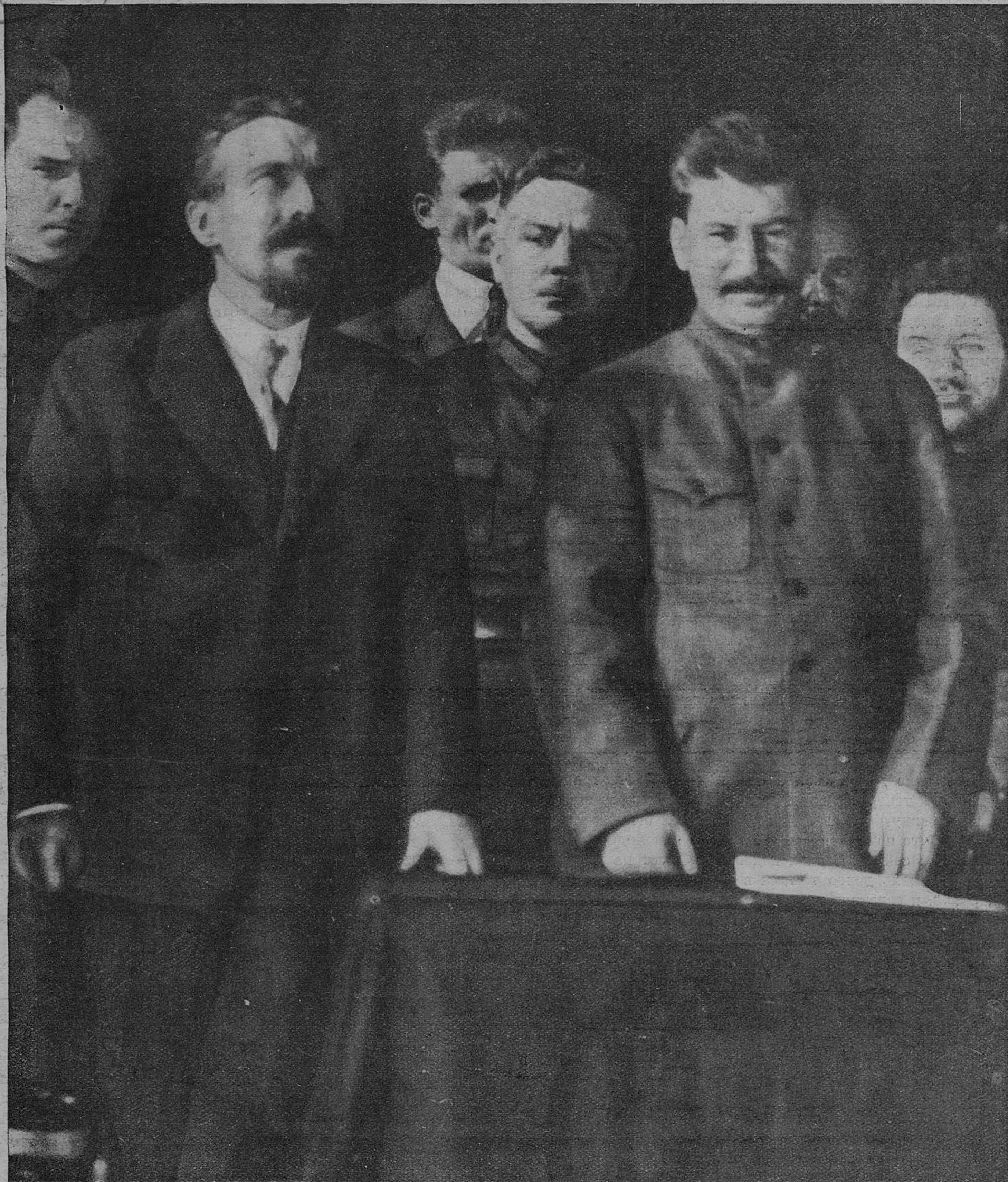
Т.г. Сталин, Р.иков, Ворошилов — члены почетного президиума съезда