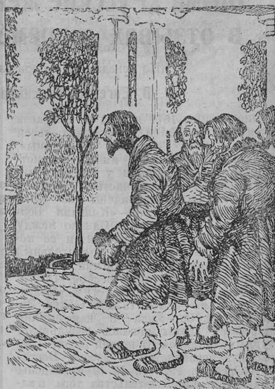
Рис. П. Бучкина к стих. «Размышления у парадного подъезда»

Первыми по времени в нашу эпоху иллюстрациями к Некрасову являются рисунки М. Митрохина, в первом сборнике произведений поэта, серии «Народной библиотеки», лит.-изд. отд. Наркомпроса (1919 г.). Д. Митрохину пришлось иллюстрировать первое революционное массовое издание Некрасова. Но, сравнивая эти иллюстрации с позднейшими «кустодиевскими», мы замечаем, что как самый подход к иллюстрированию, так и технические