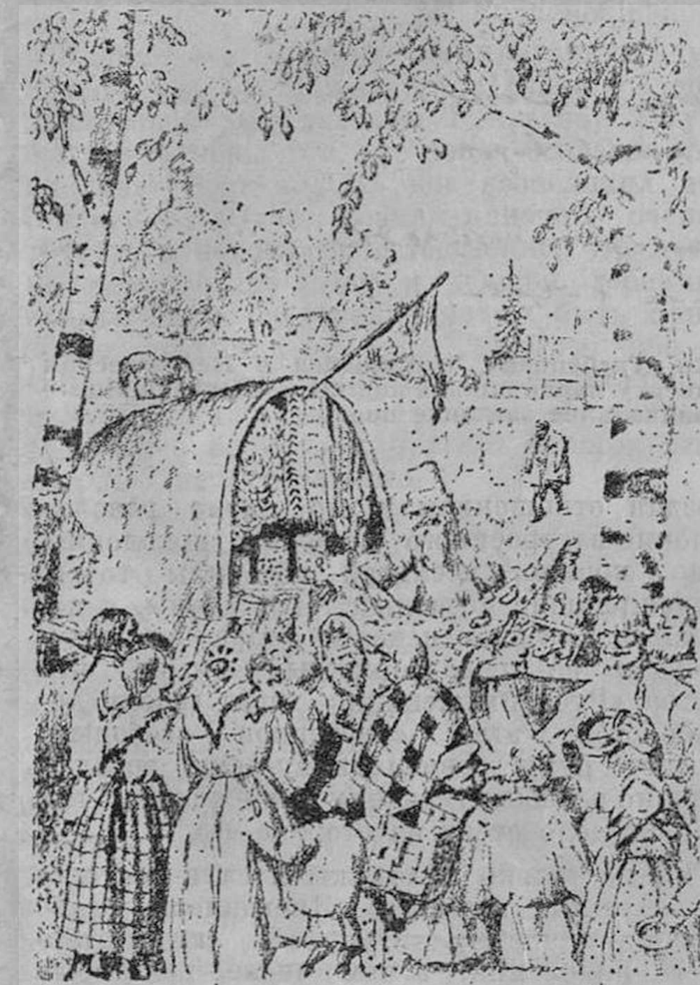
«Дядюшка Яков»— литография Б. Кустодиева

Позднейшими из всех указанных иллюстраций являются рисунки А. Рыбникова, репродуцированные в гравюре И. Павлова, к стих. «Кому на Руси жить хорошо». Манера художника здесь резко отличается из всех виденных нами иллюстраций к поэту. В угловатой, рез-