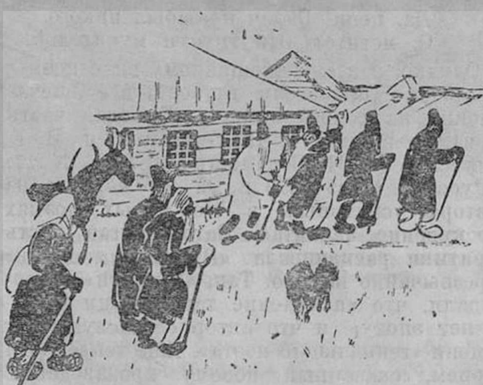
Из иллюстраций А. Рыбникова к поэме «Кому на Руси жить хорошо»

Вот почему мы и встречаем в старых иллюстрациях к Некрасову такую вялость или в лучшем случае стилизованную мелодраматичность.