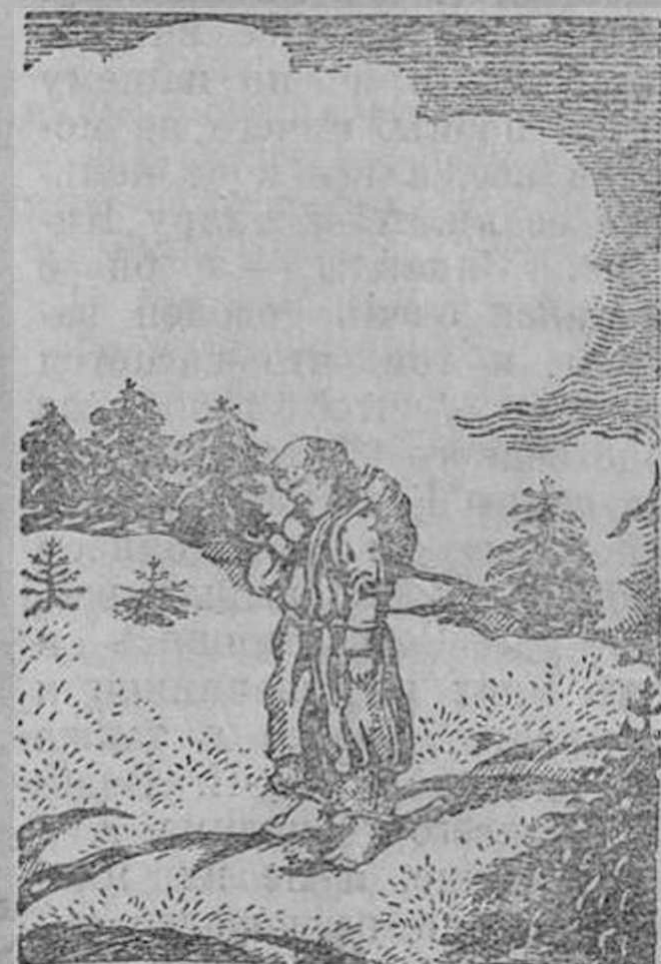
Рис. Д. Митрохина к стих. «Школьник»