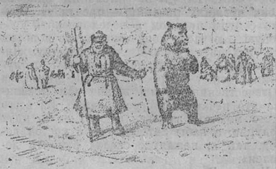
К стих. «Генерал Топтыгин»— литография Б. Кустодиева

приемы художников различны. Кустодиев в изображении быта пользовался литографическим карандашом, Митрохин—пером. Первый изображает детали необыкновенно просто, реально, приближаясь к самому стиху поэта, второй—несколько отклоняется в сторону сти-