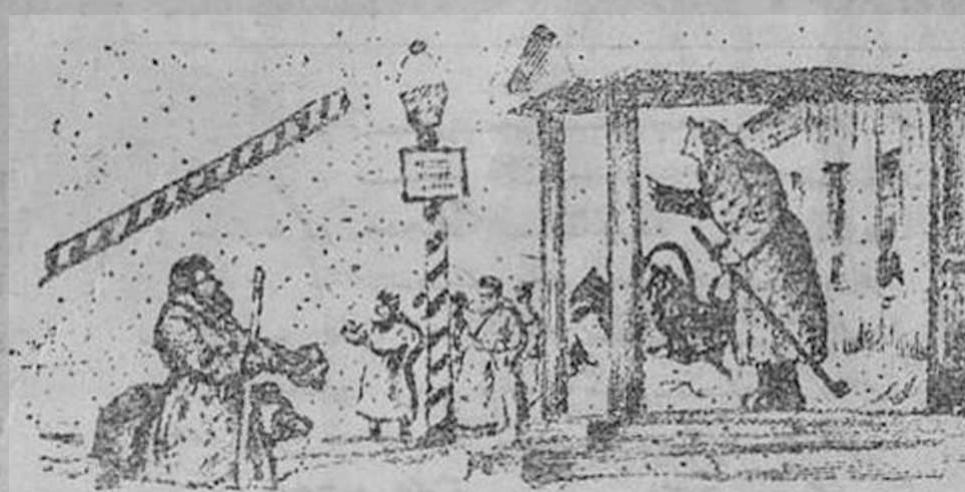
Литогр. Б. Кустодиева — «Генерал Топтыгин»

кой, почти силуэтной, импрессионистической, форме, склоняющейся несколько в сторону паржа, иллюстратор по-своему интерпретировал поэта. В характеристике отдельных персонажей художник достигает исключительной выразительности. Все это дает нам возможность видеть в иллюстрациях Рыбникова некоторое новое разрешение задачи иллюстрирования Некрасова.