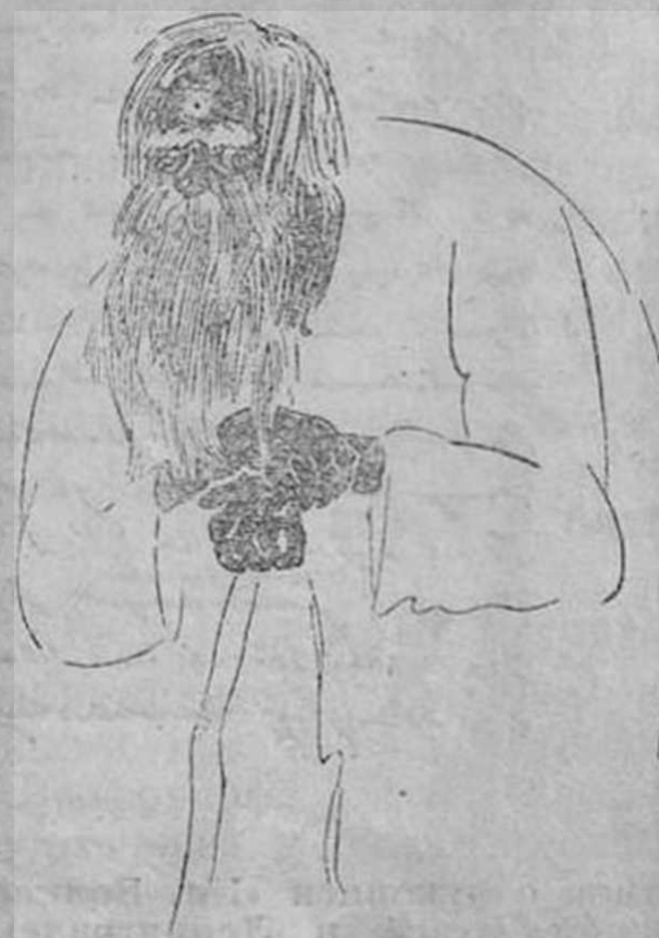
Из иллюстраций к поэме «Кому на Руси жить хорошо»—А. Рыбников

Таков иллюстрированный Некрасов в наши дни. Юбилейная дата еще раз подчеркивает всю нашу близость к поэту, свободные любимые мотивы поэзии которого возмита не одно поколение революционеров и который оставил нам неиссякаемый источник красочных образов и идей. А это служит уже залогом того, что поэзия Некрасова будет водухшевлять и впредь наших лучших иллюстраторов книжной.