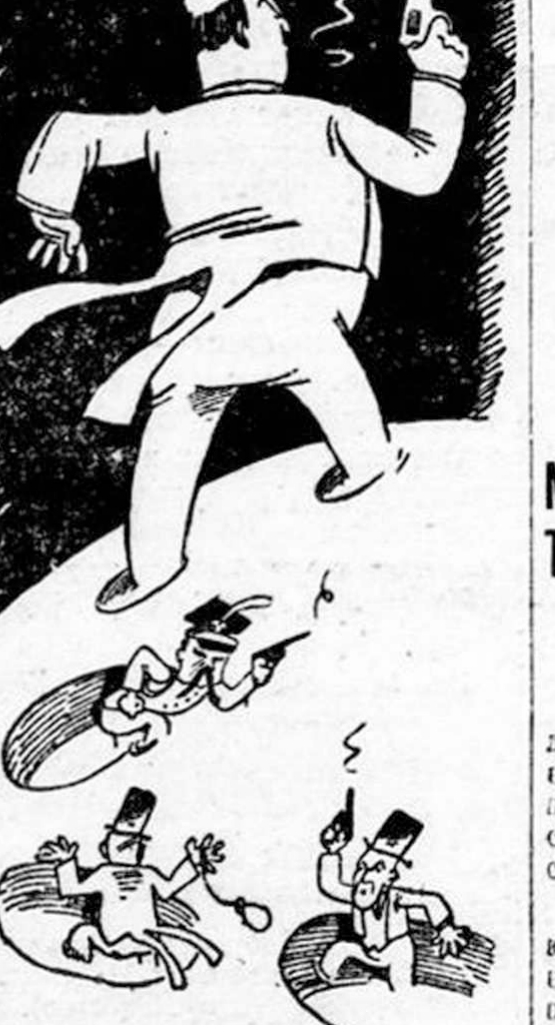
Муссолини и его польские, болгарские, литовские муссолиники...