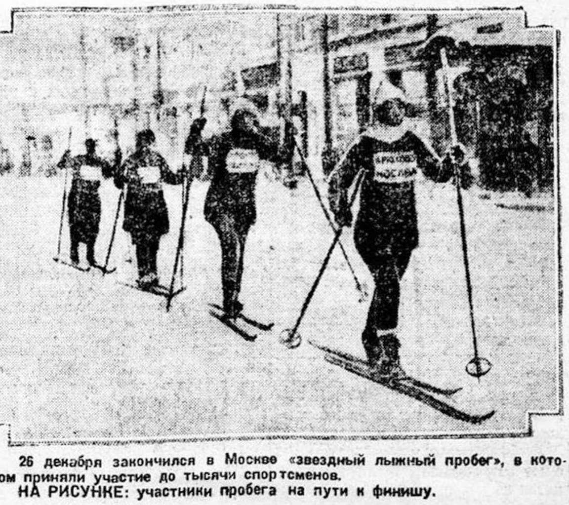
26 декабря закончился в Москве «звездный лыжный пробег», в котором приняли участие до тысячи спортсменов. НА РИСУНKE: участники пробега на пути к финишу.