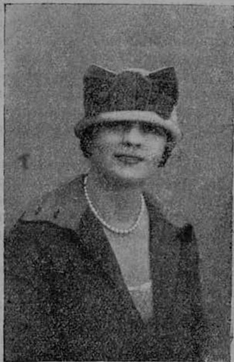
Нар. арт. Респ. Е. В. Гельцер.