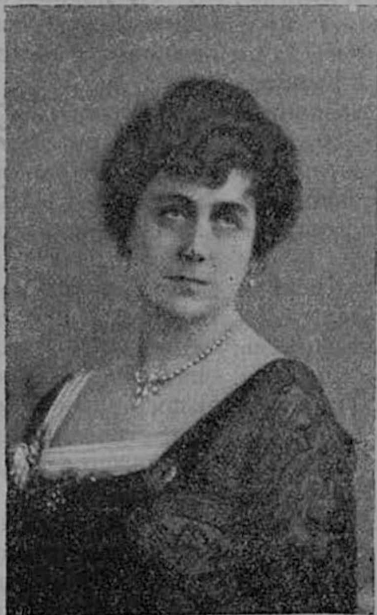
Нар. арт. Респ. А. В. Нежданова.