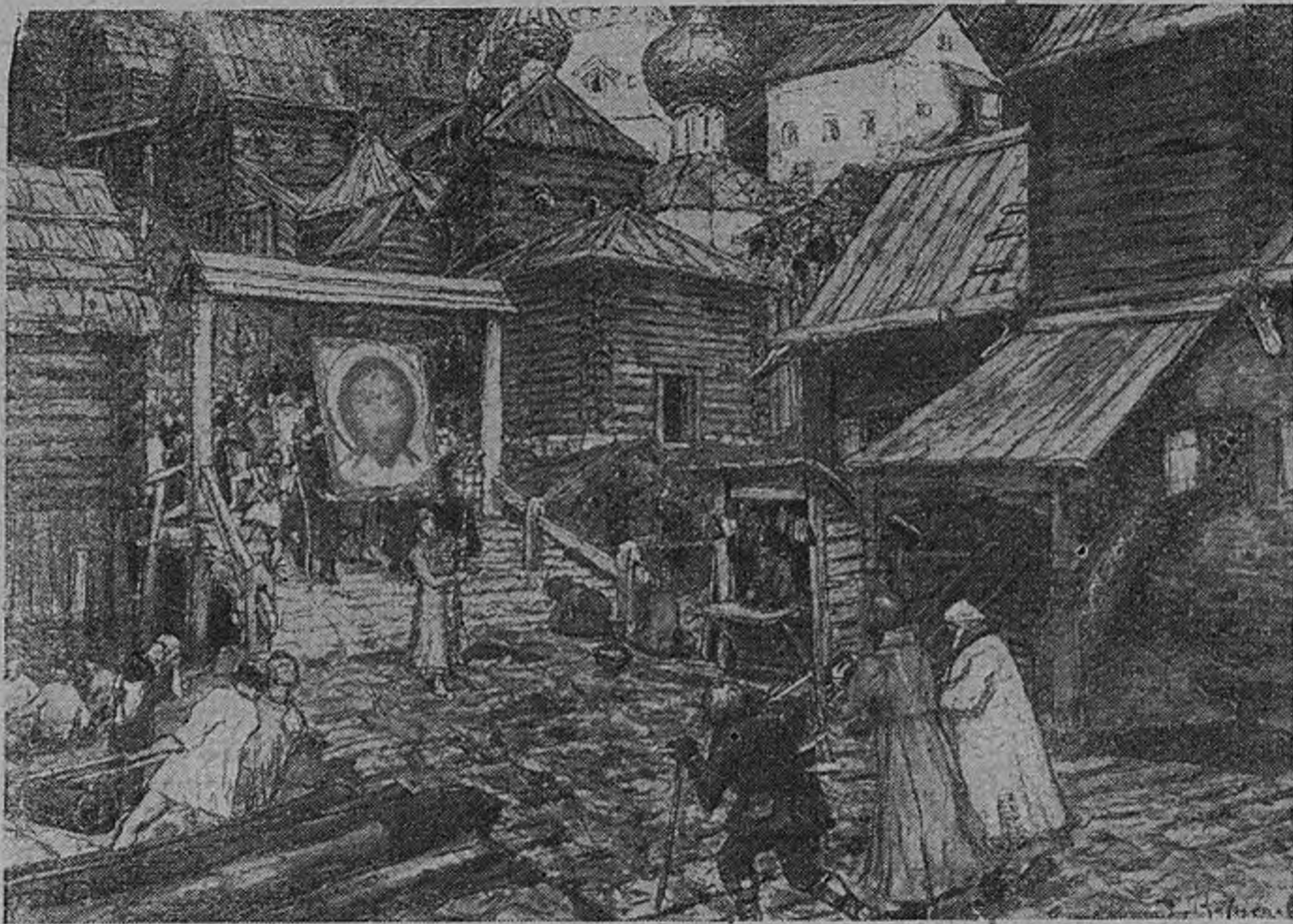
Старая Москва: книжные лавочки на Спасском мосту.