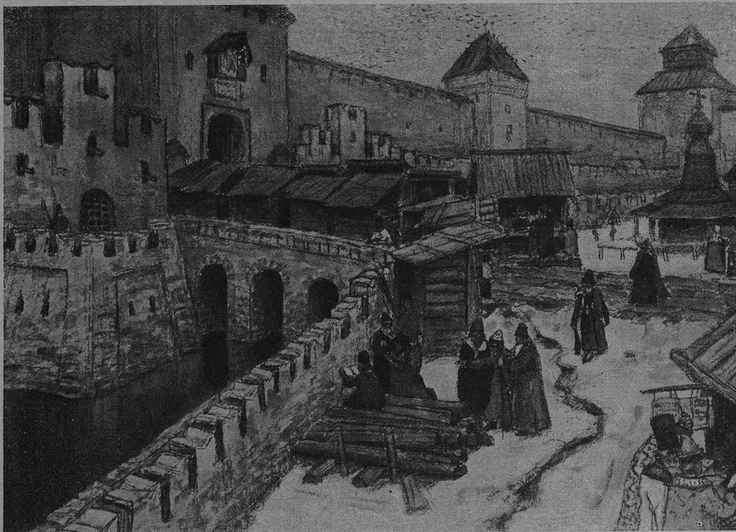
А. М. Васнецов: „Старая Москва“.

Его знакомство с проживавшим в то время в Вятке, известным своими изданиями, Павленковым, — открыло ему путь к ряду новых для него иллюстрированных работ, имевших значение отличной, практической школы рисунка, а так же и как источника к его материальному существованию. Такого же рода рисунки обеспечивают