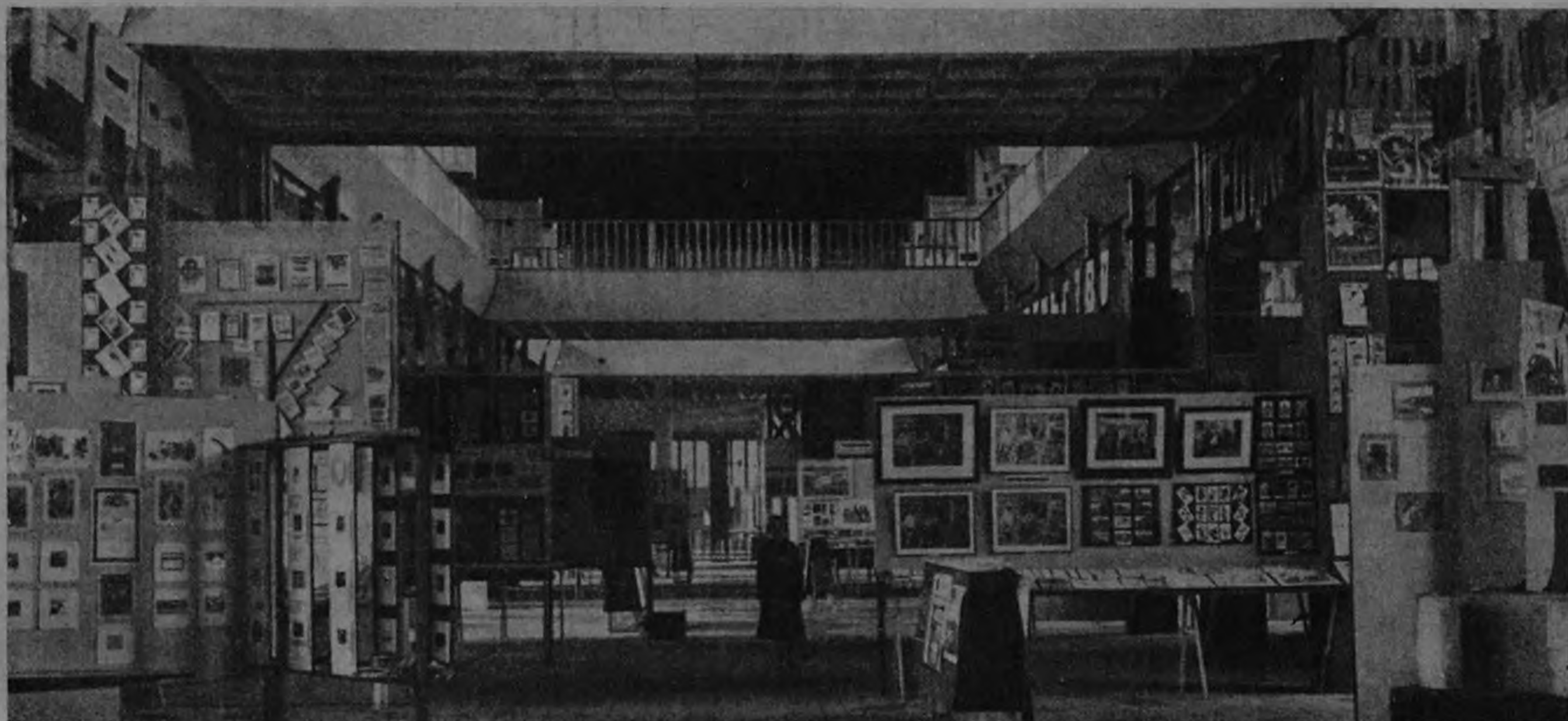
Общий вид выставки

Открывшаяся в Москве Всесоюзная Полиграфическая Выставка организована ВСНХ по постановлению Совета Труда и Оборона. Задача выставки — подвести итоги в связи с десятилетием революционной печати, выявить достижения и недостатки нашей полиграфической промышленности. Один из основных принципов построения выставки — производственный. Перед зрителем проходят образцы печати посредством соей разнообразной техники. Распределенный по отдельным предприятиям Москвы, Ленинграда, Нижнего-Новгорода, Киева, Казани, Харькова, Тифлиса, Мпнска и других городов, богатый материал выставки показывает, какая техника печати представлена у нас наиболее сильно, и что является наиболее совершенной специальностью отдельных предприятий. Было бы, однако, несправедливо ограничивать значение выставки только показом качества и видов техники современной полиграфической промышленности; ее содержание несравненно глубже. Наряду с типографиями на выставке широко представлены издательства и художники — граверы, литографы, офортисты, иллюстраторы, рисовальщики и т. п.