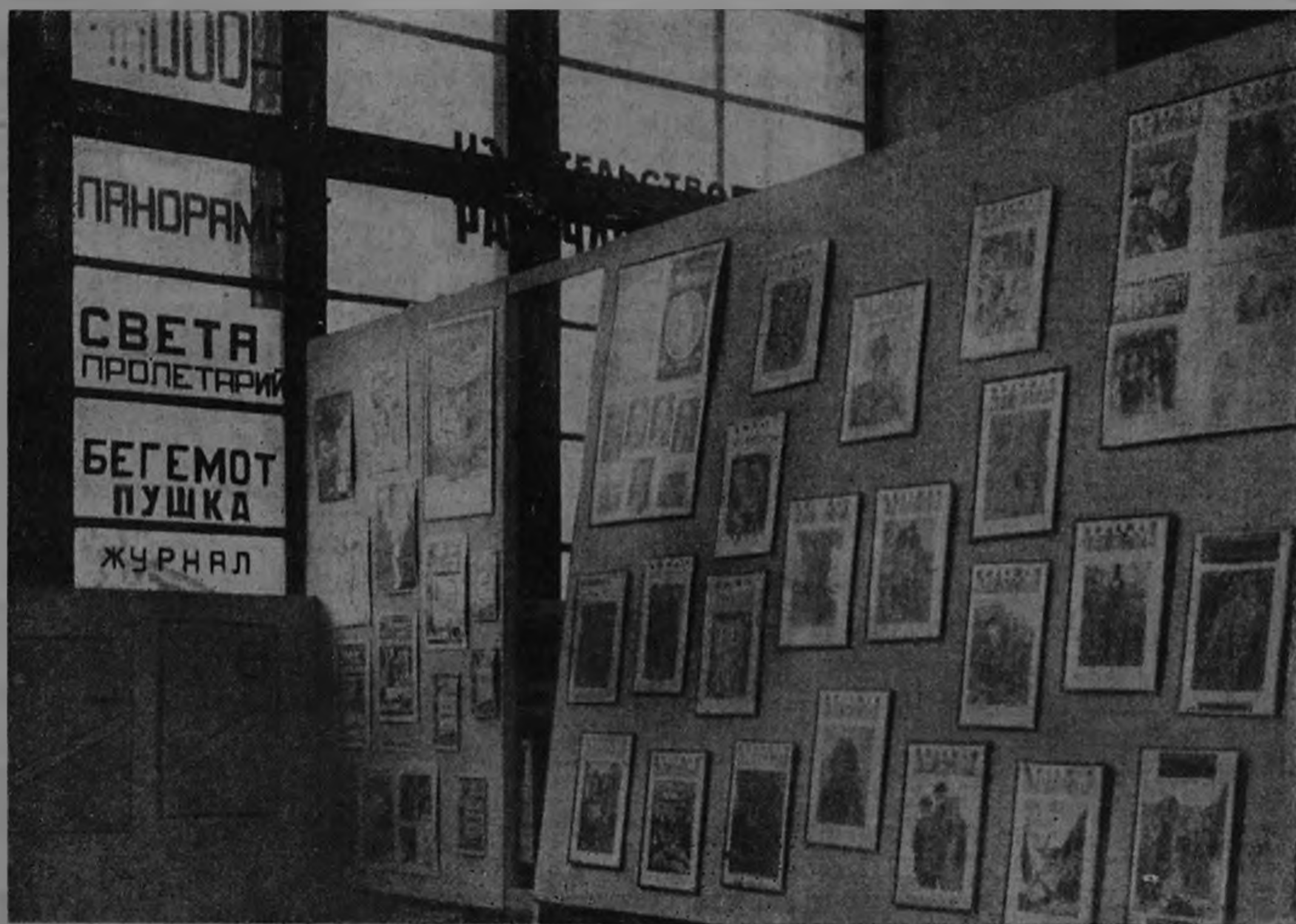
Витрина обложек журнала «Красная Панорама»

предметном. Причем наибольшего внимания заслуживают современная геральдика, обложка, иллюстрация, детская книга, художественные издания, форзац, плакат, промышленная графика и т. п.