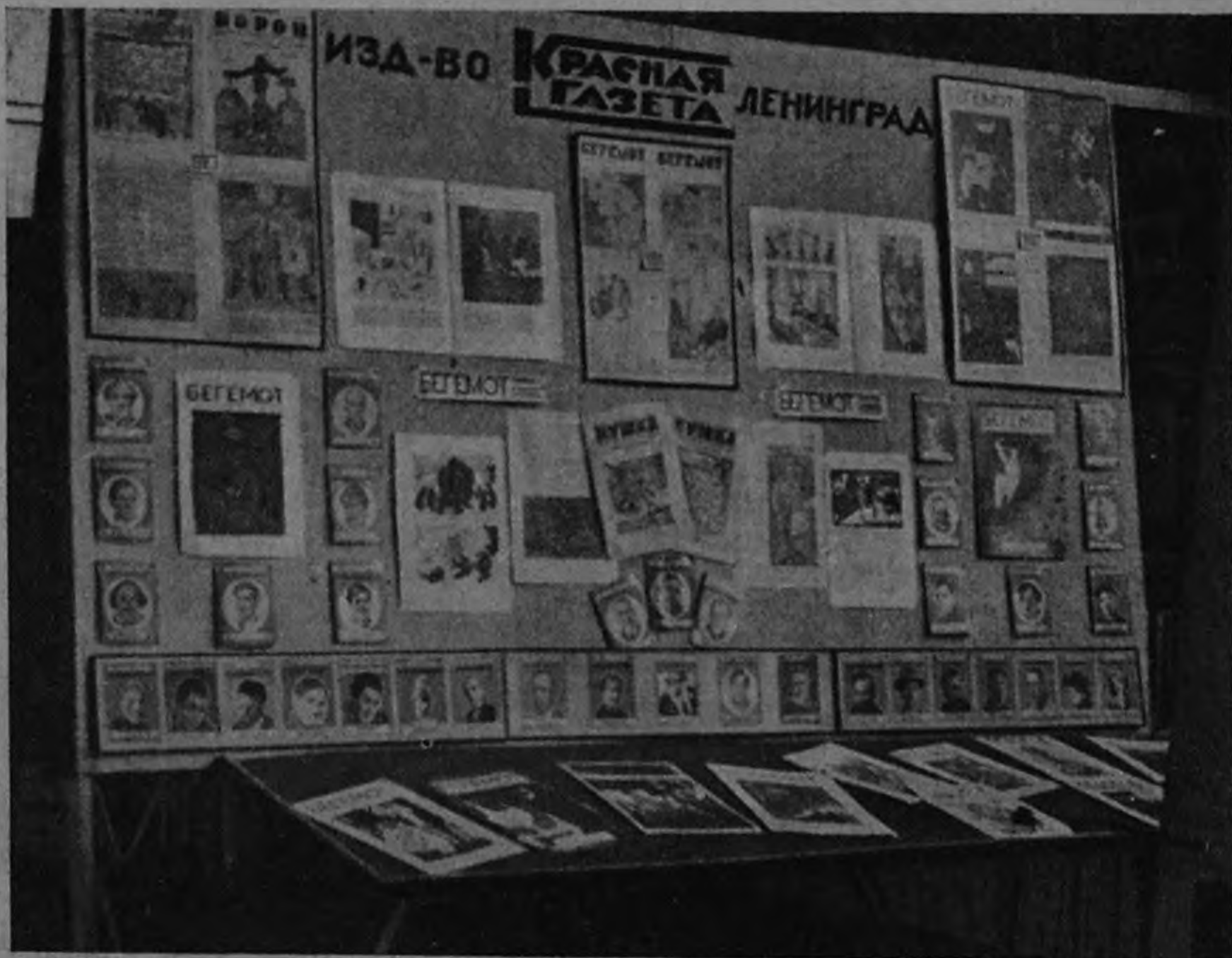
Витрина обложек журналов «Резец», «Бегемот», библиотеки «Бегемота», и других изданий «Красной Газеты»

Выставке Декоративных Искусств в Париже в 1825 году Госзнака, где в красочных репродукциях с одинаковым искусством переданы и переливающаяся поверхность фарфора и тончайшая живопись по папье-маше палехских мастеров. Из последних изданий большим культурным достижением следует признать альбом «Красной Газеты», посвященный десятилетию революции. Красочная геральдическая обложка, иллюстрации, заставки и концовки работы С. Чехонина должны быть отнесены к лучшим вещам художника. В то же время техника печати не только поднимается до уровня иллюстрирующих художников, но нередко дополняет замысел графика композицией листа, подбором шрифтов и т. п. Сравнительно слабо представлена на выставке различного вида промышленная графика: упаковка, плакат, реклама и т. п. Больше того, имеющиеся экспонаты показывают, что эта область еще ждет своих художников. Совсем слабо представлен на выставке плакат во всех его видах, агитационный, кино-плакат, промышленный, издательский и др.