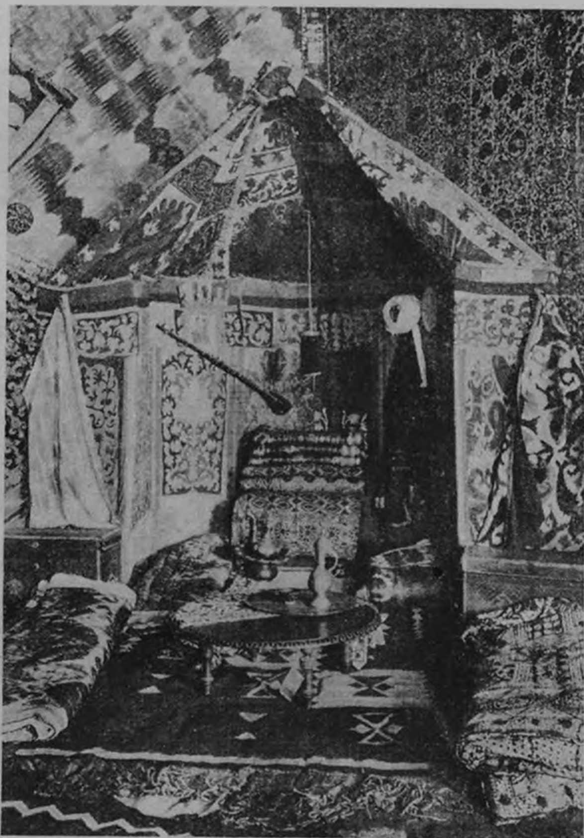
Бухара — Туркменская легкая палатка крестьянина-середняка