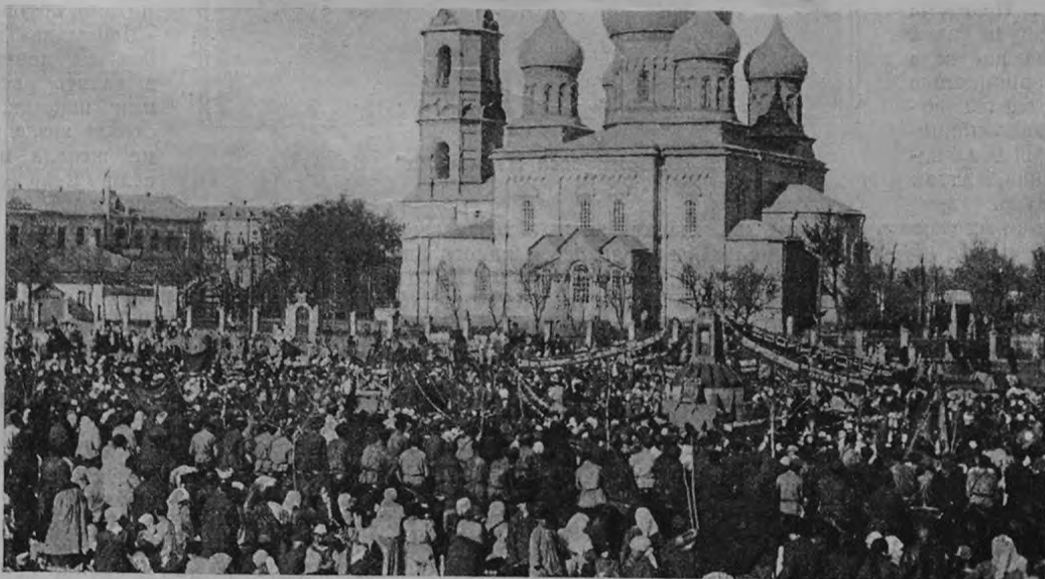
Открытие памятника В. И. Ленину в станции Батаалпашинской (Кубанская область) в день 7-го Ноября