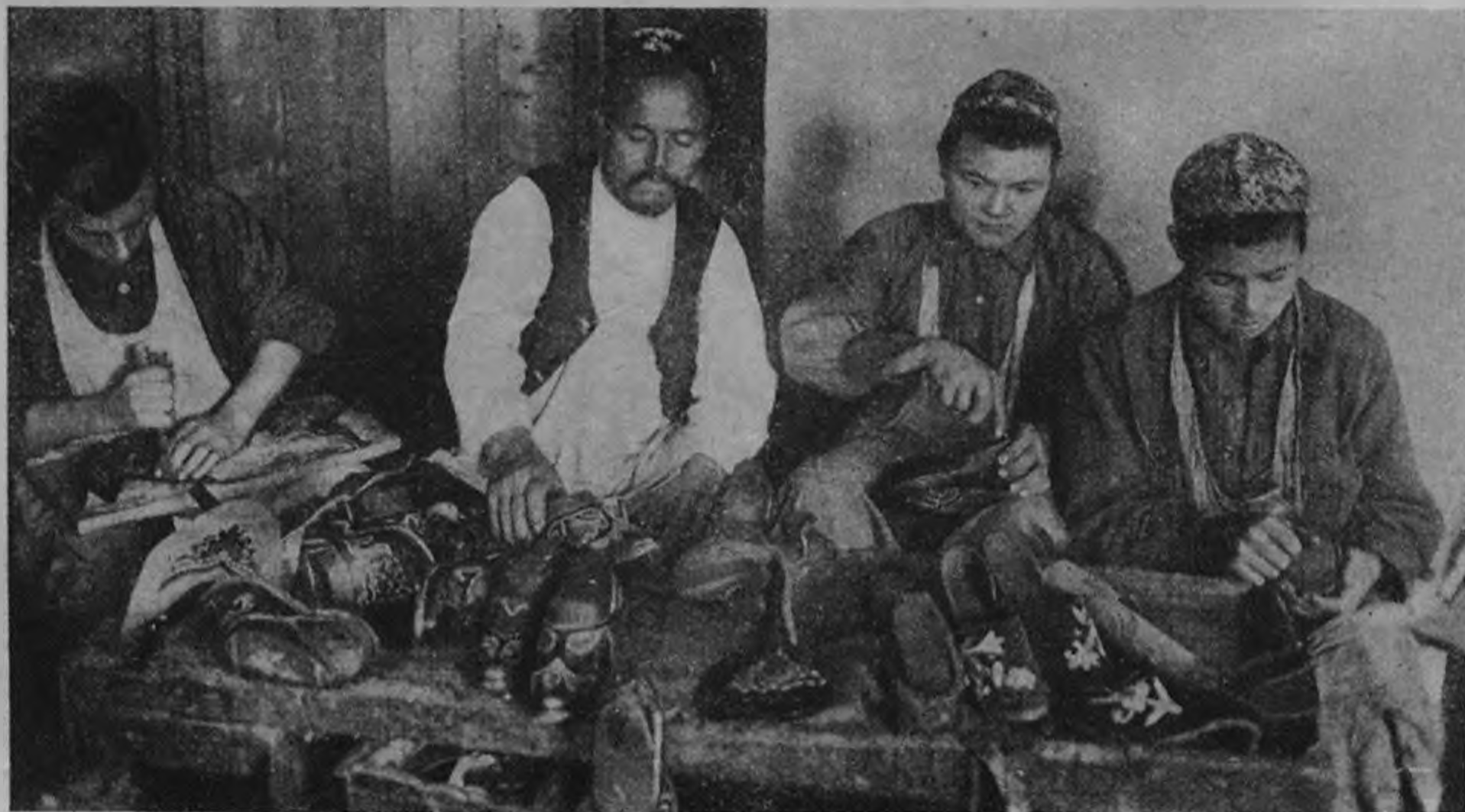
Производство бархатных и кожаных туфель в Кавани