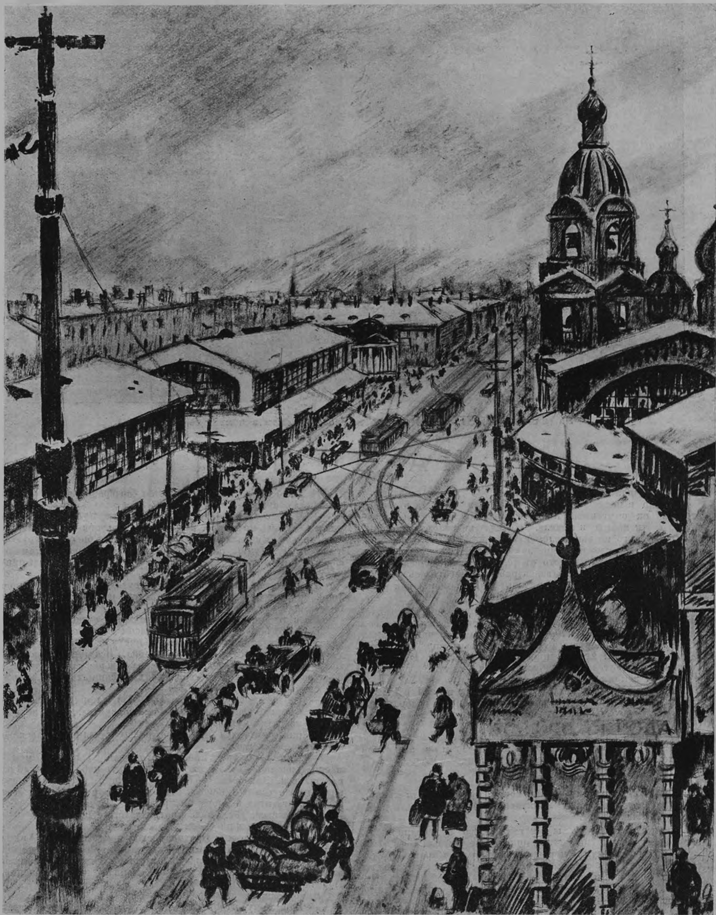
Ул. 3-го Июля (б. Садовая) — у Сенной площади