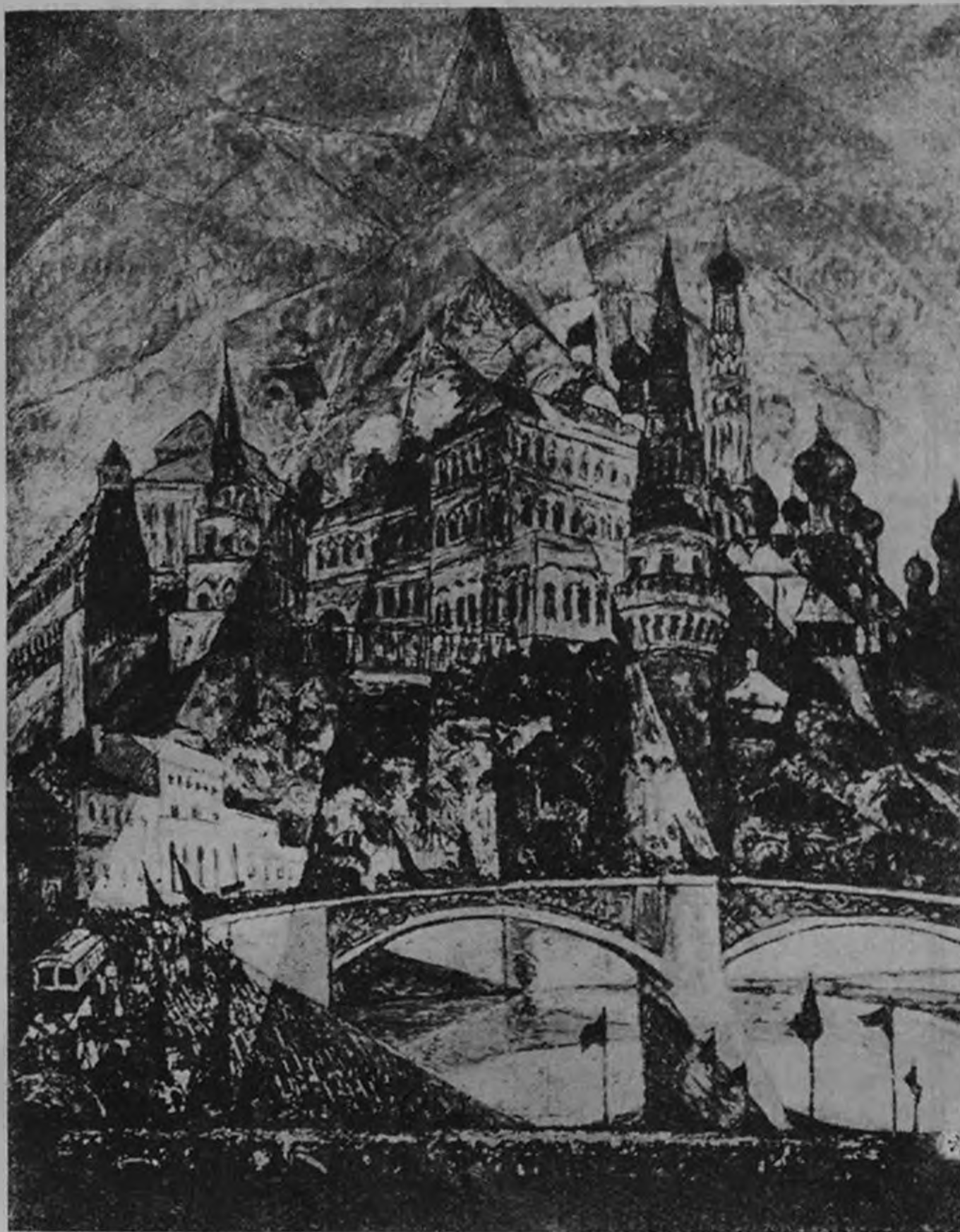
В Германии организована выставка работ революционных художников, посвященная 10-летию Октябрьской революции. На снимке картина худ. Фогелера — «Москва»

них выделяются пейзажи, «В Армении» и «Караван», где, в отличие от «лирического» и эстетически-плоскостного периодов своего творчества, художник впервые прибегает к передаче глубины и развернутого пространства. Гос. театр в Эривани показал ряд макетов Георгия Якулова и других художников. Архитектура представлена талантливыми вариациями ориентального классицизма в проектах Таманьяна.