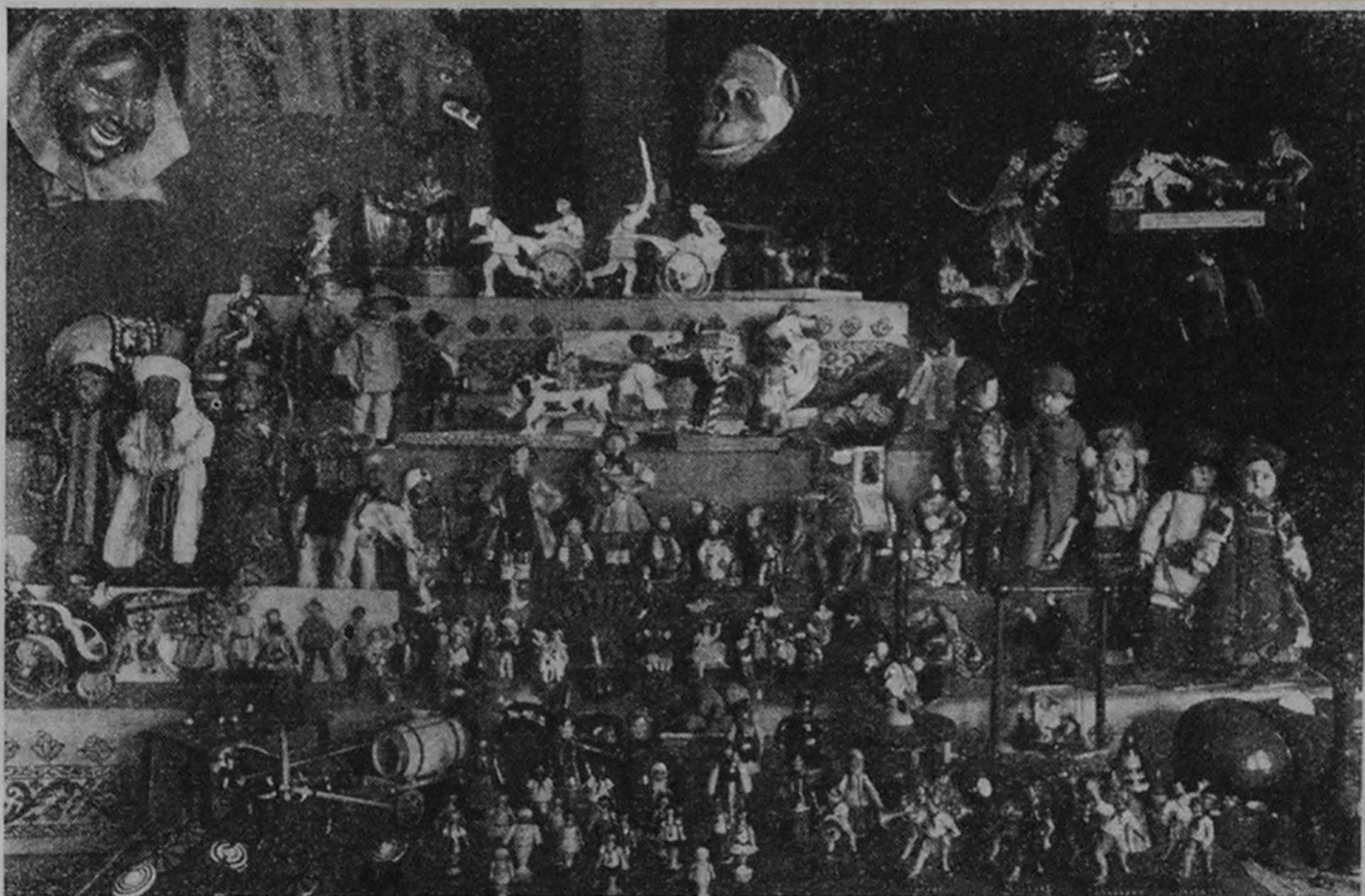
Игрушки работы московских кустарей