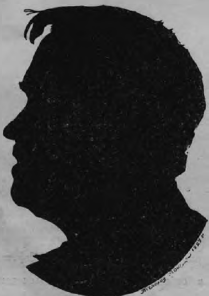
Б. М. Кустодиев

Умер он 49 лет, т. е. в такие годы, когда, обычно, пышно расцветают духовные силы художника-творца; и он ушел от нас, измученный болезнью, но со светлым и ясным умом, с «золотыми» руками, от которых можно было ждать еще много прекрасных созданий.