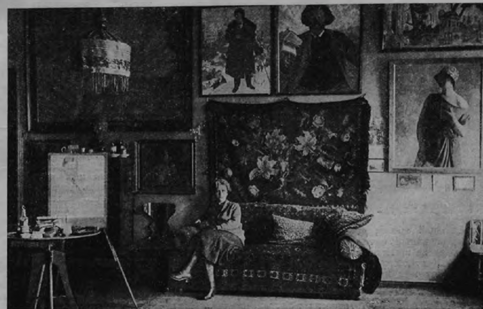
На диване — жена покойного художника