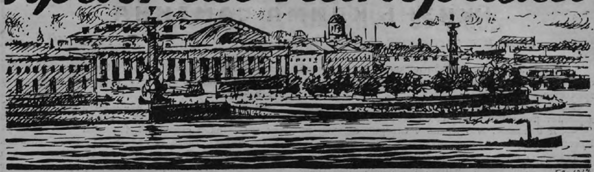
Рисунок худ. Г. С. Верейского