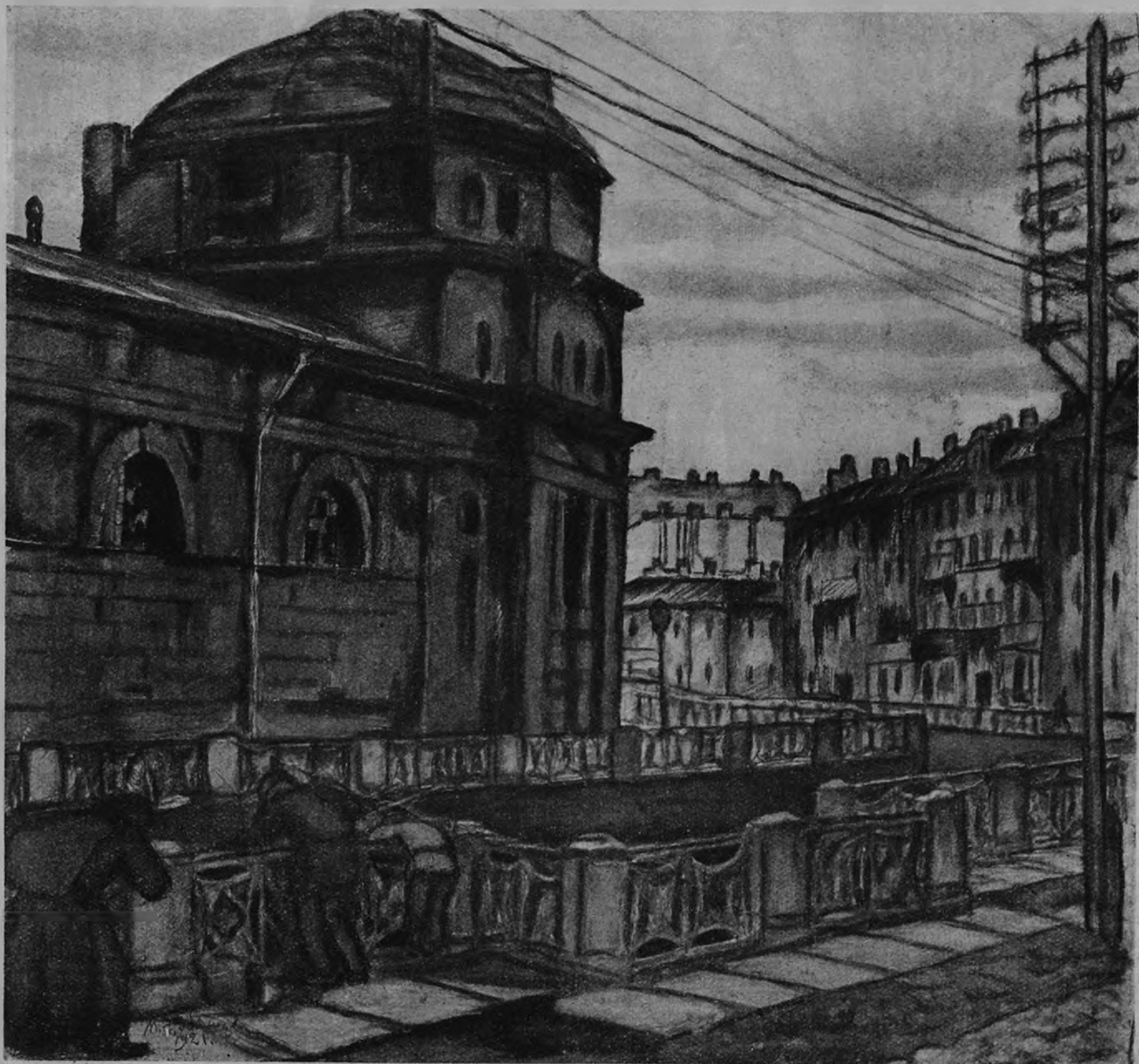
На Мойке, у здания быв. Конюшенного ведомства