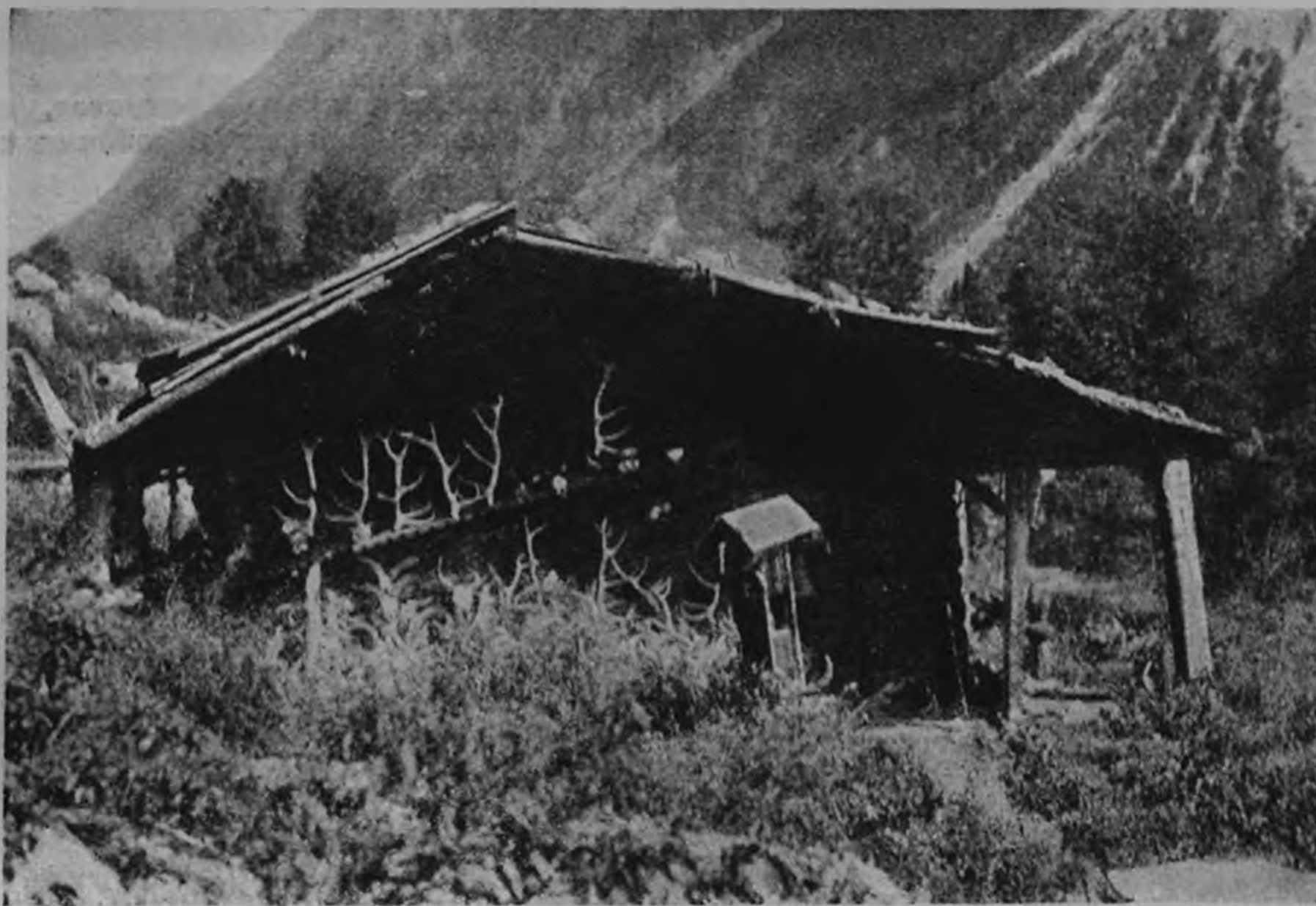
Жертвенное место «Реком»

Пименов как-то мало двигается вперед, застыл на раз найденной композиционной и красочной концепции — жестко-плакатном стиле. Зато несомненные успехи делает Денисовский, давший отличный портрет Якудова. Тышлер, выставивший на Совнаркомовской выставке несколько чудовищно безвкусных и цинически нелепых холстов, сейчас дал серию из 8 акварелей, названную им «Лирический цикл» и изображающую голых женщин. В противоположность бледно-серой, скверной живописи Совнаркомовских картин на тему «Махновщина», эти акварели выдержаны в ярких, звучных, сочных и красивых цветах, но, к сожалению, до того бесформенны и ученически неграмотны, что, несмотря на несомненную одаренность автора, оставляют досадное впечатление каких-то непонятных и ненужных клякс.