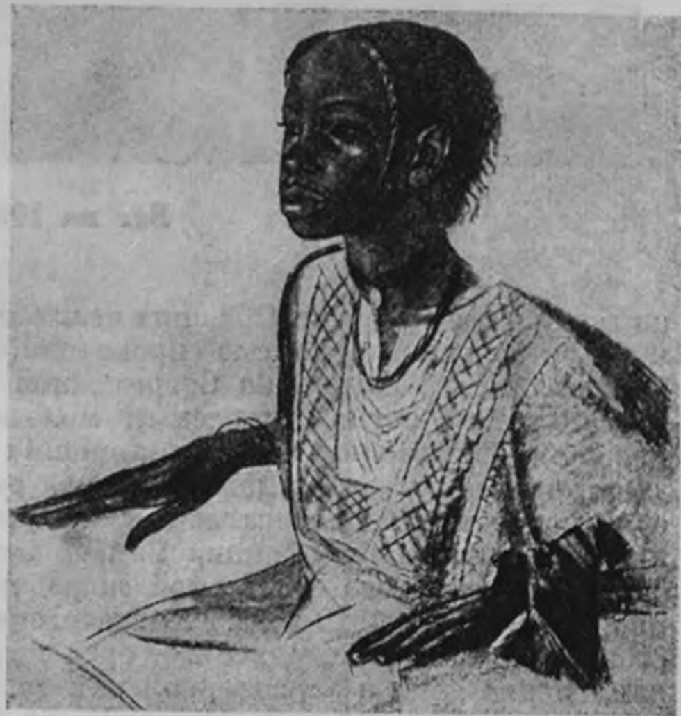
А. Яковлев — „Девочка племени Бурру“

Полоса кризисов раньше всего оказалась в области концертной и, особенно, на симфоническом участке. В настоящее время Москва обслуживается регулярно лишь двумя симфоническими оркестрами, из коих один «бездирижерный», — Персимфанс (яв-