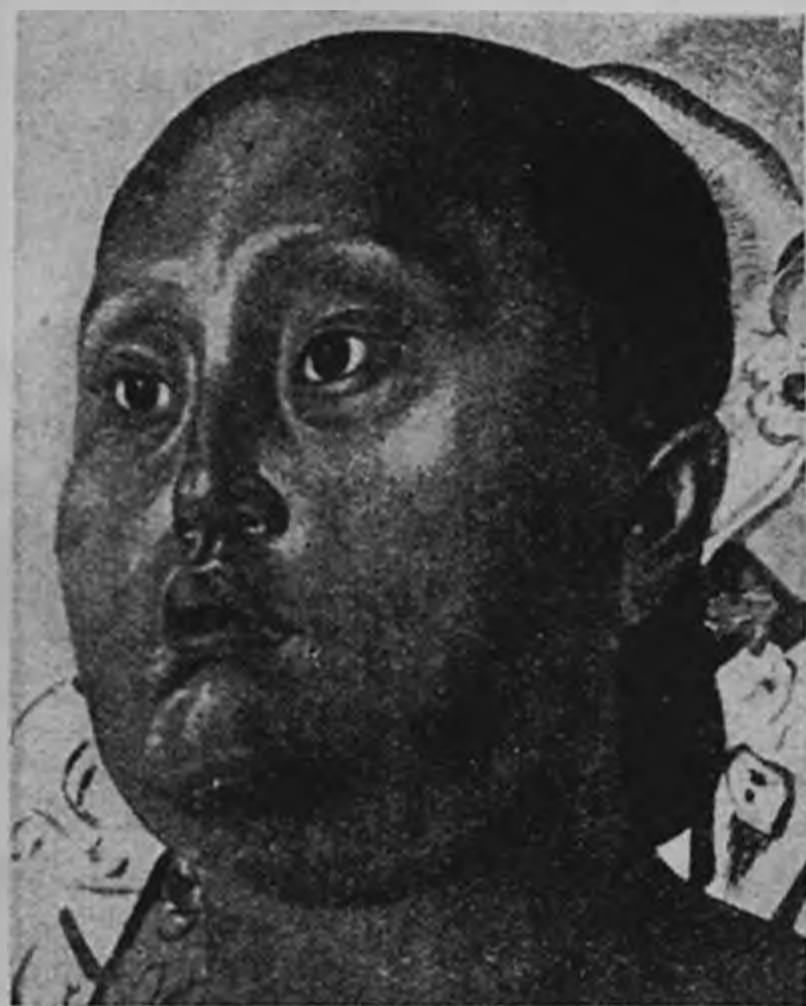
А. Яковлев — «Голова китайки»