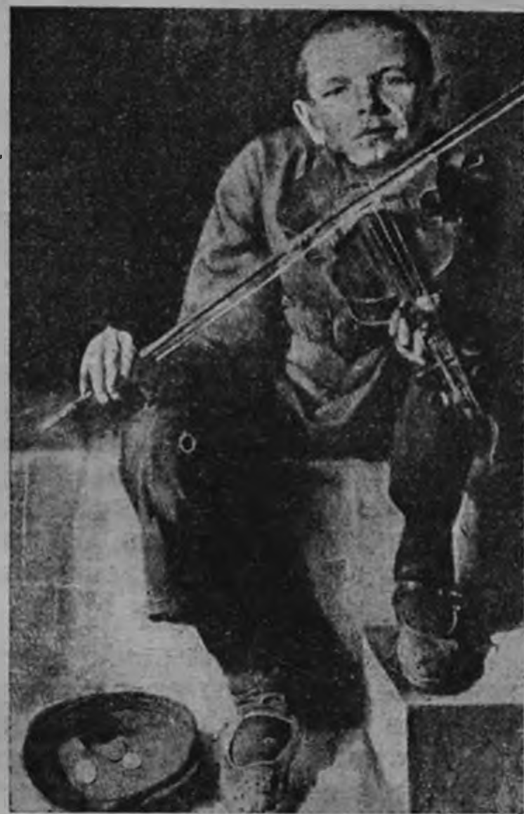
В Нью-Йорке на выставке советского искусства большой интерес вызывают работы художника С. А. Кадмана* и в особенности его картина „Уличный музыкант“ * Е. А. Кацман

Впоследствии Давыдовский получил амнистию и вернулся с семьей в Москву. «Дмитриева» вскоре умерла. Об ее воспитании в детстве и об ее жизни после коммуны материалы еще собираются и будут опубликованы в «Летописях марксизма».