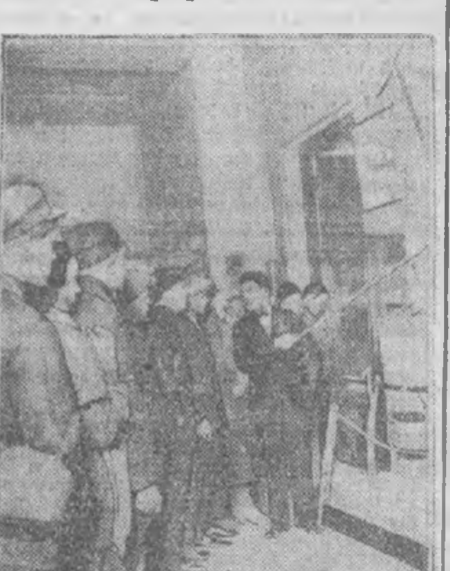
В день пятилетней годовщины со дня смерти Ленина Музей Ленина посетили неисчислимо количество экскурсий.