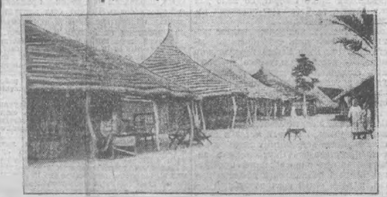
Главная улица в одном из поселков французского Конго, где сейчас происходит восстание негров.