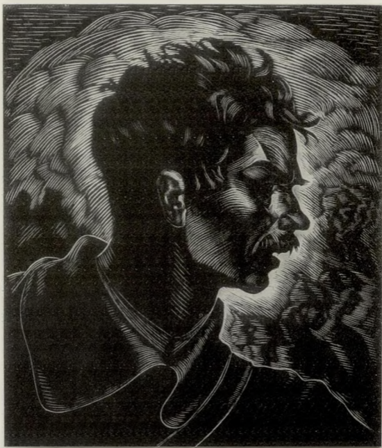
KASSIAU : TÊTE DE GUERRIER (BOIS). (U. R. S. S.)