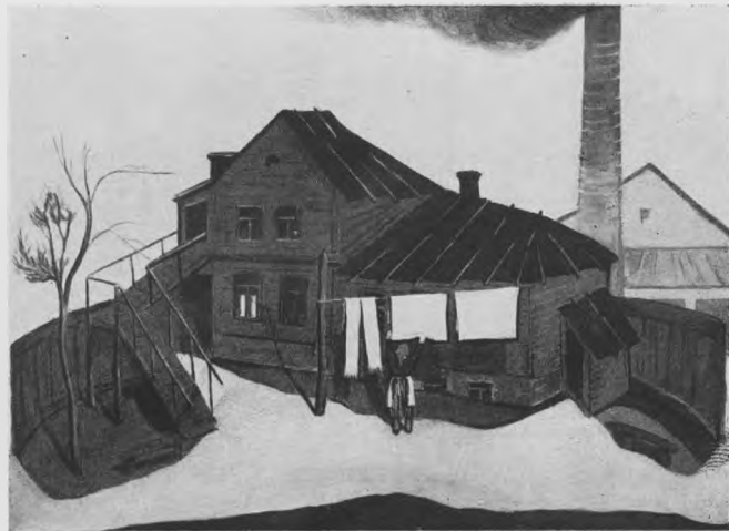
А. АРБУЗОВ. «ДОМИК НА ОКРАИНЕ». Эскиз декорации.