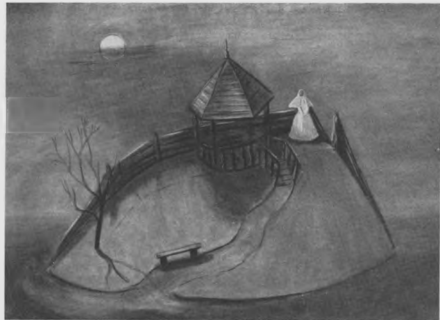
А. ОСТРОВСКИЙ «ГРОЗА». Эскиз декорации. В овраге.

На титуле: Эскизы костюмов к «Эстрадным номерам» (театр «Синяя блуза»).