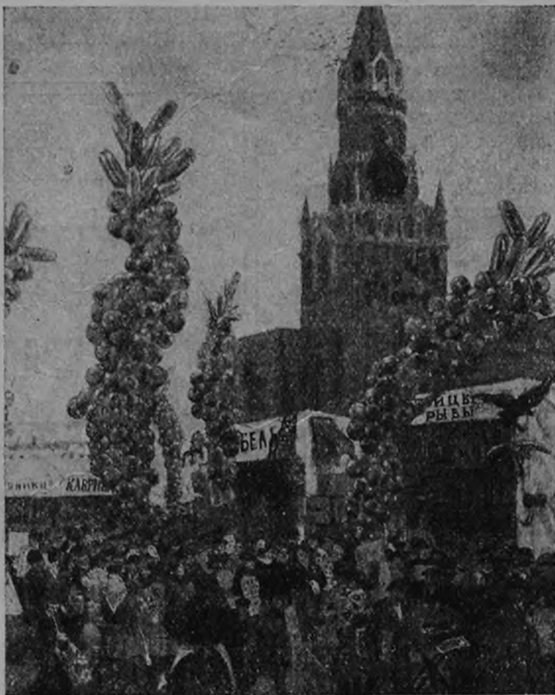
„Вербный торг у Сухаревки“