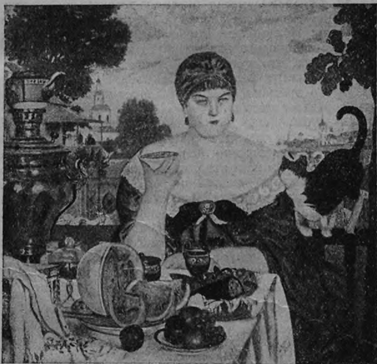
„Купчиха за чаем“

Нельзя не отметить, что выставка устроена очень парадно, что Музеем специально оборудовано освещение зал,