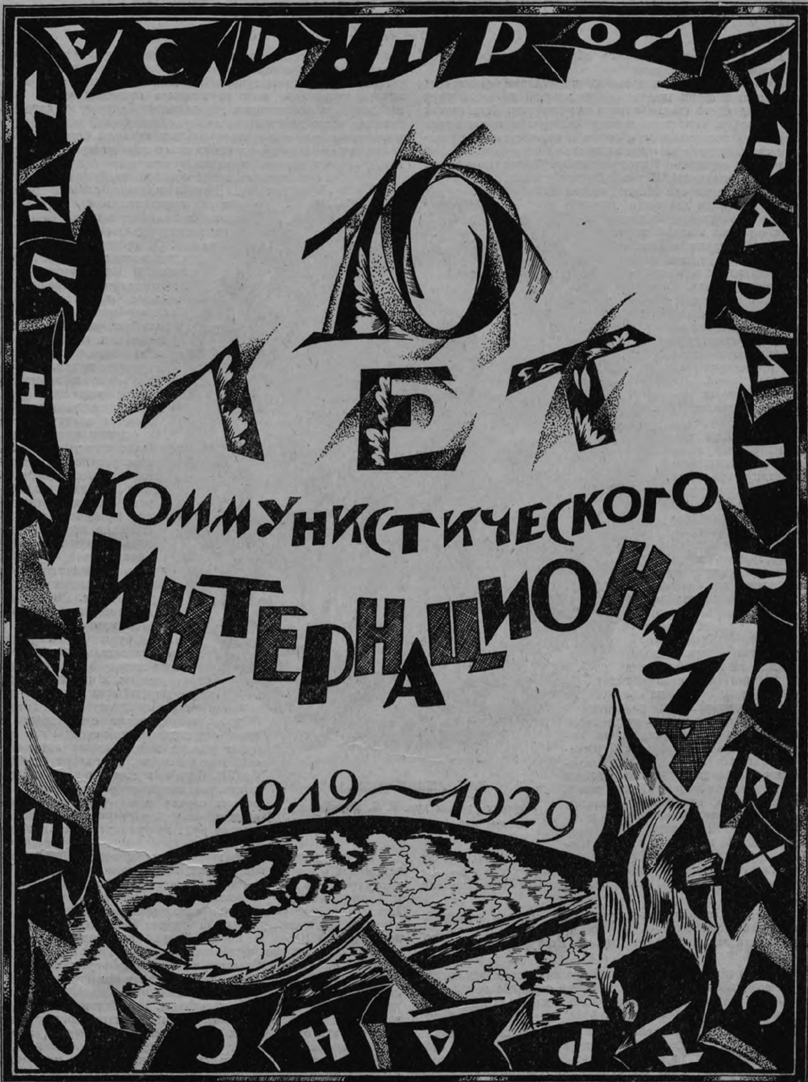
Рис. раб. худ. С. В. Чехонина