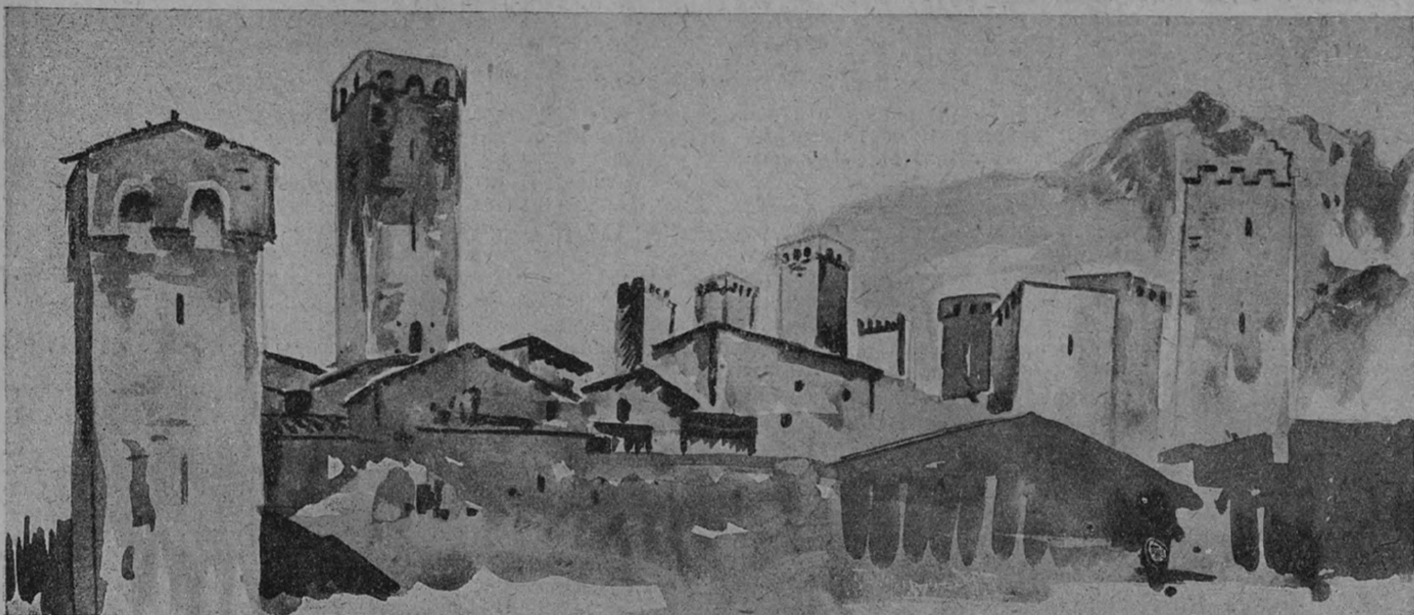
Общий вид Местии (Сванетия)