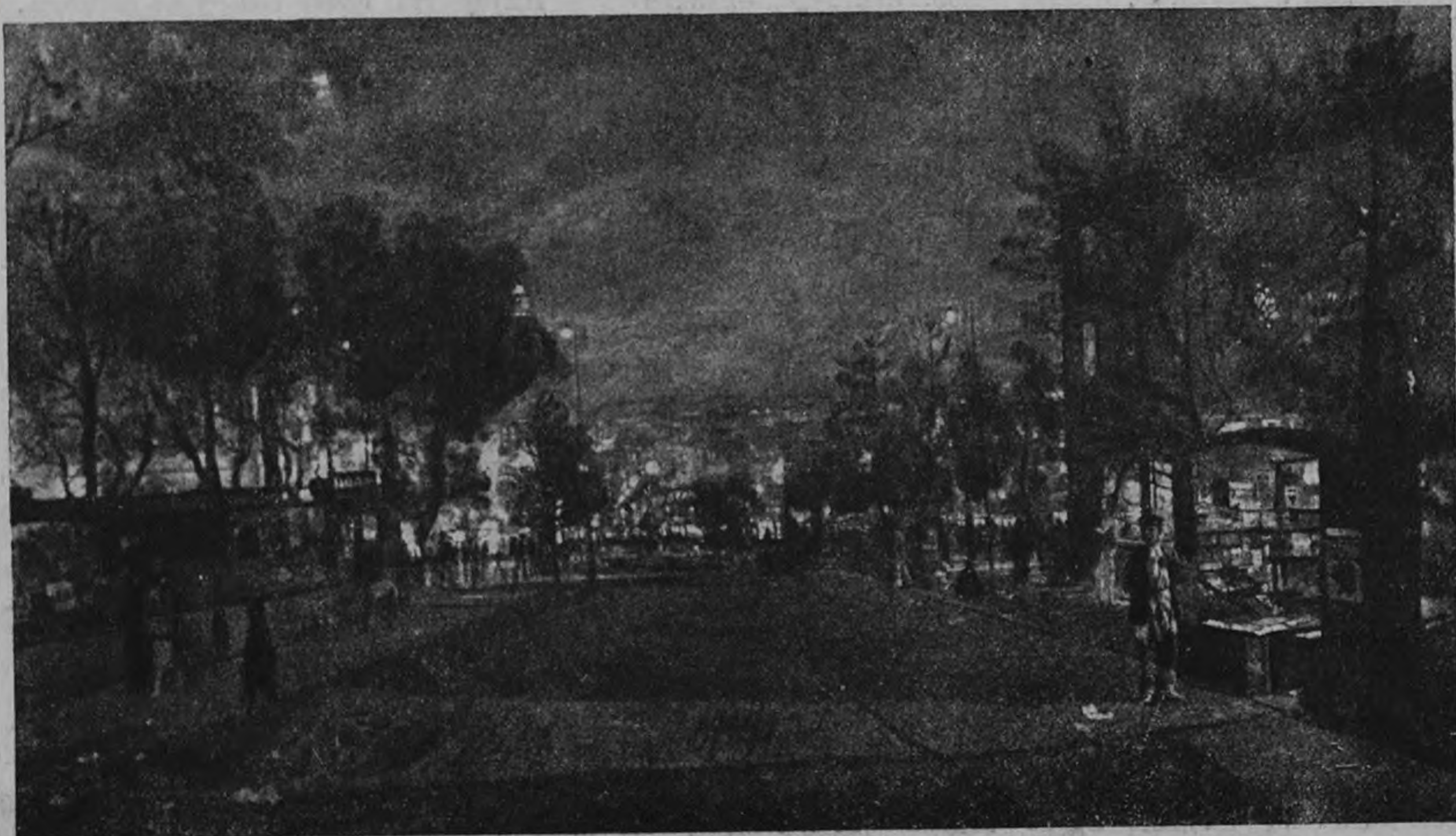
Город в вечерние часы