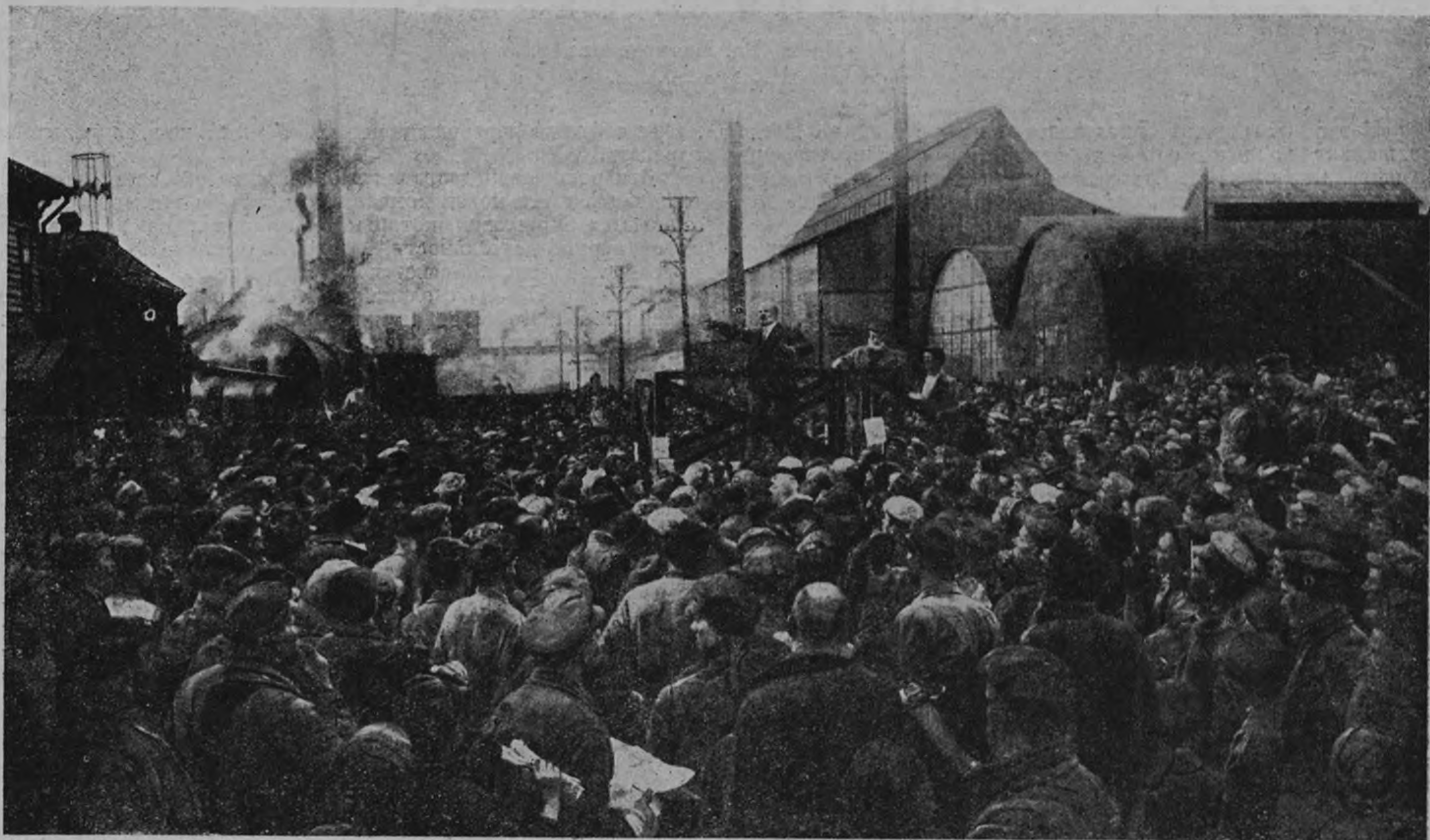
Худ. И. И. Бродский. «Ленин на Красном Путиловце» — новая картина художника, приобрет. Путиловским заводом

достигает натуралистической иллюзорности, особенно им преследуемой в портретах последней поры; например: Сталина, Ленина, в групповых портретах — «Заседание Реввоенсовета», «М. Горький среди рабкоров «Красной Газеты», в многочисленных рисунках деятелей Коминтерна и т. под.