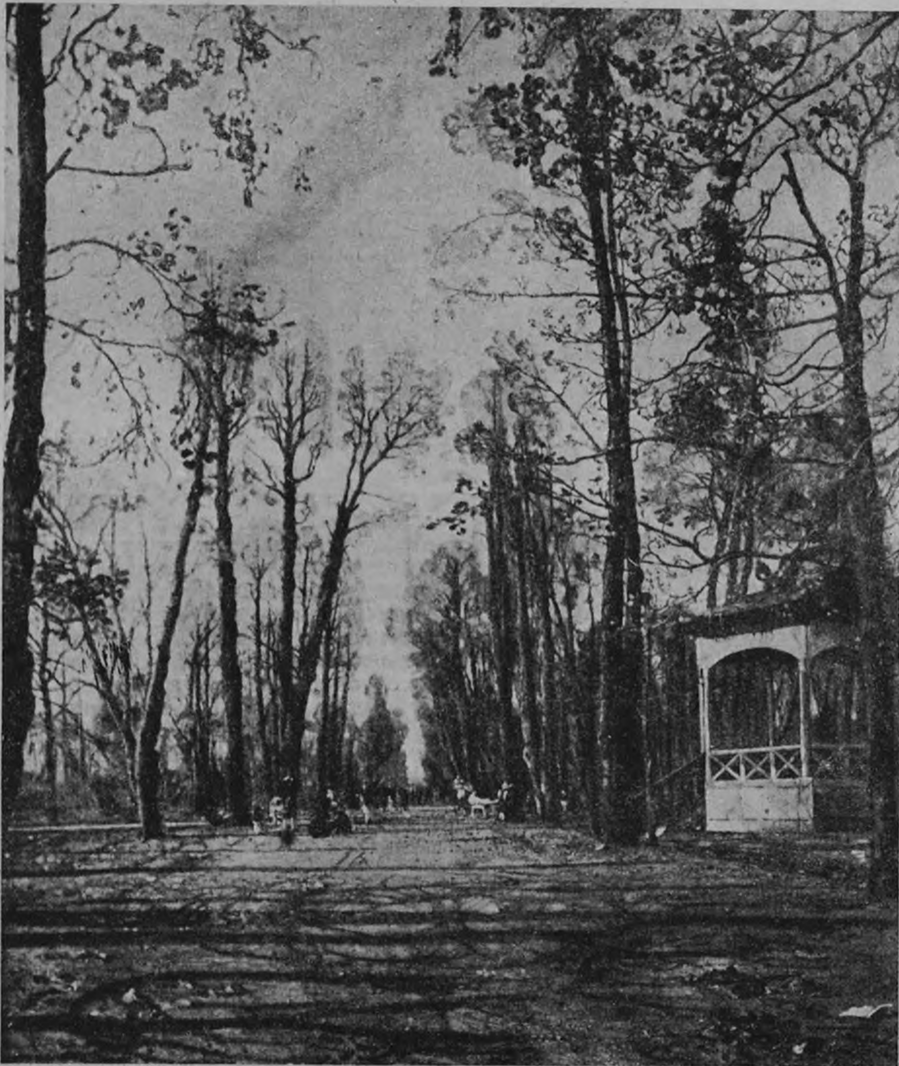
Худ. И. И. Бродский

На вопрос о пользовании проституцией — ответил: «Раньше — да, а теперь есть жена». В этих нескольких строках больше житейского, чем во всей гряде каламбуров феерической комедии.