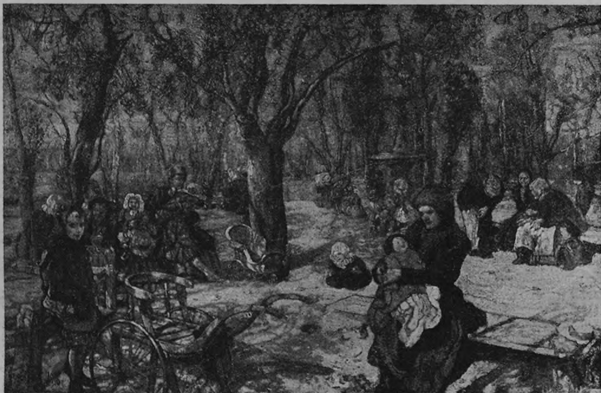
Худ. И. И. Бродский