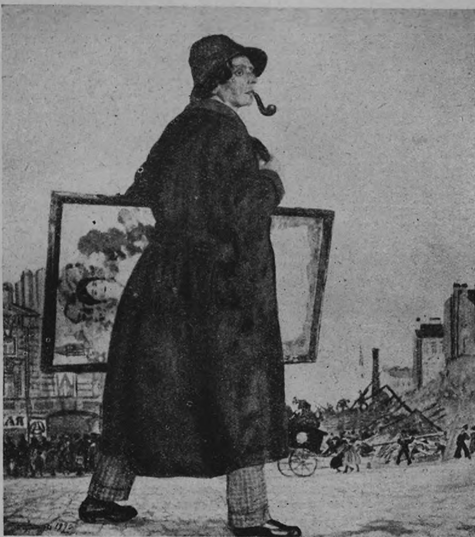
Худ. И. И. Бродский Портрет работы худ. Б. М. Кусгодиева (1921 г.)

В портретах работы Бродского опять-таки — упор на строго проработанный рисунок, на индивидуальные детали и особенности модели, которые он ставит в центр ее характеристики. Идя по этому пути, Бродский