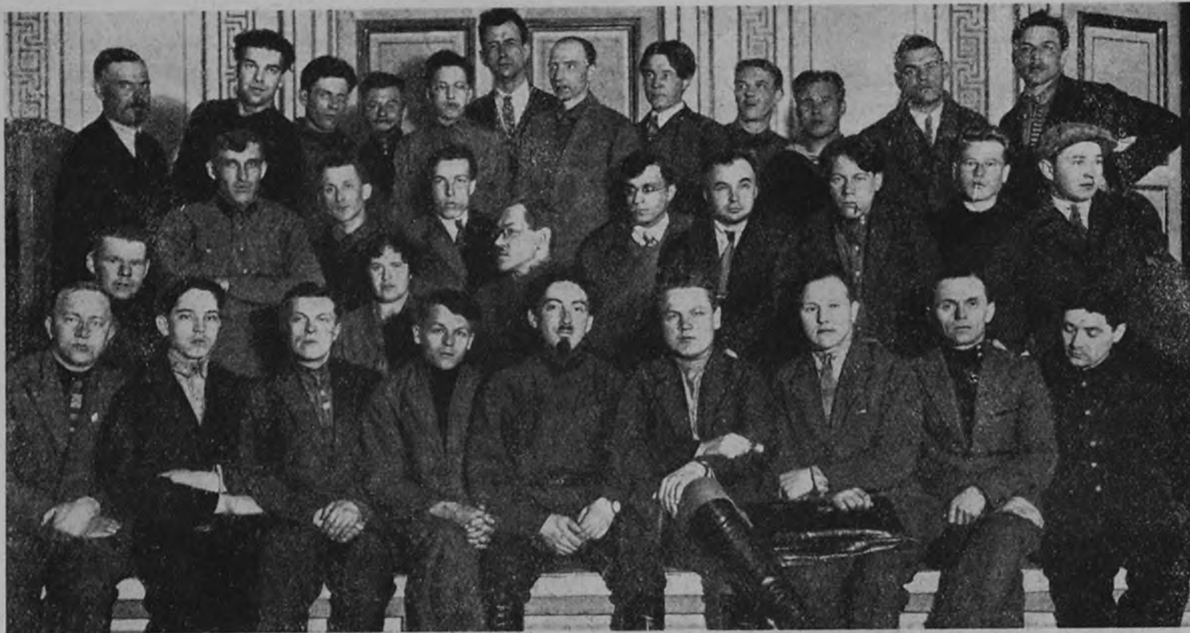
Правление ЛАППа, избранное на 2-й областной конференции пролетарских писателей