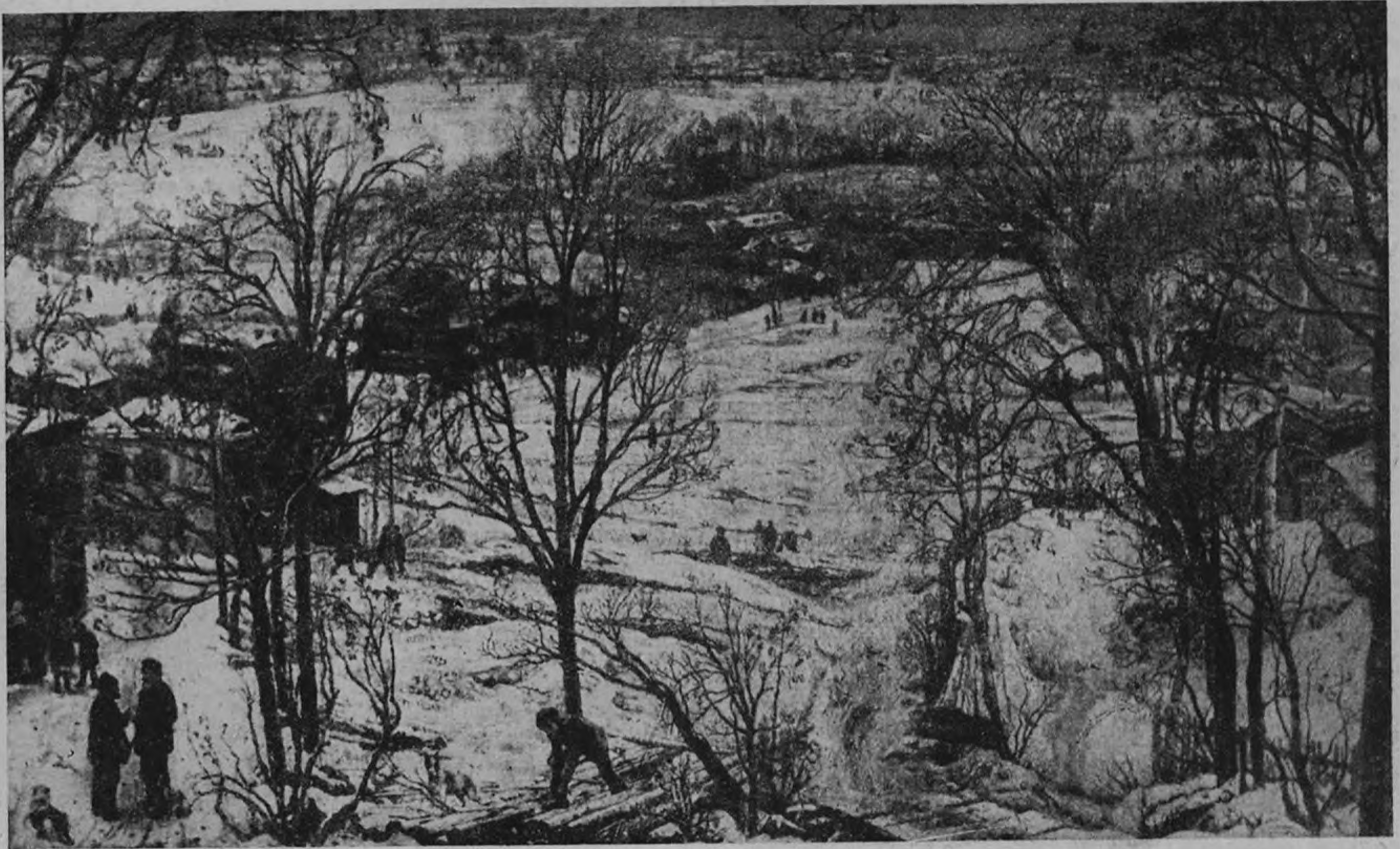
Худ. И. И. Бродский