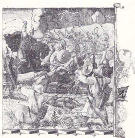
Большая битва. Иллюстрация к поэме «Слово о полку Игореве». 1950.