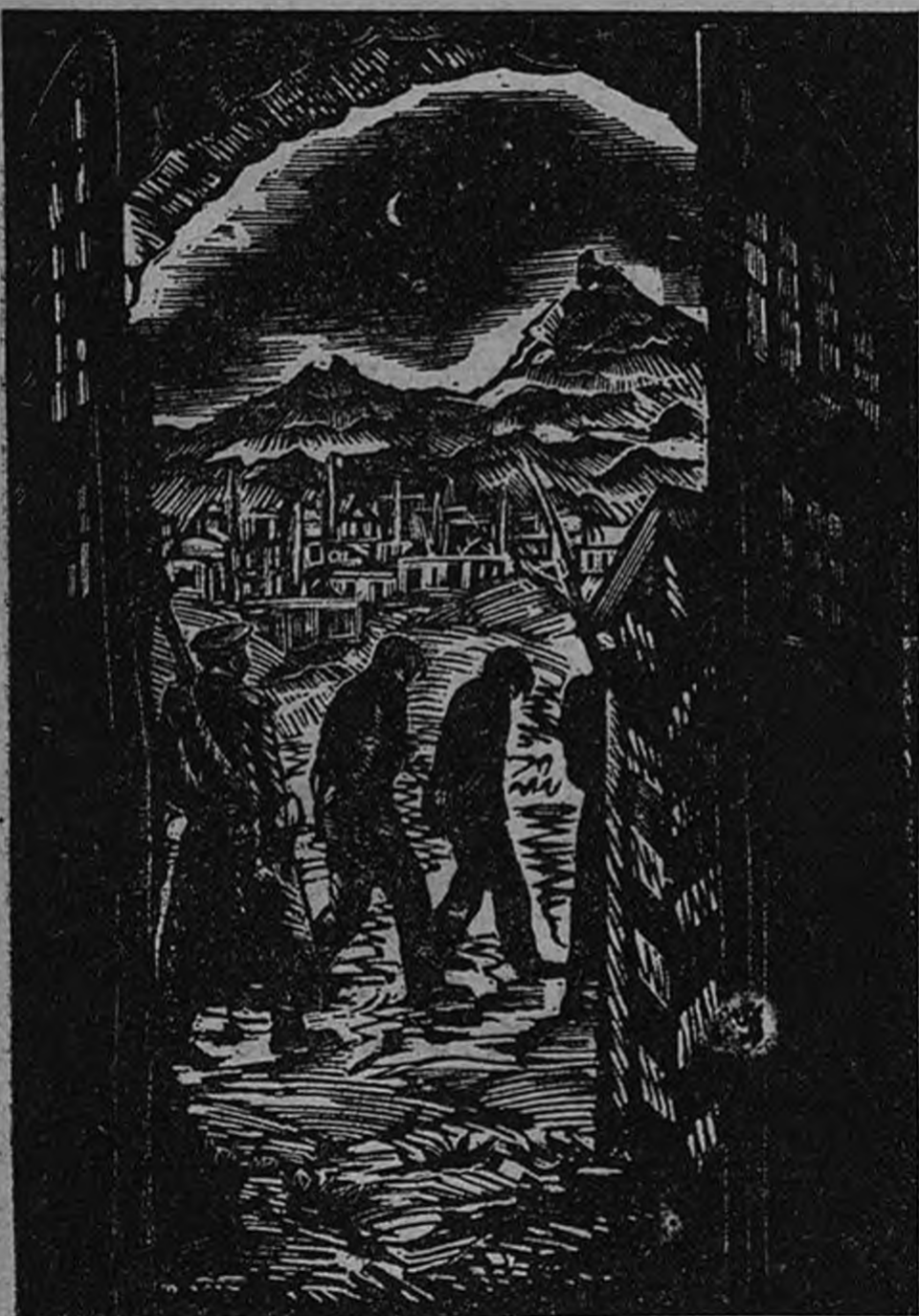
А. Гарибянец.—«Арестованные революционеры»

Опытным гравером проявил себя С. М. Мочалов, недавно приглашенный преподавателем ксилографического искусства в Ленинградский техникум. Его иллюстрации к повестям