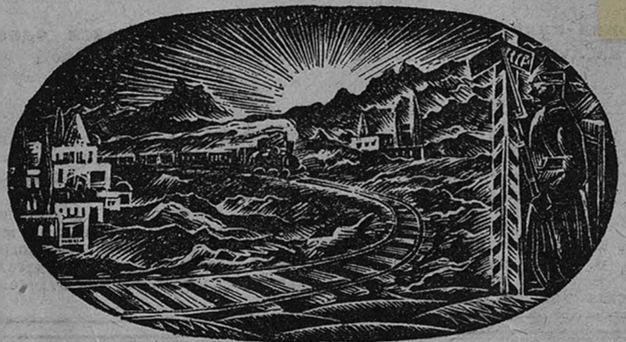
А. Гарибянец.—Из иллюстраций к «Стразе наиров»