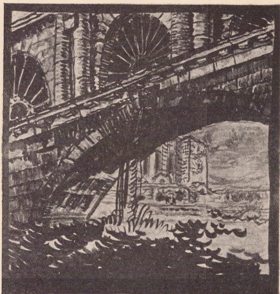
Н. Андреев. „Морской вокзал“ (рисунок к дипломной работе 1939 г.).

Ответственный редактор В. Я. Родионов. Составители издания П. М. Дульский и И. А. Бродский. Корректор Э. А. Старк. Обложка В. Мичурина. Сдано в набор 23 XI-1939 г. Подписано к печати 23 XII-1939 г. Ленгорлит № 6220. Тираж 900 экз. Объем 2 1/2 л. Формат бумаги 90 × 62. Заказ № 11325.