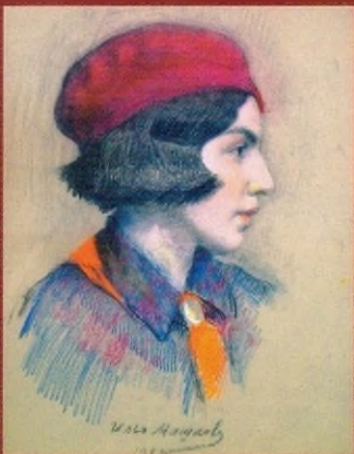
Портрет девушки в малиновом берете и красном галстуке. 1922