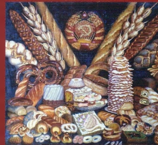
Советские хлебы. 1936

Илья Иванович Машков (1881–1944) – один из ведущих мастеров отечественной живописи 20 в., наиболее ценных в мировом художественном пространстве. Сегодня он воспринимается, прежде всего, как знаковая фигура русского авангарда, один из лидеров модернистской группировки “Бубновый валет”. Однако специфика творческой судьбы Машкова состоит в том, что он следовал за эволюционными ходами русской культуры, сохраняя устойчивость своих основных принципов. Именно с этой стороны раскрывается мастер в собрании Волгоградского музея изобразительных искусств (ВМИИ).