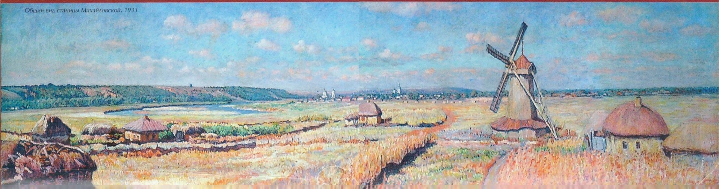
Общий вид станицы Михайловской, 1933