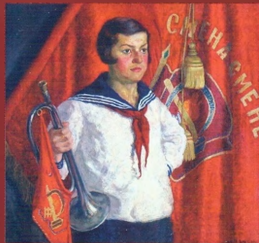
Пионерка с горном. 1933