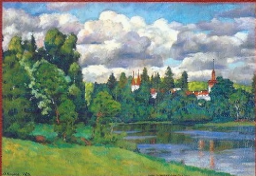
Нева. Островки. Дом отдыха. 1923