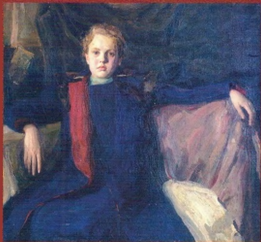
Портрет девочки. 1903-1904