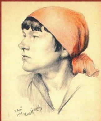
Голова девушки в красной косынке (в профиль). 1929