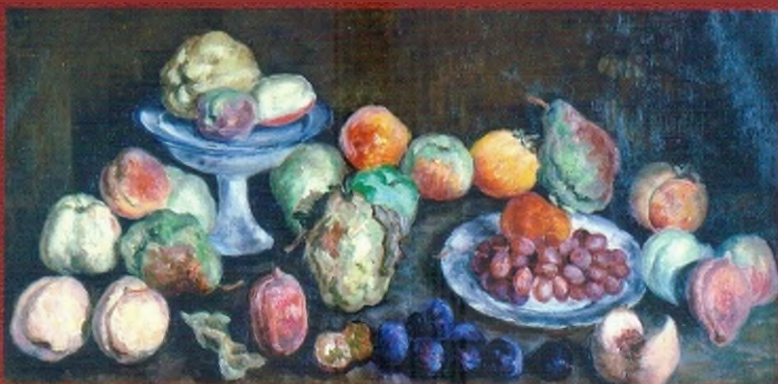
Фрукты с сельскохозяйственной выставки. Айва и персики. 1939