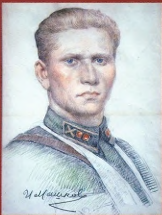
Портрет артиллериста. 1942–1943