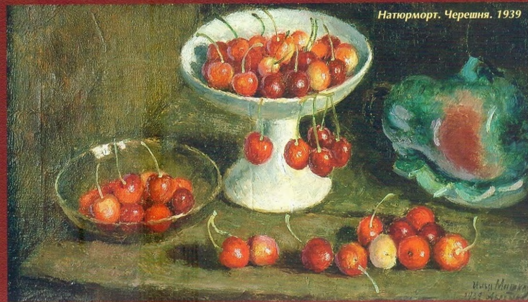
Натюрморт. Черешня. 1939

Выставка И. И. Машкова приурочена к 50-летию с момента организации Волгоградского музея изобразительных искусств (20 апреля 1960 г.). Именно собрание произведений этого мастера составляет гордость коллекции ВМИИ, в большой степени определяет лицо музея. В него входят 38 живописных и 60 графических работ – от самых ранних до самых поздних. Собрание произведений Машкова в ВМИИ – результат усилий нескольких поколений музейщиков. Начало коллекции было связано с рождением музея. Вскоре после его открытия Дирекцией художественных фондов (Москва) были переданы два натюрморта мастера (“Натюрморт. Черешня”, “Натюрморт на синем фоне”). На протяжении десятилетий одним из важнейших приоритетов собирательской политики музея было приобретение работ Машкова, его соратников и учеников. Большая часть коллекции оказалась в музее в течении 1970–1980-х гг. В нее входят как знаменитые, часто публикуемые произведения (“Новодевичий монастырь”), так и работы менее известные, не имеющие аналогов в иных собраниях, но не менее важные для понимания феномена художника (“Привет 17 съезду ВКП(б)”). Коллекция дополняется богатейшим архивом и предметами из мастерской художника. Особую ценность представляют работы 1930-х гг., написанные Машковым в наших краях, у себя на родине в станице Михайловской.