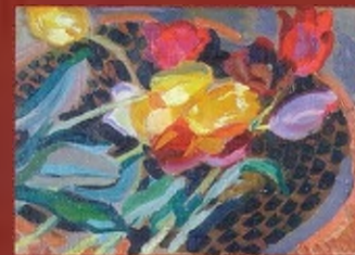
Тюльпаны на блюде. 1910