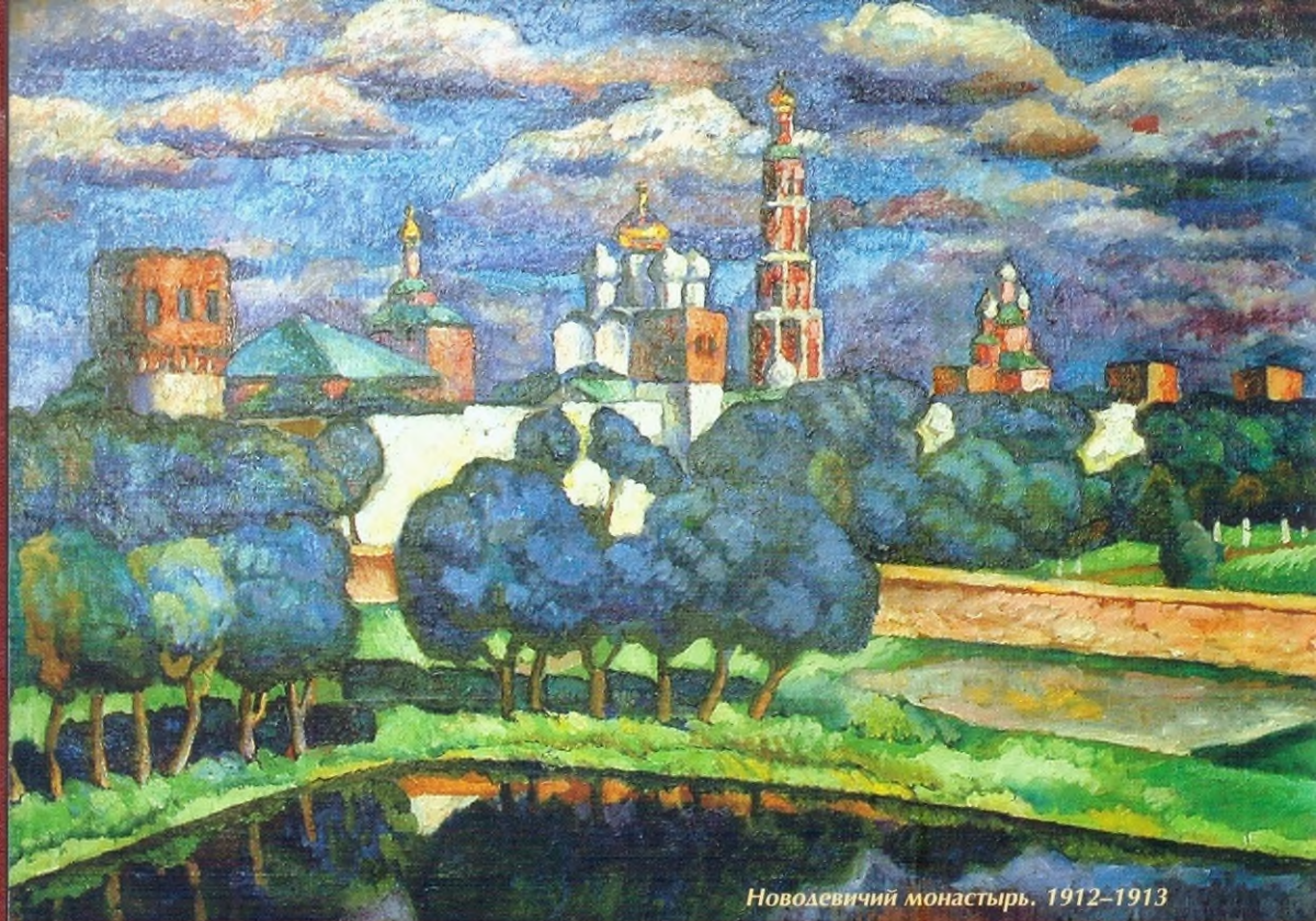
Новодевичий монастырь. 1912–1913

Выставка И. И. Машкова приурочена к 50-летию с момента организации Волгоградского музея изобразительных искусств (20 апреля 1960 г.). Именно собрание произведений этого мастера составляет гордость коллекции ВМИИ, в большой степени определяет лицо музея. В него входят 38 живописных и 60 графических работ – от самых ранних до самых поздних. Собрание произведений Машкова в ВМИИ – результат усилий нескольких поколений музейщиков. Начало коллекции было связано с рождением музея. Вскоре после его открытия Дирекцией художественных фондов (Москва) были переданы два натюрморта мастера (“Натюрморт. Черешня”, “Натюрморт на синем фоне”). На протяжении десятилетий одним из важнейших приоритетов собирательской политики музея было приобретение работ Машкова, его соратников и учеников. Большая часть коллекции оказалась в музее в течении 1970–1980-х гг. В нее входят как знаменитые, часто публикуемые произведения (“Новодевичий монастырь”), так и работы менее известные, не имеющие аналогов в иных собраниях, но не менее важные для понимания феномена художника (“Привет 17 съезду ВКП(б)”). Коллекция дополняется богатейшим архивом и предметами из мастерской художника. Особую ценность представляют работы 1930-х гг., написанные Машковым в наших краях, у себя на родине в станице Михайловской.