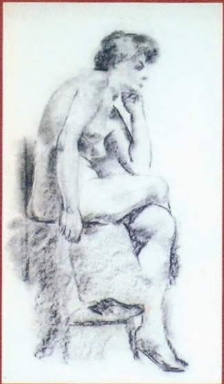
Этюд. Натурщица. 1920