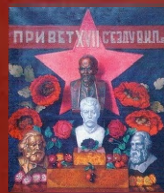
Привет XVII съезду ВКП(б). 1934