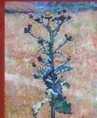
Степь. Репейник. 1933