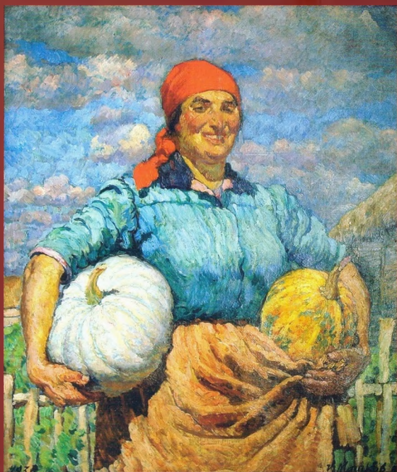
Колхозница с тыквами. 1930