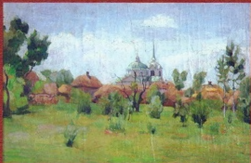
Церковь в селении. 1901-1903