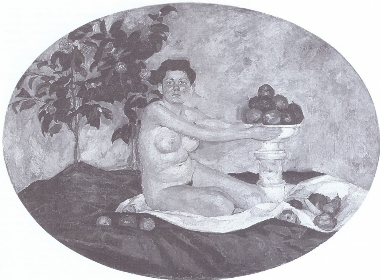
Iļja MAŠKOVŠ. Meitene ar ziediem un augļiem. 1908. Audekls, eļļa. 130 x 170. Latvijas Nacionālais mākslas muzejs Илья МАШКОВ. Девушка с цветами и фруктами. 1908. Холст, масло. 130 x 170. Латвийский Национальный художественный музей