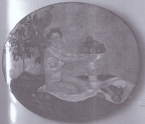
Small text label below the circular painting.