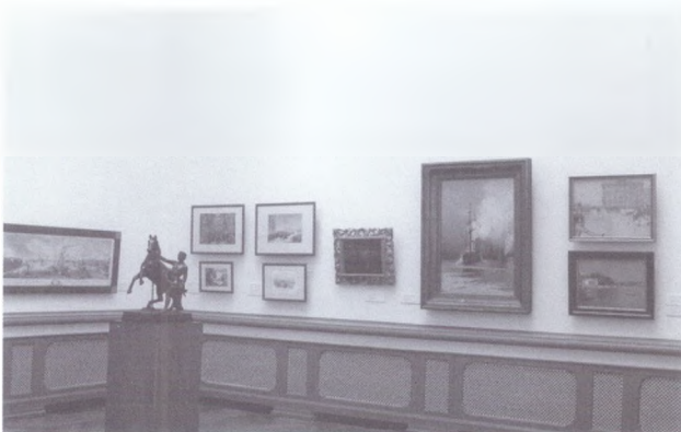
Nikolaja un Svjatoslava Rērihu darbu ekspozīcija. Latvijas Nacionālais mākslas muzejs. 2008

Экспозиция произведений Николая и Святослава Рерихов. Латвийский Национальный художественный музей. 2008