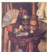
И. И. Машков