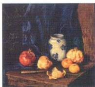
32. Натюрморт на синем фоне. 1930-е Холст, масло. 57,5 × 62,5 Инв. 120 СЖ Картина написана в соавторстве с М.И. Машковой. Still-life Against Blue Background. 1930s Oil on canvas. 57.5 × 62.5 cm Inv. no. 120 СЖ Painted in collaboration with Maria Mashkova.