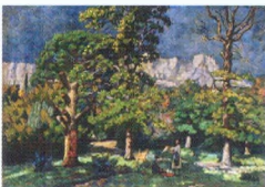
10. Крым. Парк в Алушке. 1923* Холст, масло. 56 × 77 Инв. 209 СЖ The Crimea. The Park in Alupka. 1923* Oil on canvas. 56 × 77 cm Inv. no. 209 СЖ