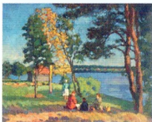
8. Берег Невы. Вечер. 1923 Холст, масло. 47,5 × 56,5 Инв. 205 СЖ The Bank of the Neva. Evening. 1923 Oil on canvas. 47.5 × 56.5 cm Inv. no. 205 СЖ