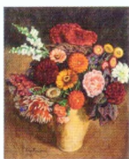
23. Пестрый букет на темном фоне. 1936*