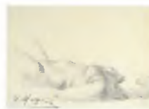
58. Торс лежащей натурщицы. Середина 1920-х Бумага, графитный карандаш, угольный карандаш. 25 × 34,5 Инв. 79 СГ Torso of a lying model. Mid-1920s Graphite pencil, charcoal stick on paper. 25 × 34.5 cm Inv. no. 79 СГ