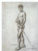
42. Молодой натуращик, держащий в руках палку . 1903–1904 Бумага, итальянский карандаш. 63 × 48 Инв. 66 СГ A young male model holding a stick in hands . 1903–1904 Black chalk on paper. 63 × 48 cm Inv. no. 66 СГ