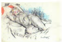
46. Лежащая натуращица . Конец 1910-х Бумага, прессованный уголь, пастель. 36 × 53 На обороте: Стоящая натуращица Инв. 30 СГ Reclining model. Early 1910s Pressed charcoal, pastel on paper. 36 × 53 cm Verso: Standing model Inv. no. 30 СГ