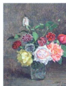
29. Букет. Розы и гвоздика в стеклянной вазе. 1939*