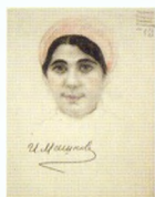
85. Портрет женщины в розовой косынке. Середина 1930-х Бумага, угольный и цветной карандаши. 42 × 28 Инв. 70 СГ Portrait of a woman wearing a pink kerchief. Mid-1930s Charcoal stick and coloured pencils on paper. 42 × 28 cm Inv. no. 70 СГ