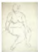
78. Сидящая толстая натурщица. 1920-е Бумага, угольный карандаш. 71 × 52 Инв. 87 СГ Seated stout model. 1920s Charcoal stick on paper. 71 × 52 cm Inv. no. 87 СГ