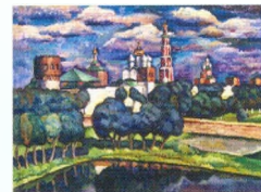
6. Новодевичий монастырь. 1912–1913* Холст, масло. 93,3 × 120 Инв. 75 РЖ The Novodevichy Convent. 1912–1913* Oil on canvas. 93.3 × 120 cm Inv. no. 75 РЖ