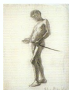
41. Натурищик мальчик с палкой . 1903–1904 Бумага, итальянский карандаш. 63 × 48 Инв. 67 СГ A boy model with a stick . 1903–1904 Black chalk on paper. 63 × 48 cm Inv. no. 67 СГ