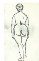
45. Стоящая натуращица . Начало 1910-х Бумага, уголь. 44,5 × 28 На обороте: Стоящая натуращица со спины Инв. 58 СГ Standing model . Early 1910s Charcoal on paper. 44,5 × 28 cm Verso: Standing model viewed from the back Inv. no. 58 СГ