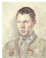
90. Портрет военного летчика, кавалера ордена Отечественной войны I степени и Ордена Боевого Красного Знамени. 1941* Бумага, угольный карандаш, цветные карандаши. 56 × 44 Инв. 61 СГ Portrait of a military pilot awarded the Order of Patriotic War 1st class and the Order of Red Banner. 1941* Charcoal stick, coloured pencils on paper. 56 × 44 cm Inv. no. 61 СГ