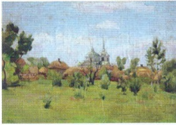
1. Церковь в селении. 1901 Холст, масло. 34 × 49,5 Инв. НВ 139 A Village Church. 1901 Oil on canvas. 34 × 49.5 cm Inv. no. НВ 139