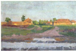
2. Вечерний пейзаж. 1901 Холст, масло. 32 × 49 Инв. НВ 137 Landscape in the Evening Sun. 1901 Oil on canvas. 32 × 49 cm Inv. no. НВ 137