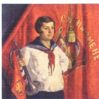
18. Пионерка с горном . 1933* Холст, масло. 92 × 92 Инв. 384 СЖ Young Pioneer Girl with a Bugle . 1933* Oil on canvas. 92 × 92 cm Inv. no. 384 СЖ