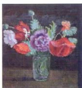
31. Натюрморт. Маки. 1939 Холст, масло. 58,5 × 53 Инв. СЖ 393 Still-life. Poppies. 1939 Oil on canvas. 58.5 × 53 cm Inv. no. СЖ 393