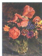
27. Маки, роза, васильки и другие цветы в стеклянной вазе. 1939*