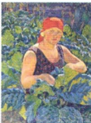
14. Девушка на табачной плантации. 1930 Холст, масло. 107,5 × 80,5 Инв. 270 СЖ Girl on the Tobacco Plantation. 1930 Oil on canvas. 107.5 × 80.5 cm Inv. no. 270 СЖ