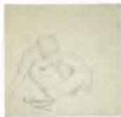
62. Сидящая натура с короткими волосами (с правого бока). Вторая половина 1920-х* Бумага серая, угольный карандаш. 38 × 38 Инв. 85 СГ

Model in a complicated attitude. Second half of the 1920s Graphite pencil on grey toned paper. 35.5 × 53 cm Inv. no. 89 СГ