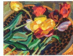
5. Тюльпаны на блюде. Около 1908* Холст, масло. 35 × 45,5 Инв. 74 РЖ Tulips on a Plate. Сі 1908* Oil on canvas. 35 × 45.5 cm Inv. no. 74 РЖ