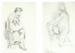
79. Этюд натурщицы. 1920-е Бумага, уголь, белила. 54,5 × 35 На обороте: Обнаженная натурщица, стоящая на правом колене. Набросок Инв. 51 СГ Study of a model. 1920s Charcoal, white ob paper. 54.5 × 35 cm Verso: A nude model kneeling on her right knee Sketch Inv. no. 51 СГ