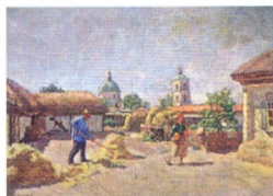
33. Дворик в станице Михайловской. 1930-е Холст, масло. 94 × 130 Инв. 271 СЖ A Yard in the Village of Mikhailovskaya. 1930s Oil on canvas. 94 × 130 cm Inv. no. 271 СЖ