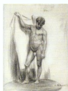
40. Натурищик . 1902–1903 Бумага, итальянский карандаш. 62 × 48 Инв. 64 СГ A model . 1902–1903 Black chalk on paper. 62 × 48 cm Inv. no. 64 СГ