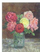
28. Натюрморт. Розы и пионы в стеклянной банке. 1939*