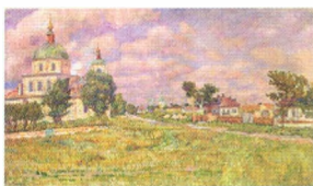
15. Станица Михайловская . 1933 Холст, масло. 83 × 140 Инв. 269 СЖ The Village of Mikhailovskaya . 1933 Oil on canvas. 83 × 140 cm Inv. no. 269 СЖ