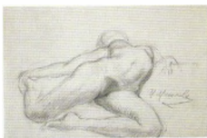
61. Натурица в сложном ракурсе. Вторая половина 1920-х Бумага серая, графитный карандаш. 35,5 × 53 Инв. 89 СГ

Model in a complicated attitude. Second half of the 1920s Graphite pencil on grey toned paper. 35.5 × 53 cm Inv. no. 89 СГ