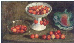
26. Черешня. 1939*