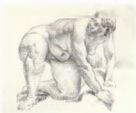
72. Натурица, стоящая на одном колене . 1920-е Бумага, угольный карандаш, белила. 32 × 39 Инв. 81 СГ Model kneeling on one-knee . 1920s Charcoal stick, white on paper. 32 × 39 cm Inv. no. 81 СГ