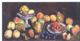
30. Фрукты с сельскохозяйственной выставки. Айва и персики. 1939*