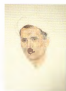
57. Голова мужчины. 1925 Бумага, угольный карандаш, пастель. 67 × 51 Инв. 62 СГ Male head. 1925 Charcoal stick, pastel on paper. 67 × 51 cm Inv. no. 62 СГ