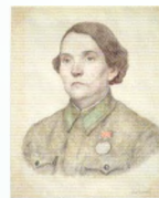
95. Портрет женщины с медалью «За боевые заслуги». 1942–1943* Бумага, угольный и цветной карандаши. 64 × 44 Инв. 47 СГ

Senior military medical assistant wearing a kerchief with a red cross. 1942–1943 Charcoal stick, coloured pencils on paper. 48.5 × 44 cm Inv. no. 50 СГ