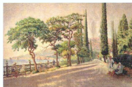
21. Артек . 1934 Вариант-повторение картины «Сентябрьское утро в Артеке» (1934) Холст, масло 160 × 242 Инв. 386 СЖ Artek . 1934 Variant of September Morning in Artek (1934) Oil on canvas. 160 × 242 cm Inv. no. 386 СЖ