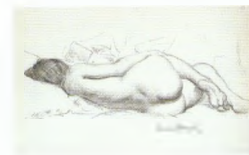
67. Лежащая натура с книгой. Вторая половина 1920-х Бумага, графитный карандаш, угольный карандаш. 36 × 54 Инв. 56 СГ

Model reclining on one side. Second half of the 1920s Charcoal stick on paper. 36 × 54.5 cm Inv. no. 71 СГ