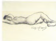
75. Натурица, лежащая на спине . 1920-е* Бумага, угольный карандаш. 36 × 46 Инв. 82 СГ Model lying on her back . 1920s* Charcoal stick on paper. 36 × 46 cm Inv. no. 82 СГ