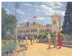
12. Ливадийский крестьянский курорт. 1925 Холст, масло. 80 × 106,5 Инв. 321 СЖ Livadia Peasant Resort. 1925 Oil on canvas. 80 × 106.5 cm Inv. no. 321 СЖ