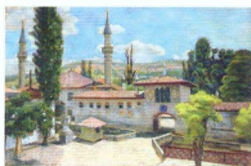
56. Бахчисарай. Ханский дворец. 1925 Картон, пастель. 54 × 70 Инв. 33 СГ Bakhchisarai. Khan's Palace. 1925 Pastel on cardboard. 54 × 70 cm Inv. no. 33 СГ