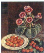
25. Цветок в горшке и клубника. 1938*