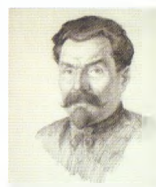
89. Мужской портрет. 1930-е Бумага, уголь, карандаш. 68 × 51,5 Инв. 63 СГ Male portrait. 1930s Charcoal, pencil on paper. 68 × 51.5 cm Inv. no. 63 СГ