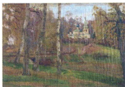
3. Пейзаж с церковью. Шатровая колокольня в парке. 1902–1904 Холст, масло. 34 × 49,5 Инв. НВ 138 Landscape with a Church. Bell Tent in the Park. 1902–1904 Oil on canvas. 34 × 49.5 cm Inv. no. НВ 138