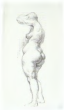
70. Стоящая фигура (в профиль) . Вторая половина 1920-х Бумага, графитный и черный карандаши. 43 × 26 Инв. 55 СГ Standing figure (profile) . Second half of the 1920s Graphite and black pencils on paper. 43 × 26 cm Inv. no. 55 СГ