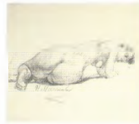
74. Натурица (полулежащая) . 1920-е Бумага, угольный карандаш. 32 × 37 Инв. 74 СГ Model (in a half-reclining position) . 1920s Charcoal stick on paper. 32 × 37 cm Inv. no. 74 СГ