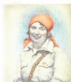
80. Портрет девушки в красной косынке. Конец 1920-х – начало 1930-х Бумага, цветной и угольный карандаши. 62,5 × 51,5 Инв. 40 СГ Portrait of a Young Girl Wearing a Red Kerchief. Late 1920s – early 1930s Coloured pencil and charcoal stick on paper. 62.5 × 51.5 cm Inv. no. 40 СГ