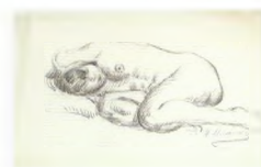
66. Натурица, лежащая на боку. Вторая половина 1920-х Бумага, угольный карандаш. 36 × 54,5 Инв. 71 СГ

Seated model with a short haircut. Second half of the 1920s Graphite and black pencils on paper. 54 × 36 cm Inv. no. 52 СГ