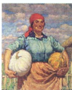
13. Колхозница с тыквами. 1930* Холст, масло. 120 × 97,5 Инв. 268 СЖ Woman Farmer with Pumpkins. 1930* Oil on canvas. 120 × 97.5 cm Inv. no. 268 СЖ