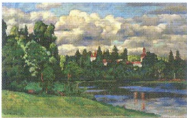
9. Нева. Островки. Дом отдыха. 1923* Холст, масло. 55 × 86,5 Инв. 207 СЖ The Neva. Ostrovki. A Holiday Home. 1923* Oil on canvas. 55 × 86.5 cm Inv. no. 207 СЖ