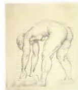
64. Нагнувшаяся натура с короткими волосами. Вторая половина 1920-х Бумага, угольный карандаш. 39 × 32 Инв. 83 СГ

Model seated on a chair. Second half of the 1920s Graphite pencil on paper. 43 × 27 cm Inv. no. 73 СГ