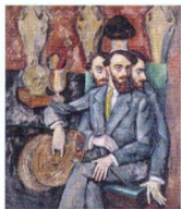
7. Портрет художника Адольфа Израилевича Мильмана. 1916–1917* Холст, масло. 167,5 × 142,5 Инв. 77 РЖ Portrait of the painter Adolf Izrailevich Milman. 1916–1917* Oil on canvas. 167.5 × 142.5 cm Inv. no. 77 РЖ