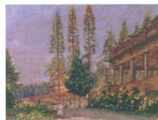
35. Дача в Абрамцево. 1942 Холст, масло. 43,5 × 57 Инв. 395 СЖ The Country House in Abramtsevo. 1942 Oil on canvas. 43.5 × 57 cm Inv. no. 395 СЖ