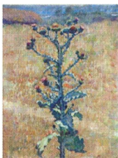
17. Степь. Репейник . 1933 Холст, масло. 84 × 62,5 Инв. 210 СЖ The Steppe. Burdock . 1933 Oil on canvas. 84 × 62.5 cm Inv. no. 210 СЖ