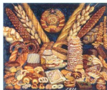
22. Советские хлебы . 1936 I вариант. Холст, масло. 150 × 180 Инв. 206 СЖ The Soviet Bread . 1936 First variant. Oil on canvas. 150 × 180 cm Inv. no. 206 СЖ