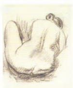
47. Сидящая натуращица со спины . Конец 1910-х – начало 1920-х* Бумага тонированная, прессованный уголь, сепия. 45,5 × 36 Инв. 31 СГ Seated model viewed from the back. Late 1910s – early 1920s* Pressed charcoal, sepia on toned paper. 45.5 × 36 cm Inv. no. 31 СГ