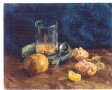
34. Натюрморт. Мандарины и стакан. 1930-е* Картон, масло. 24,5 × 30 Инв. 389 СЖ Still-life. Tangerines and a Glass. 1930s* Oil on canvas. 24.5 × 30 cm Inv. no. 389 СЖ