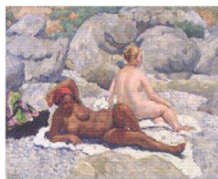
11. Гурзуф. Женский пляж (с двумя фигурами). 1925* Холст, масло. 65,5 × 81,5 Инв. СЖ 215 Gurzuf. Ladies' Beach (with two figures). 1925* Oil on canvas. 65.5 × 81.5 cm Inv. no. СЖ 215