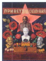
20. Привет XVII съезду ВКП(б) . 1934* Холст, масло. 131,5 × 100 Инв. 323 СЖ Greetings to the 17th Congress of the VKP(b) . 1934* Oil on canvas. 131.5 × 100 cm Inv. no. 323 СЖ