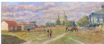
16. Площадь в станице Михайловской . 1933 Холст, масло. 50 × 119 Инв. 211 СЖ Market Place in the Village of Mikhailovskaya . 1933 Oil on canvas. 50 × 119 cm Inv. no. 211 СЖ