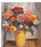
24. Пестрый букет в глиняном кувшине на светлом фоне. 1936*