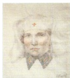
94. Старший военфельдшер в косынке с красным крестом. 1942–1943 Бумага, угольный карандаш, цветные карандаши. 48,5 × 44 Инв. 50 СГ

Portrait of an artilleryman. 1942–1943 Charcoal stick, graphite and coloured pencils on paper. 57 × 43.5 cm Inv. no. 37 СГ