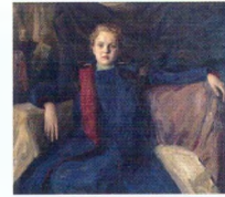
4. Портрет девочки. 1903–1904 Холст, масло. 100 × 112 Инв. 76 РЖ Portrait of a Young Girl. 1903–04 Oil on canvas. 100 × 112 cm Inv. no. 76 РЖ