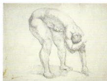
76. Натурица (наклонившаяся), касающаяся рукой пола . 1920-е Бумага, графитный карандаш. 52 × 71 Инв. 76 СГ Model (bent down) touching the floor with her hand . 1920s Graphite pencil on paper. 52 × 71 cm Inv. no. 76 СГ