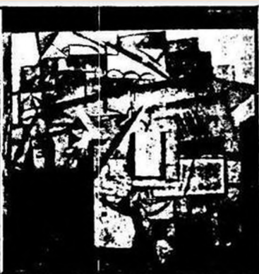
„Дама въ трамваѣ“, Малевича.

отъ РЕДАЦИИ Помѣшая „произведенія“ „Бубновых валетовъ“, редакція считаетъ необходимымъ удостовѣрить, что это—не мистификація, а настоящіе снимки съ картинъ, одѣланные фотографомъ.